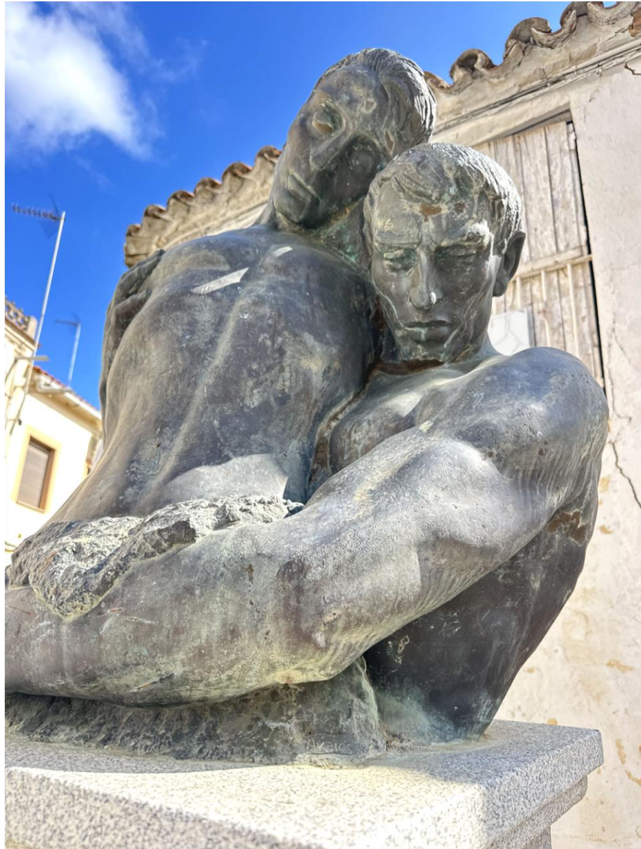
Detalle de la escultura "Ayuda al caído".