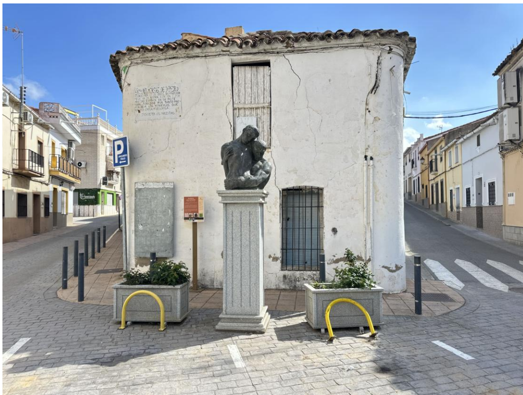
Escultura de Juan de Ávalos en Casas de Don Pedro.