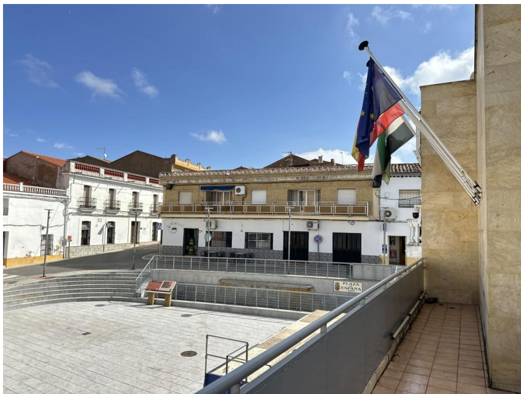
Imágenes de la Plaza de España remodelada vistas desde el ayuntamiento.