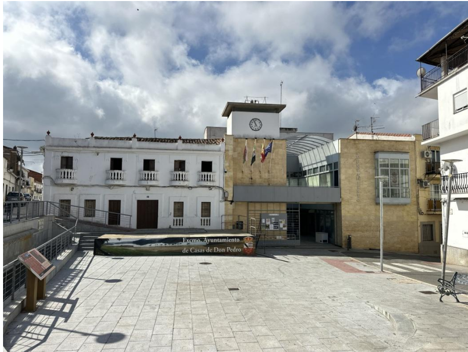
Imagen de la Plaza de España con el ayuntamiento al fondo.