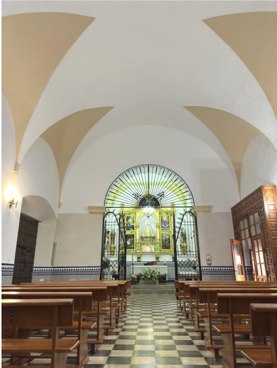
Interior de la ermita con el retablo protegido por una verja.