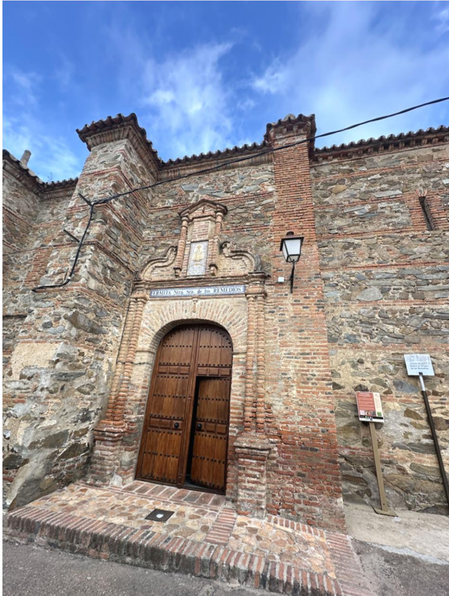
Fachada principal de la ermita.