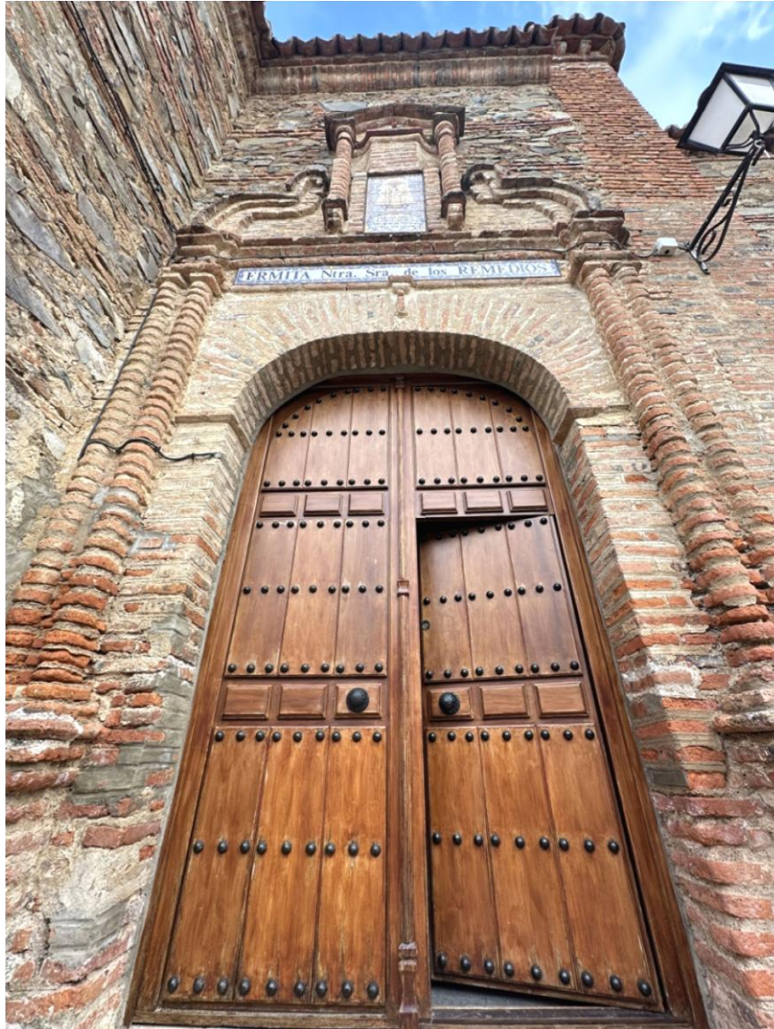
Detalle de la puerta y la zona de acceso.