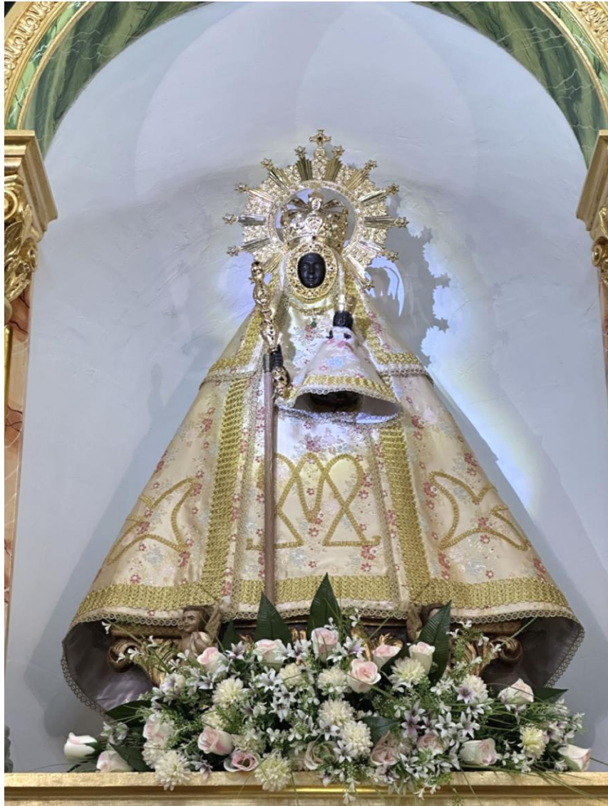
Imagen de la Virgen morenita de la Ermita de la Virgen de los Remedios.