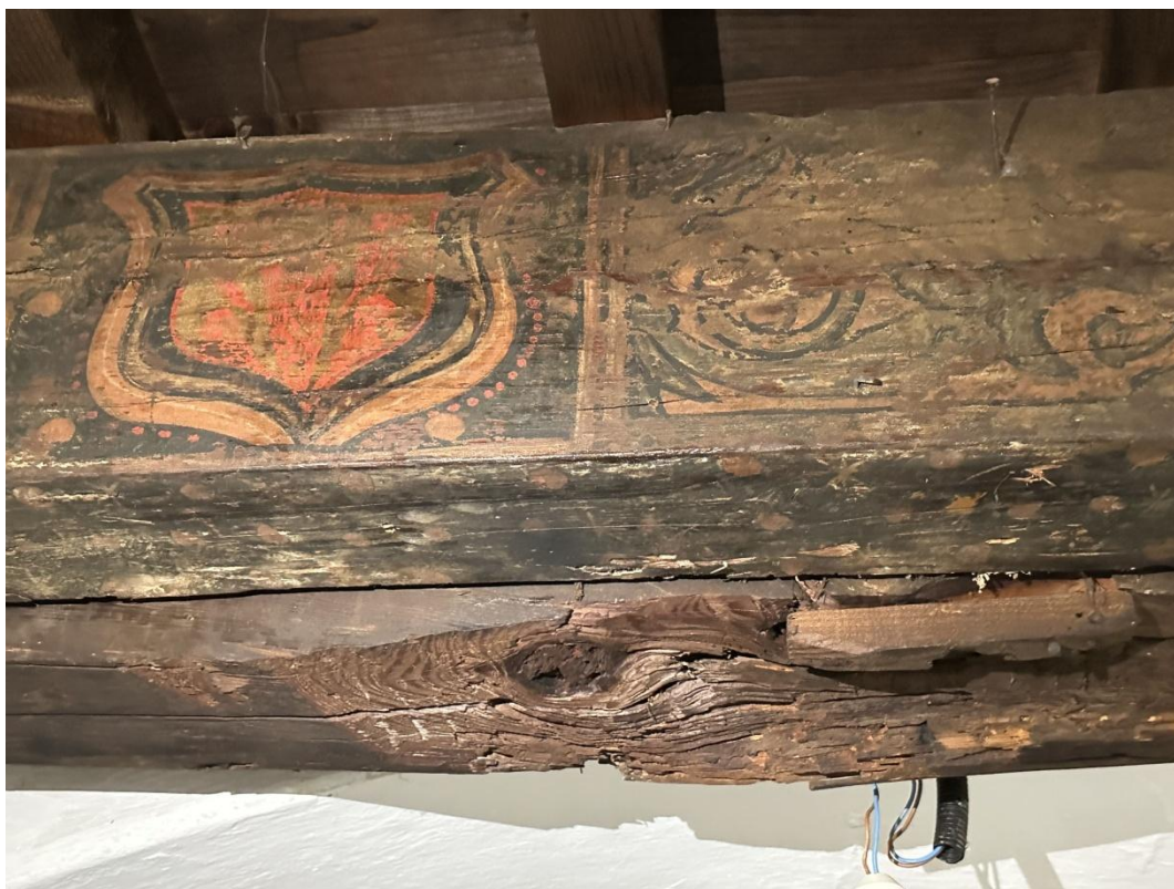
Viga de madera policromada.