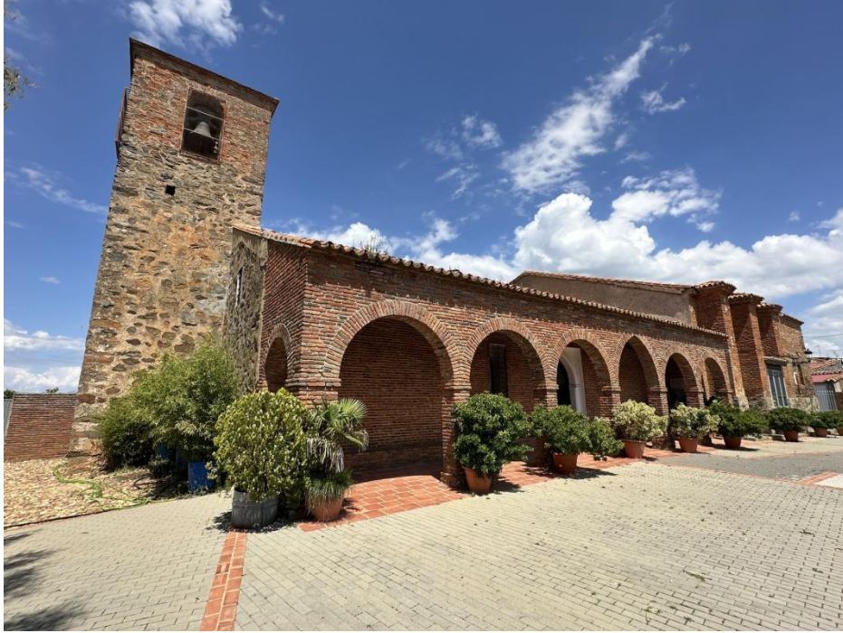
Vista general de la iglesia.