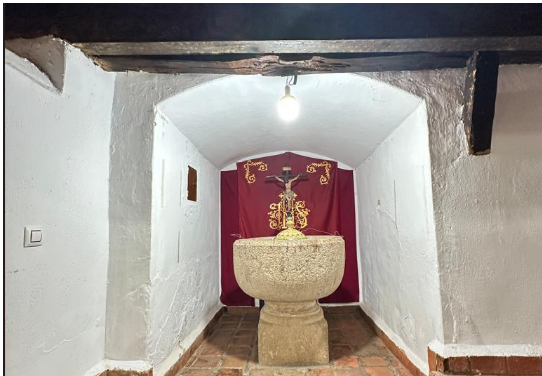
Pila bautismal en granito.