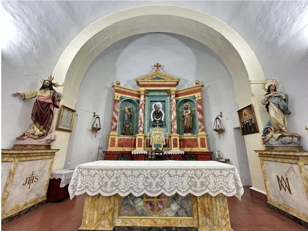
Detalle del presbiterio y el retablo.