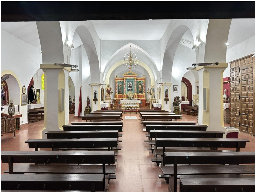
Vista general del interior de la iglesia.