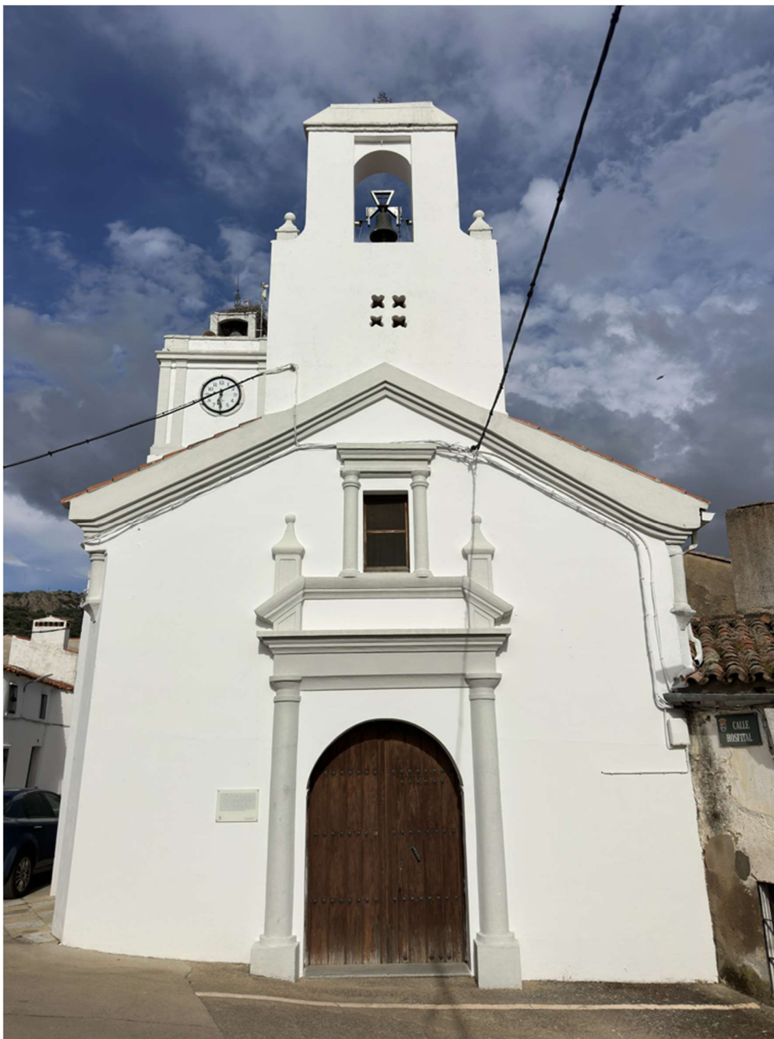
Fachada principal y acceso a la capilla.