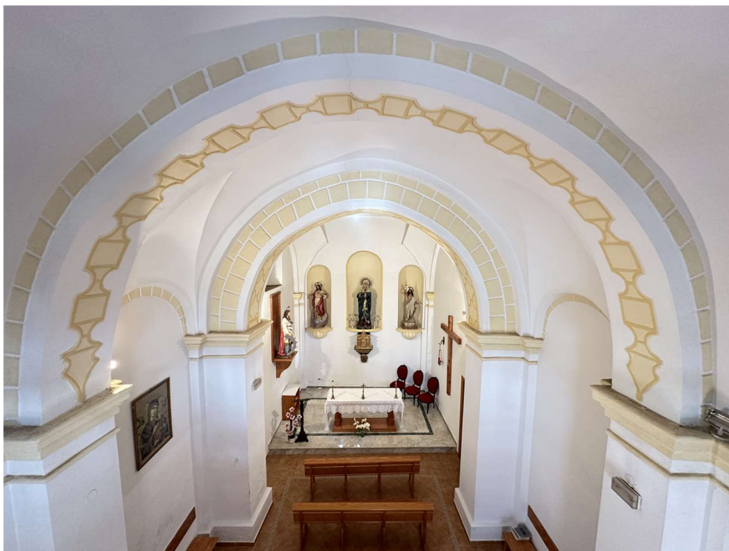
En la imagen superior, vista del templo desde el coro. Abajo, detalle de la cúpula.