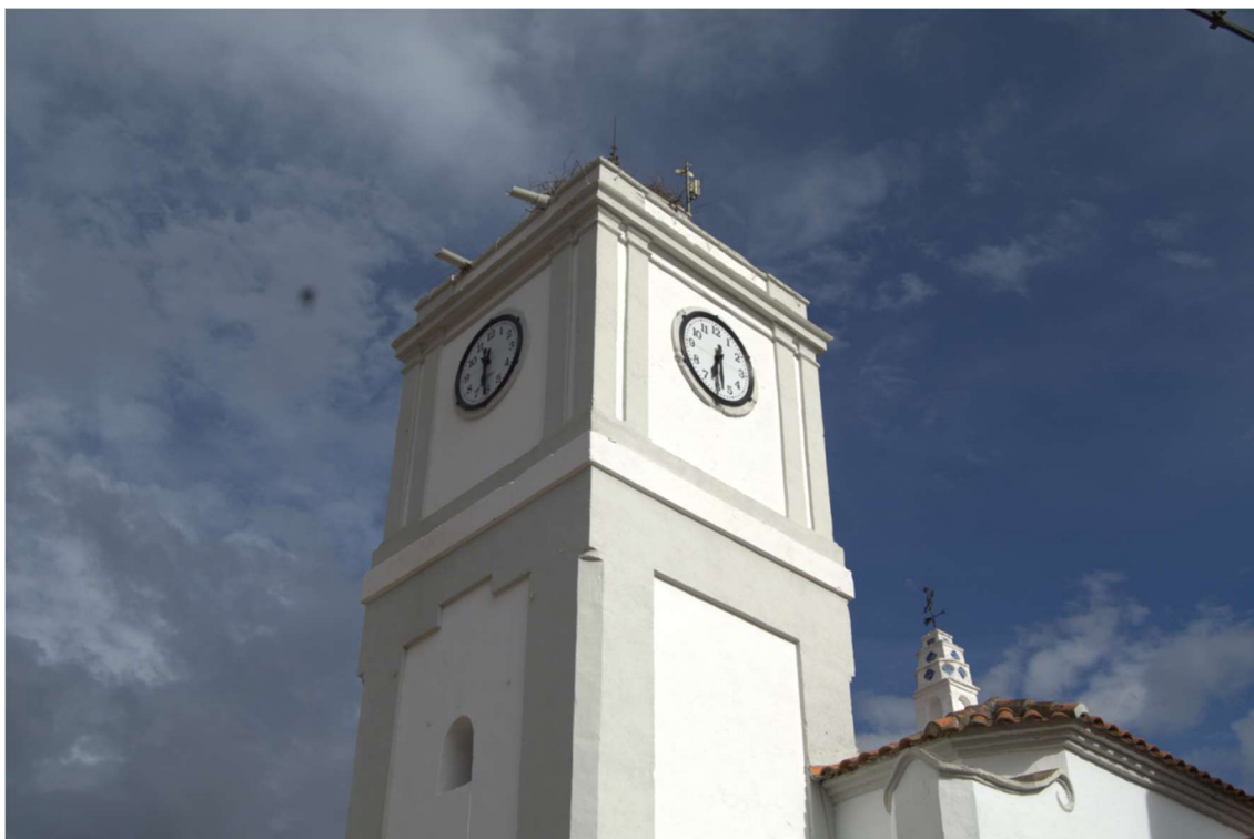
En la imagen superior, Torre del Reloj. En la imagen inferior veleta que corona el tejado.