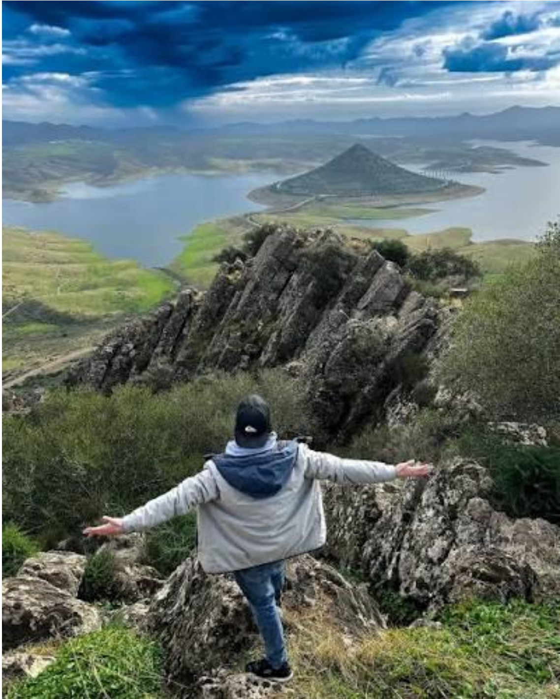
Cerro Masatrigo ya es conocido como la rotonda más grande de Europa.