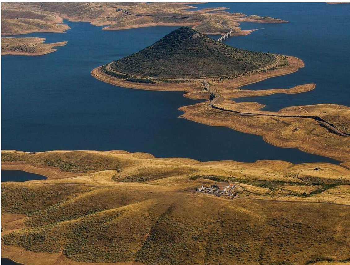
La singularidad geométrica del cerro lo ha convertido en escenario de numerosas campañas promocionales.