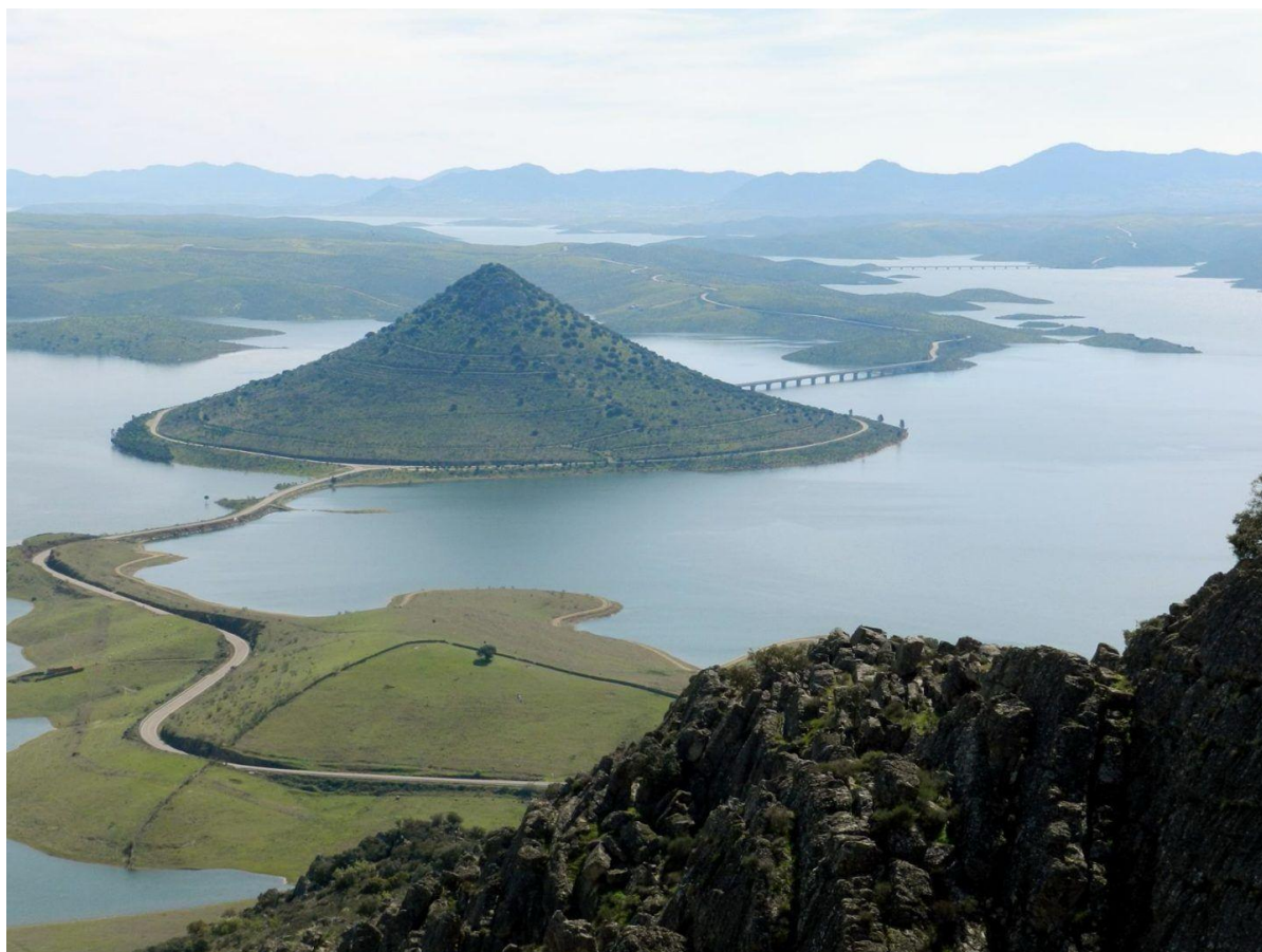
Cerro Masatrigo, declarado Monumento Natural de Extremadura en el año 2023.