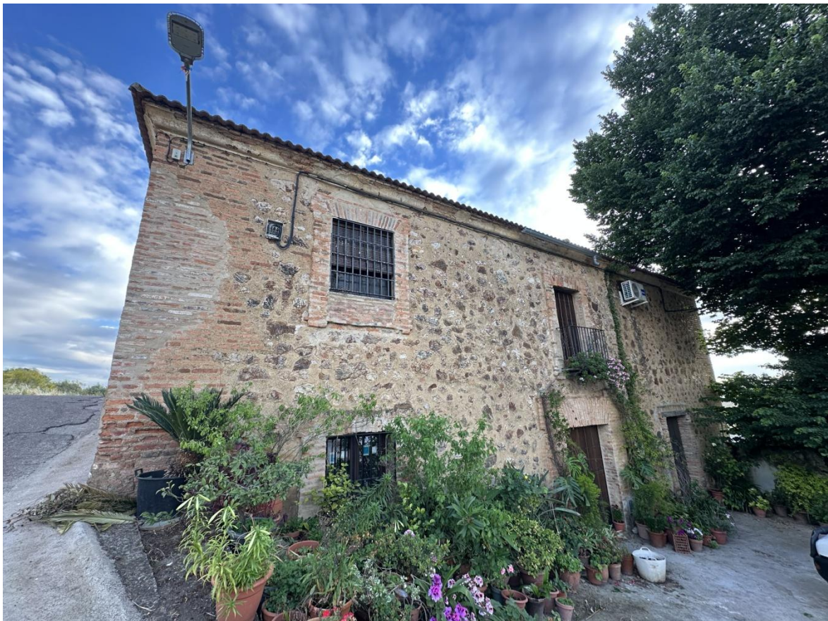
Vista de la fachada principal de la Casa de la Encomienda de Galizuela.