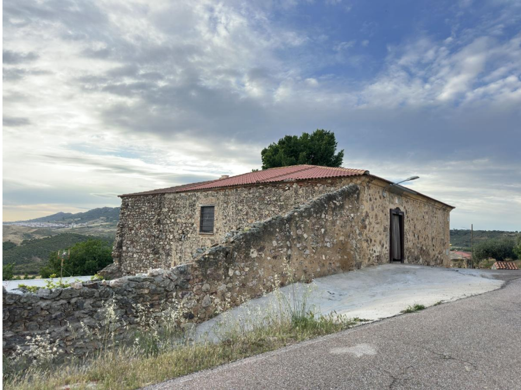
Arriba, planta superior del edificio. Abajo, zona de acceso.