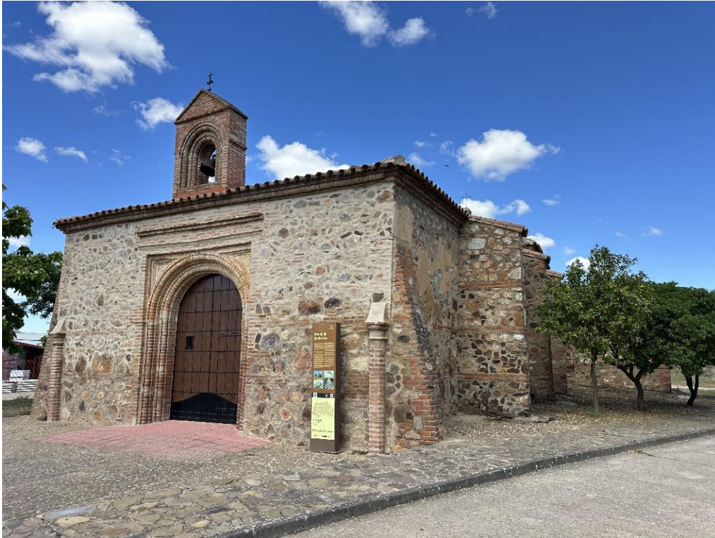
Vistas de la ermita desde distintos ángulos.