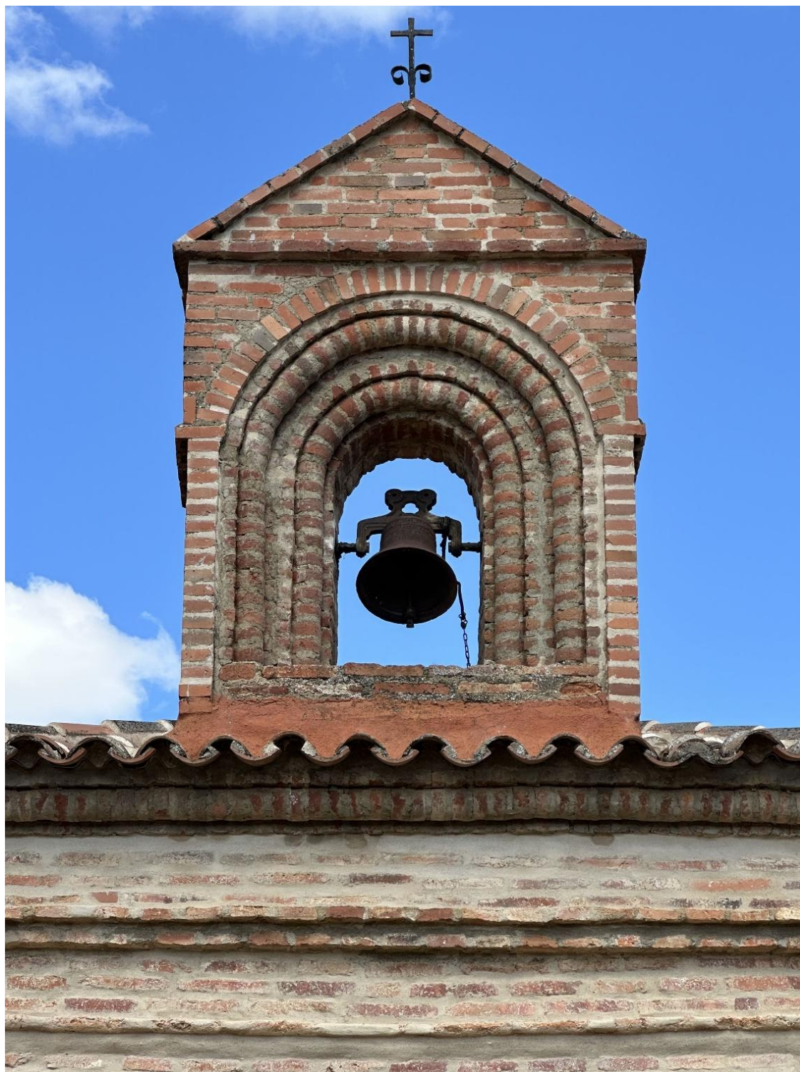
Espadaña de ladrillo con campana en la ermita.