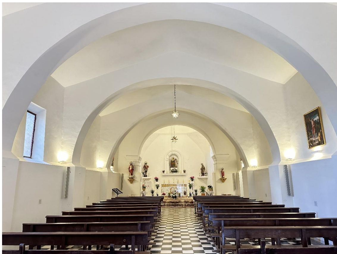
Vista general con los cuatro arcos de medio punto sobre los que descansan vigas, forjados y cubierta.