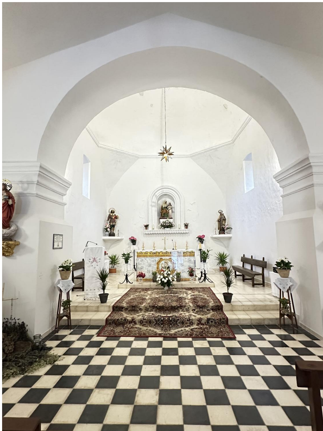
Cúpula de media naranja asentada sobre base octogonal apoyada en los muros y en el arco.