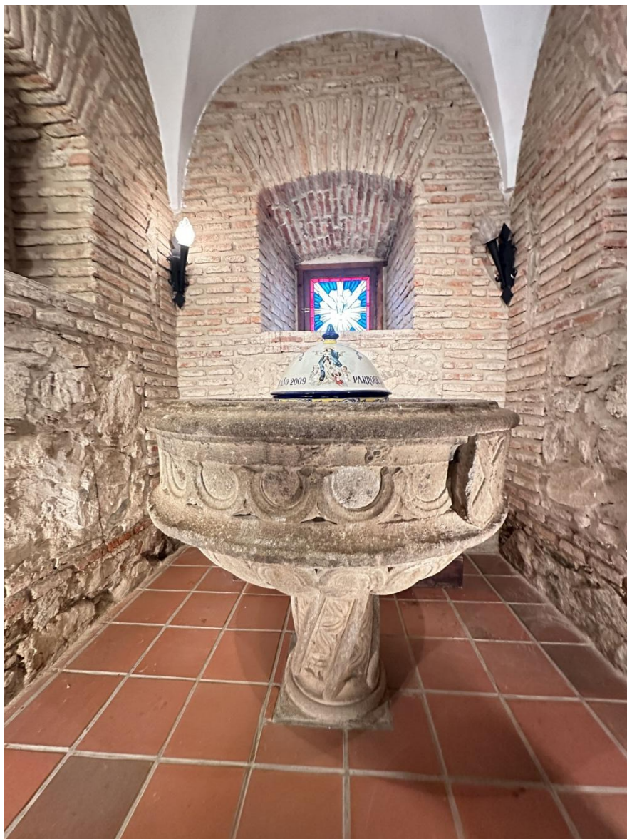
Imagen de la pila bautismal en granito, que data del año 1515.