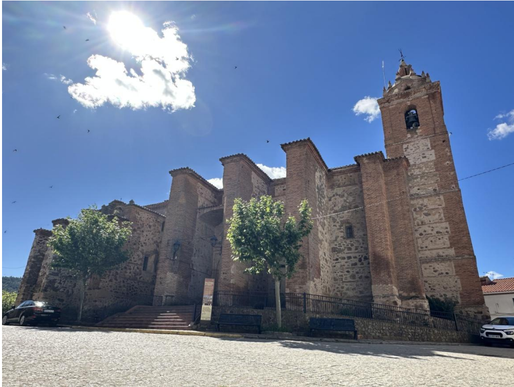
Imagen exterior del templo (arriba) y vista interior.