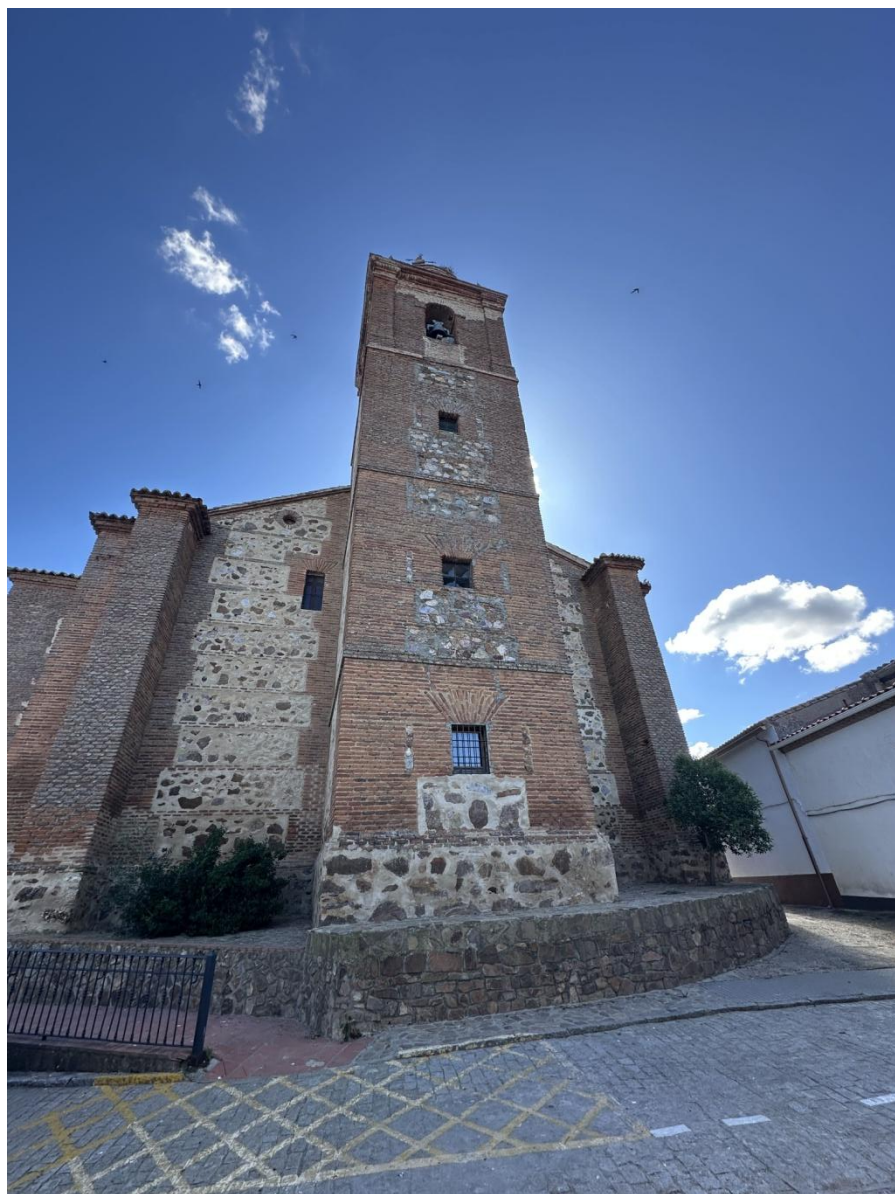
Fachada de la iglesia, que presenta una construcción sólida en piedra y ladrillo.