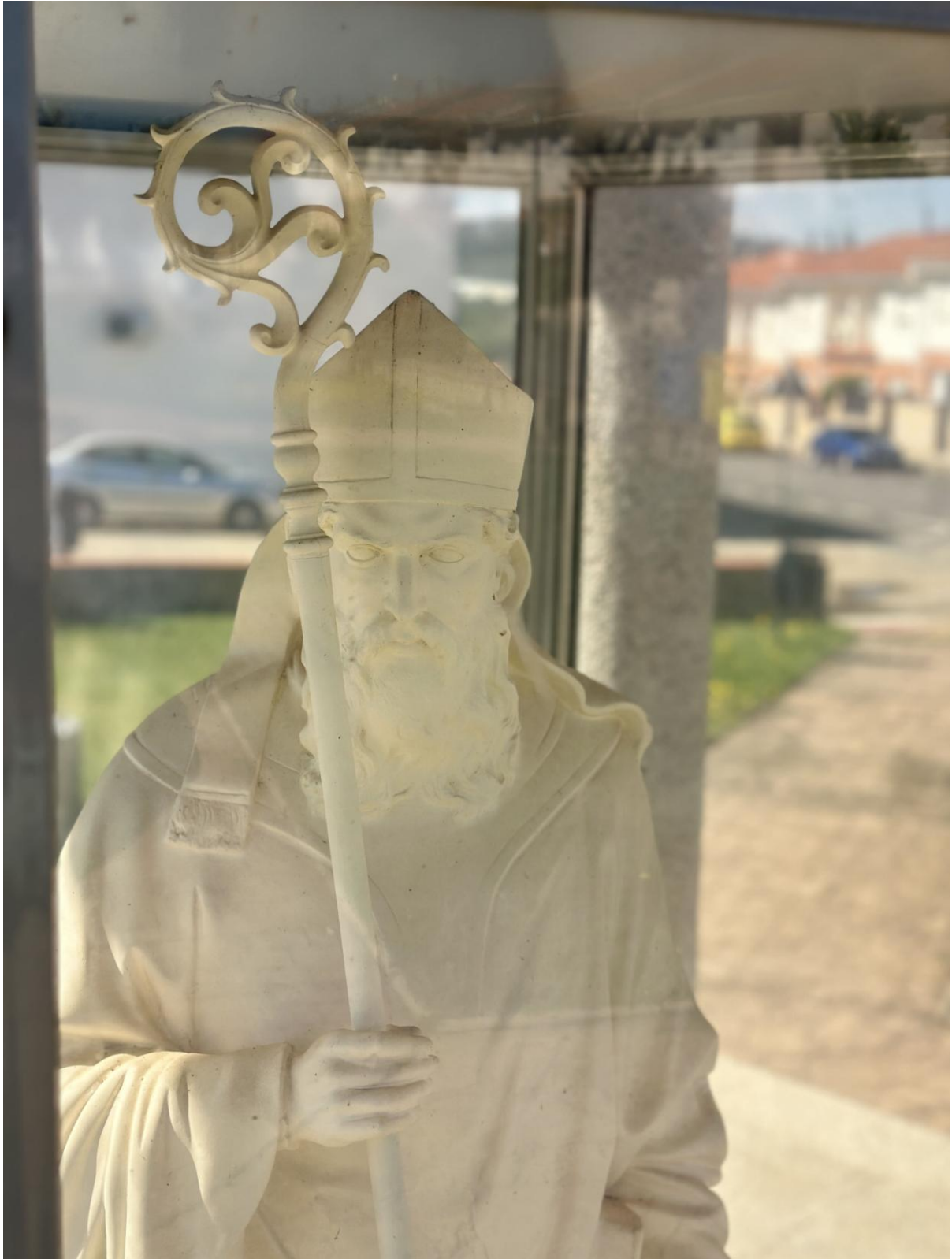
Imagen de San Ambrosio en el parque del mismo nombre.