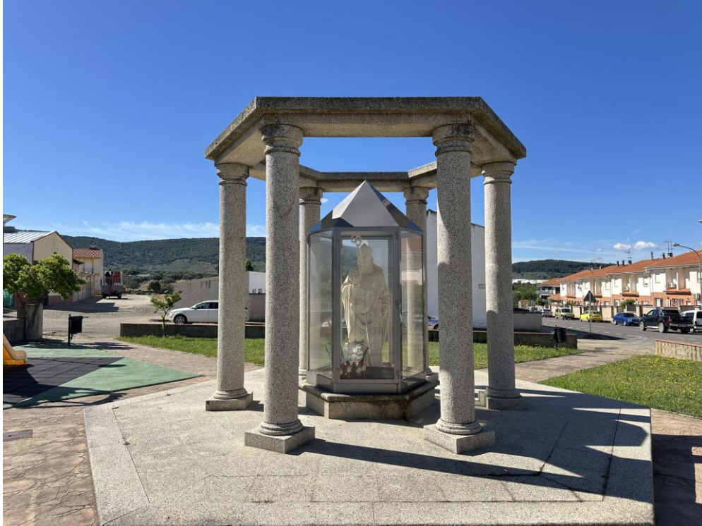
Arriba, imagen de la estatua. Abajo, la estatua y el parque en el que está ubicada.