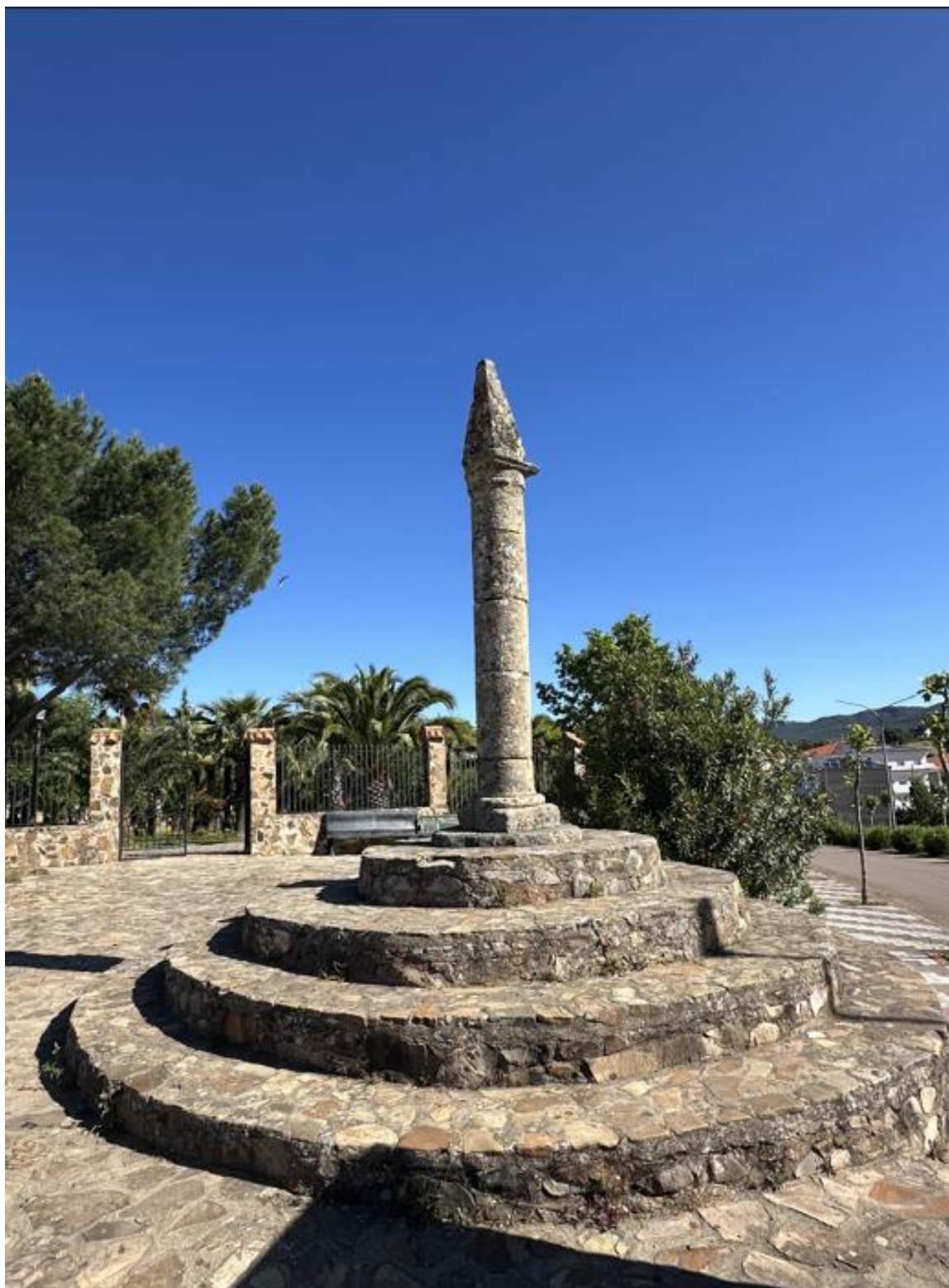
Base de gradas escalonadas sobre las que se asienta el Rollo de Santa Ana.