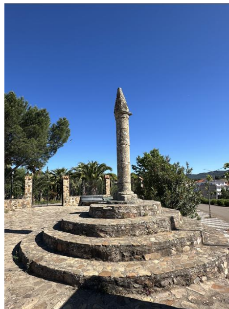
Imágenes del Rollo de Santa Ana.