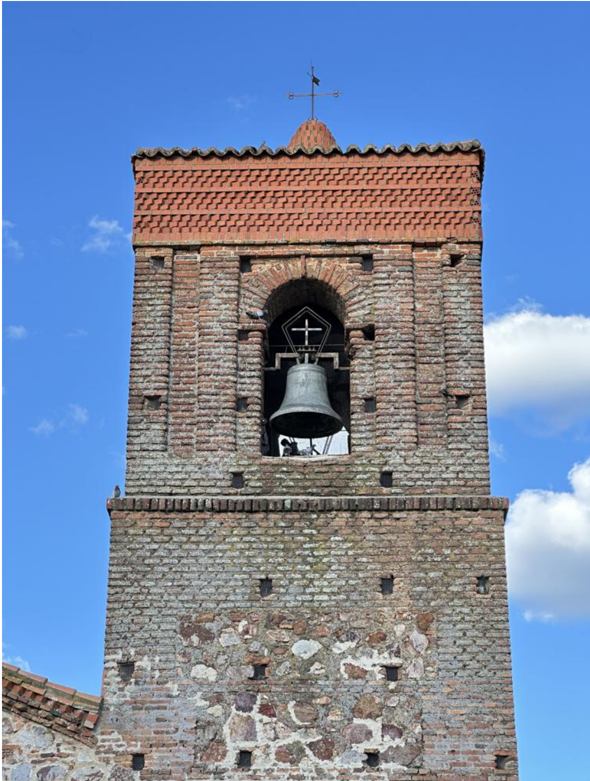
Detalle de la torre cuadrangular integrada en la fachada del templo.