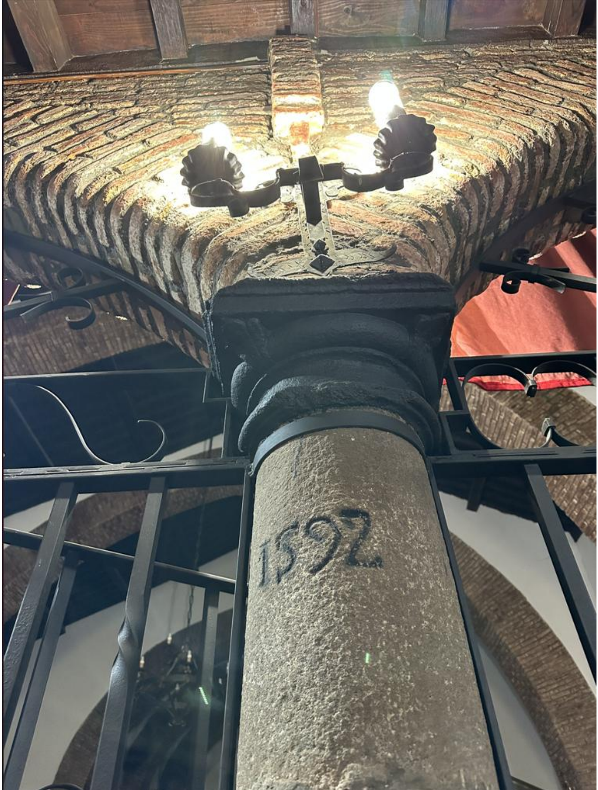
Inscripción en una de las columnas de piedra de acceso al templo.