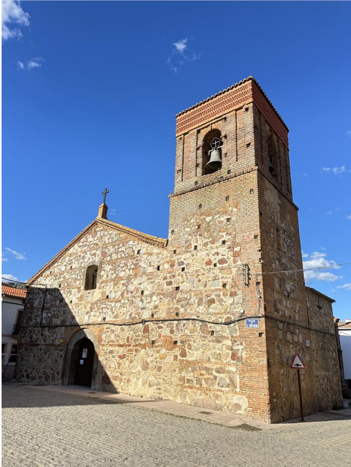
Fachada principal de la iglesia.