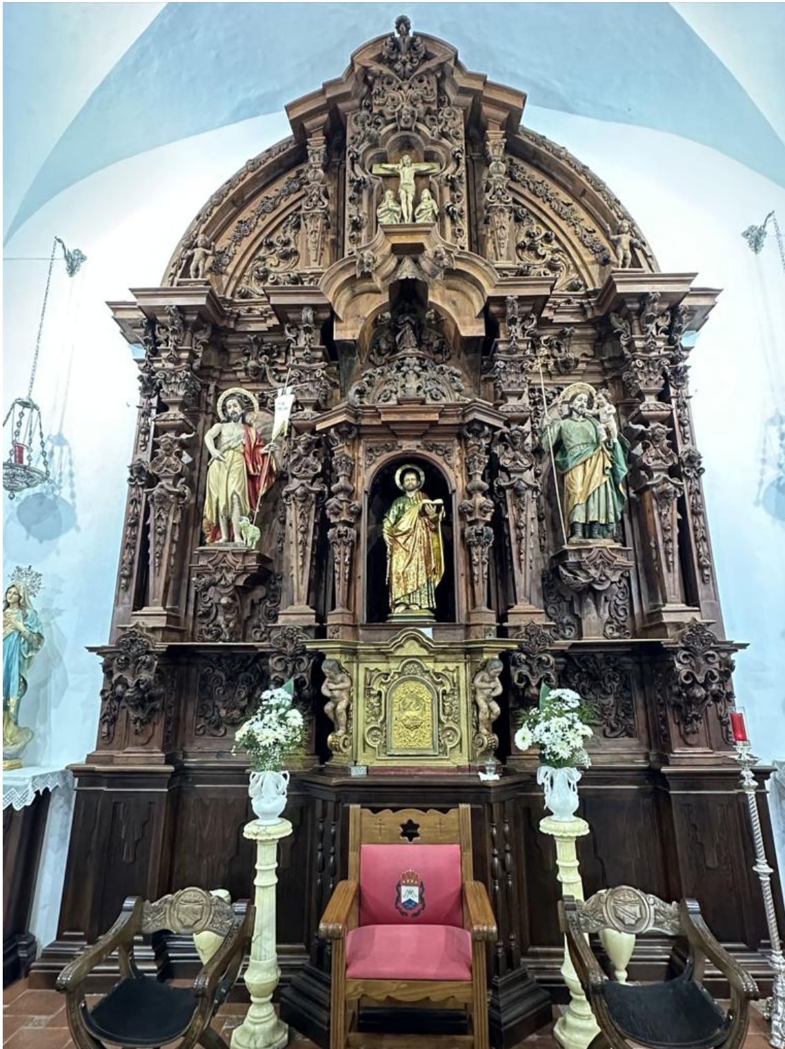
Retablo mayor barroco, recientemente restaurado, con imágenes de San Juan, San Pedro y San José.