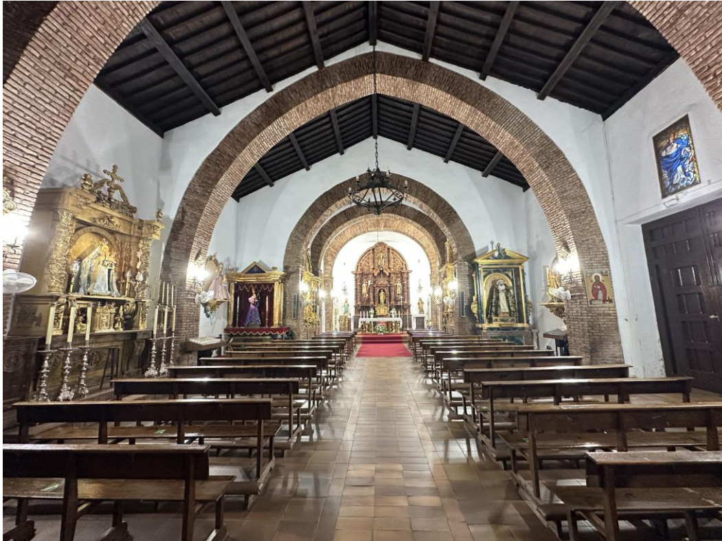
Nave principal de cuatro tramos mediante arcos apuntados que sostienen la cubierta de madera.