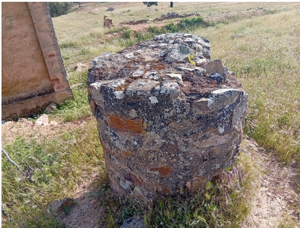
Restos romanos hallados en la zona.