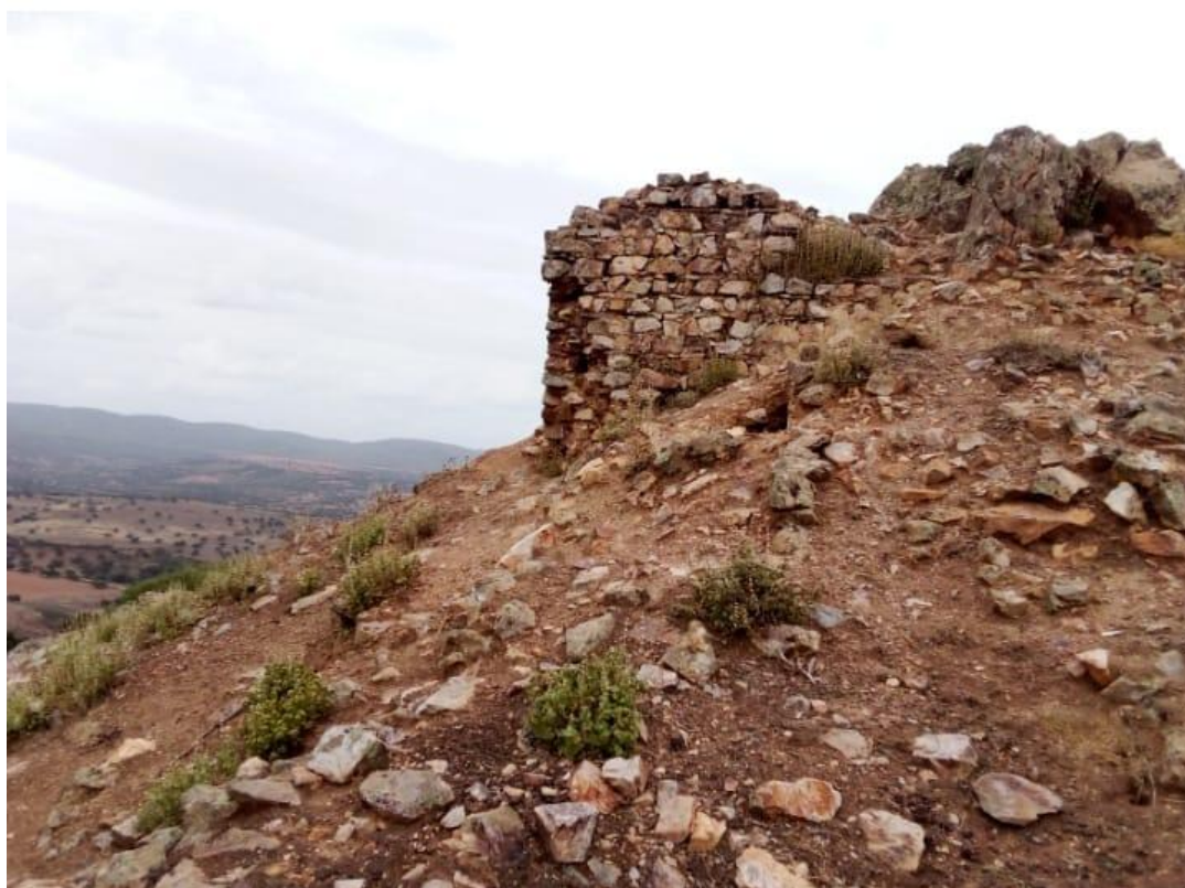
La Minilla forma parte de la memoria histórica y arqueológica de Garlitos.