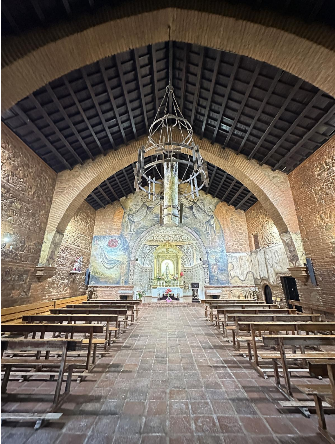
Interior de la ermita.