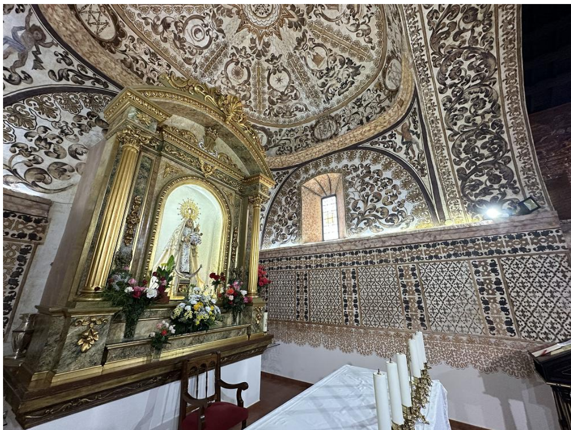
Presbiterio y cúpula de la ermita.