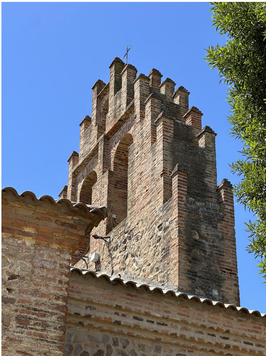
Espadaña escalonada de la ermita.