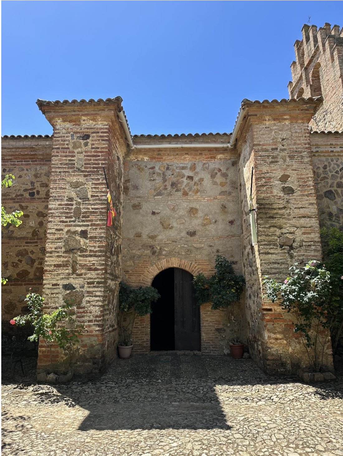
Acceso principal a la ermita.