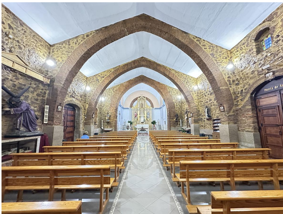
Su disposición facilita la visibilidad del altar desde cualquier punto del interior.