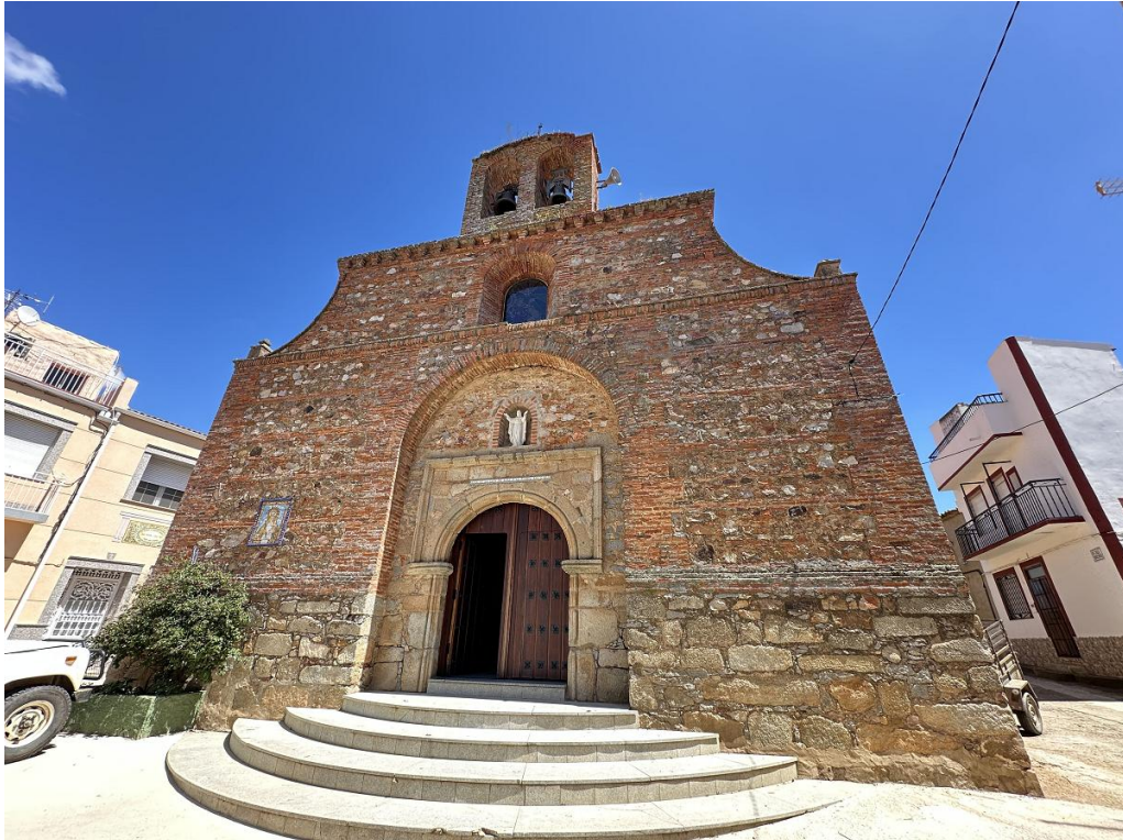
Vista frontal del edificio, de una sola nave.