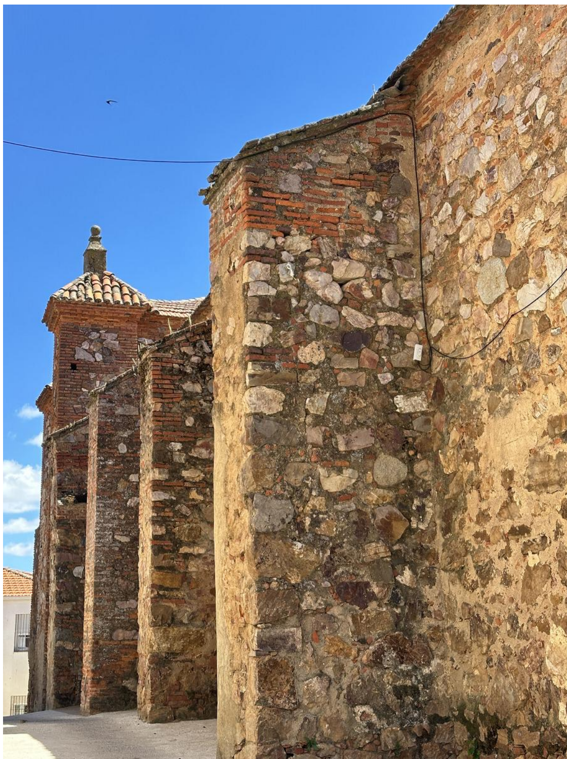
Muros de mampostería reforzados con sillares de granito en esquinas y vanos.