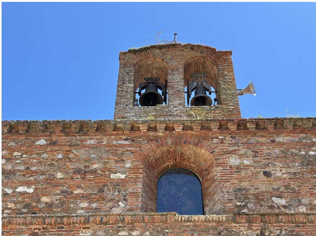
Espadaña doble con campanas.