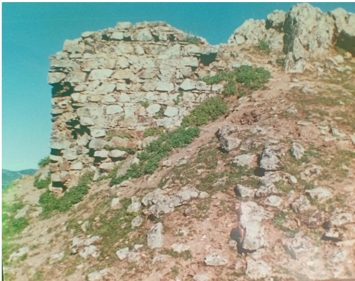
Restos del Castillo Árabe de La Minerva.