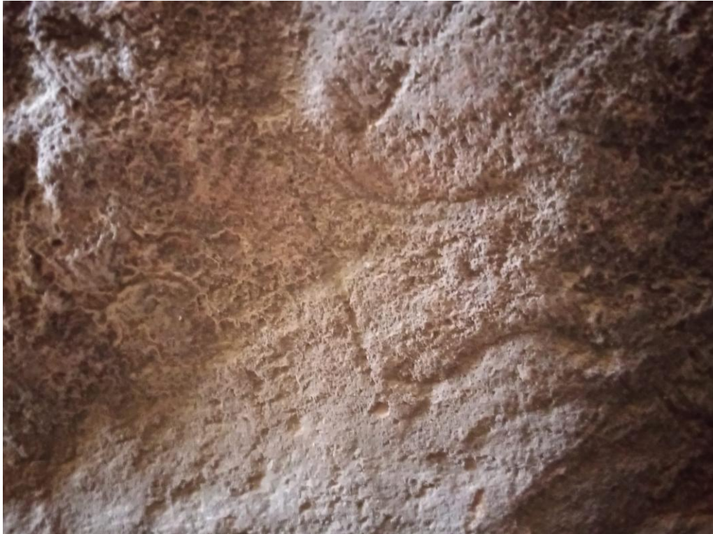
Detalle de pinturas halladas en el lugar.