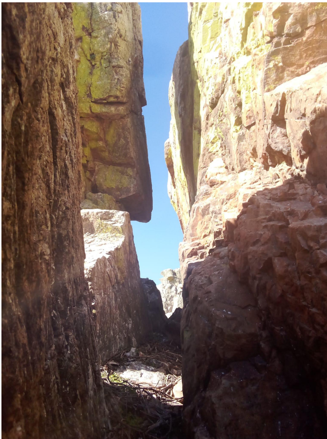
Espacio arqueológico configurado con el paso del tiempo.