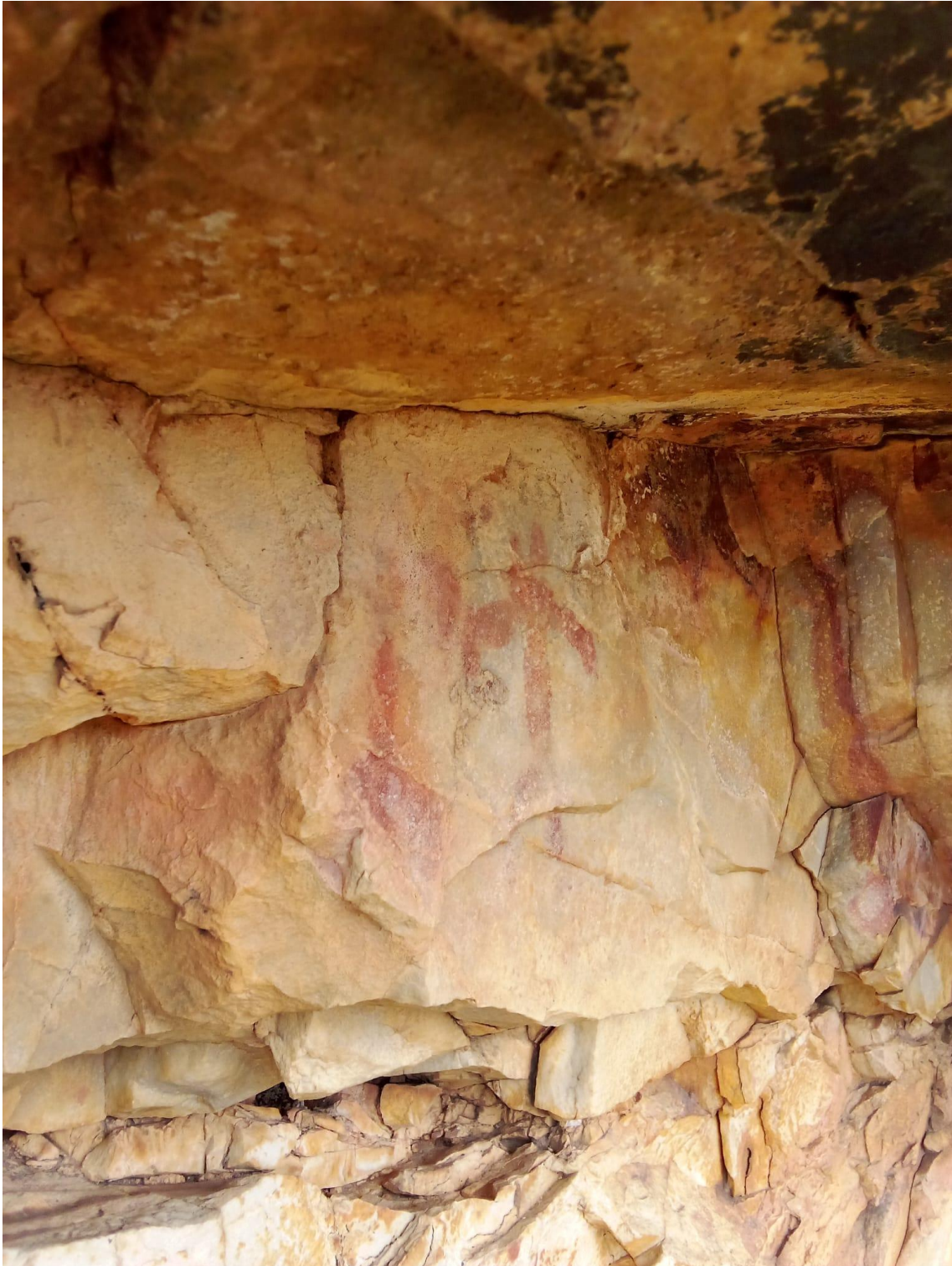
Hay evidencias que se remontan al Calcolítico (entre el 2500 y el 2000 a.C.).