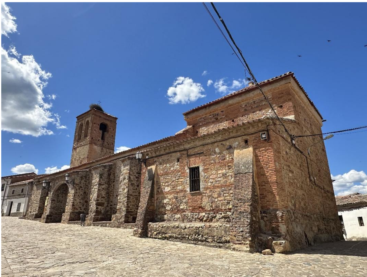
Vista de la iglesia, con un modelo de arquitectura religiosa rural desarrollados en el ámbito mudéjar extremeño.