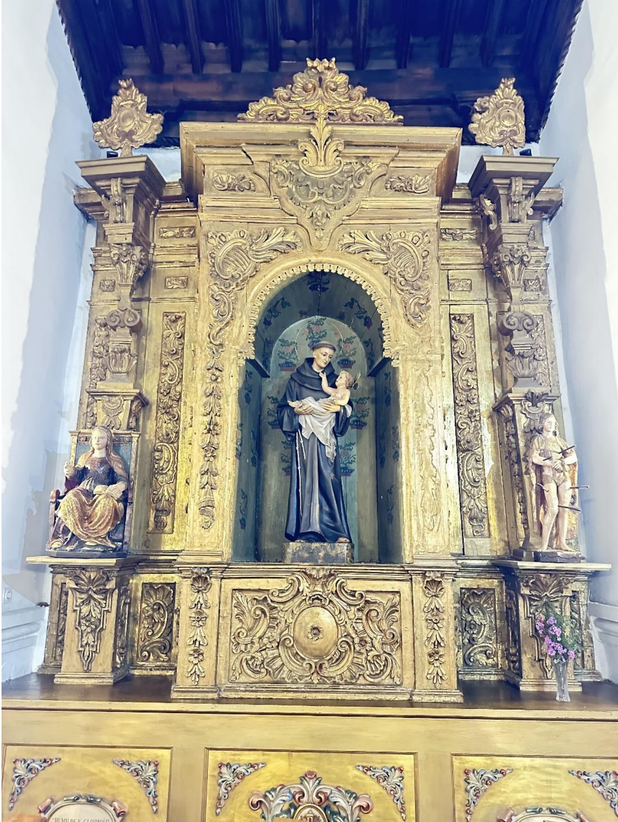
Detalle del interior de la iglesia.