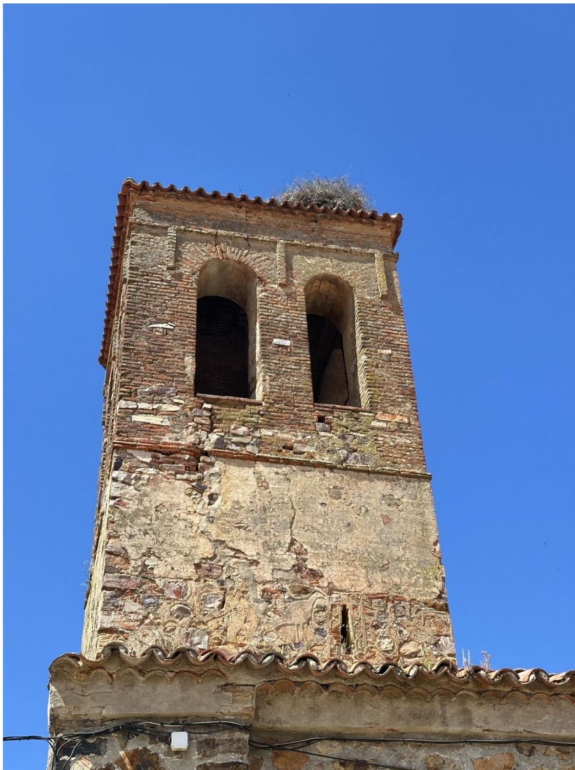
La torre constituye uno de los elementos singulares del edificio y muestra dos fases constructivas diferenciadas.