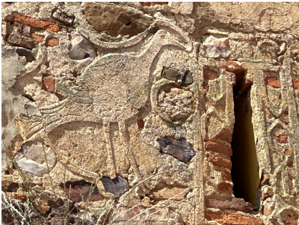
Detalle de una paloma esculpida en la fachada del templo.