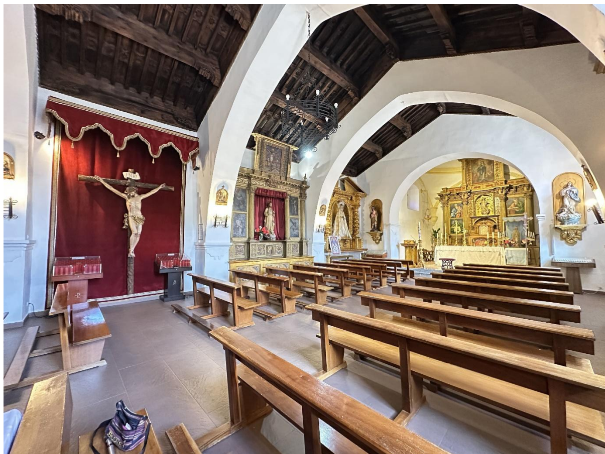
Vista del templo en la que se aprecia el techo de madera.