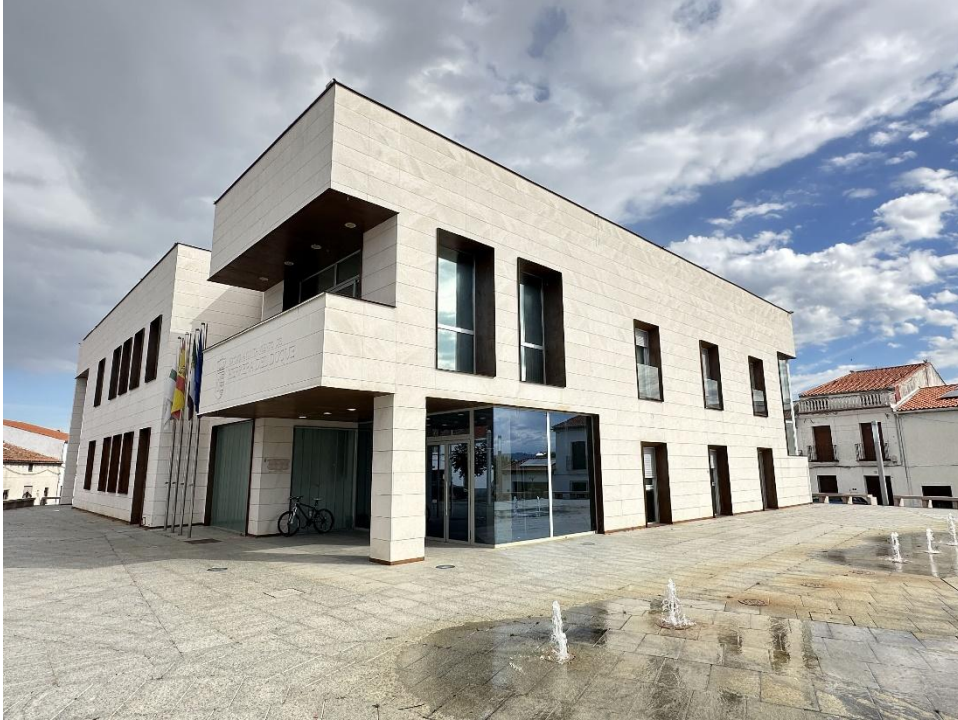
El ayuntamiento actual visto desde distintos ángulos.