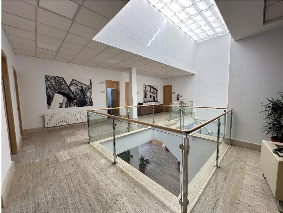
Interior de las instalaciones del ayuntamiento.