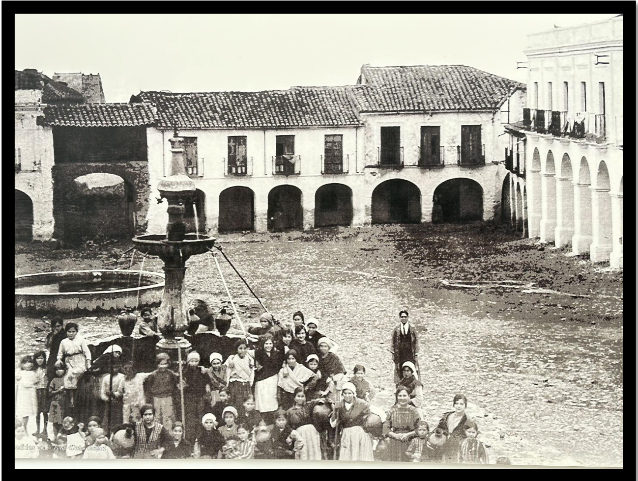
Vecinos en la plaza cuando el ayuntamiento tenía en este lugar su emplazamiento originario.