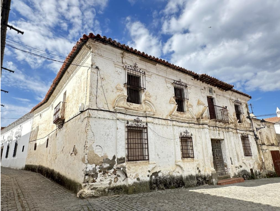
Vista de la Casa de los Chacones, en la calle San Juan de Herrera del Duque.