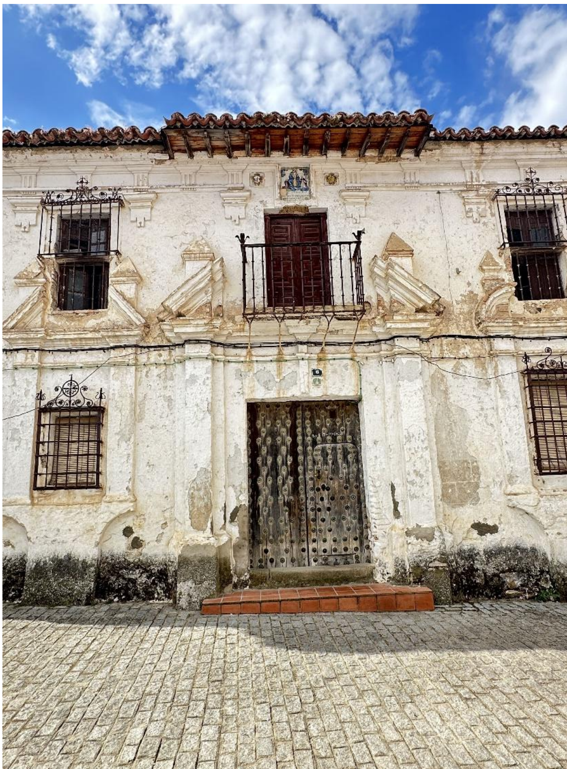
Detalle de la fachada, la puerta, el enrejado y la techumbre, que conservan su aspecto original.