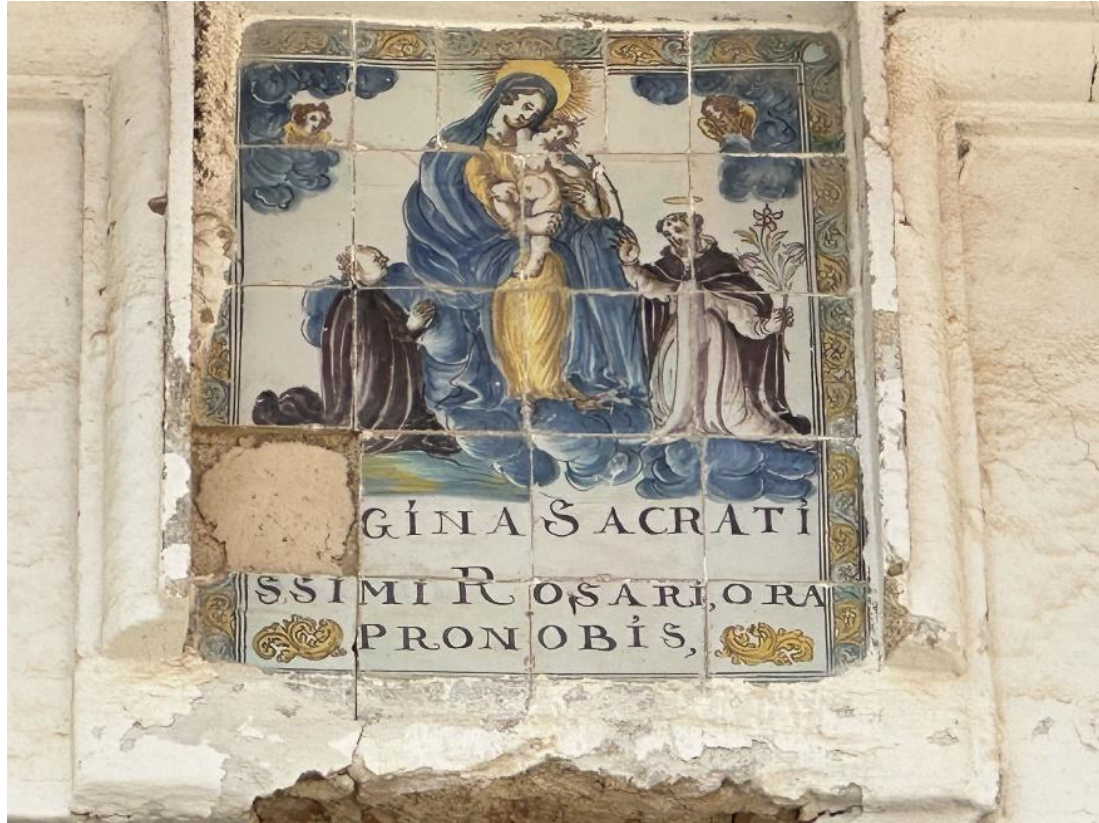
Composición de azulejos en la parte superior de la Casa de los Chacones.