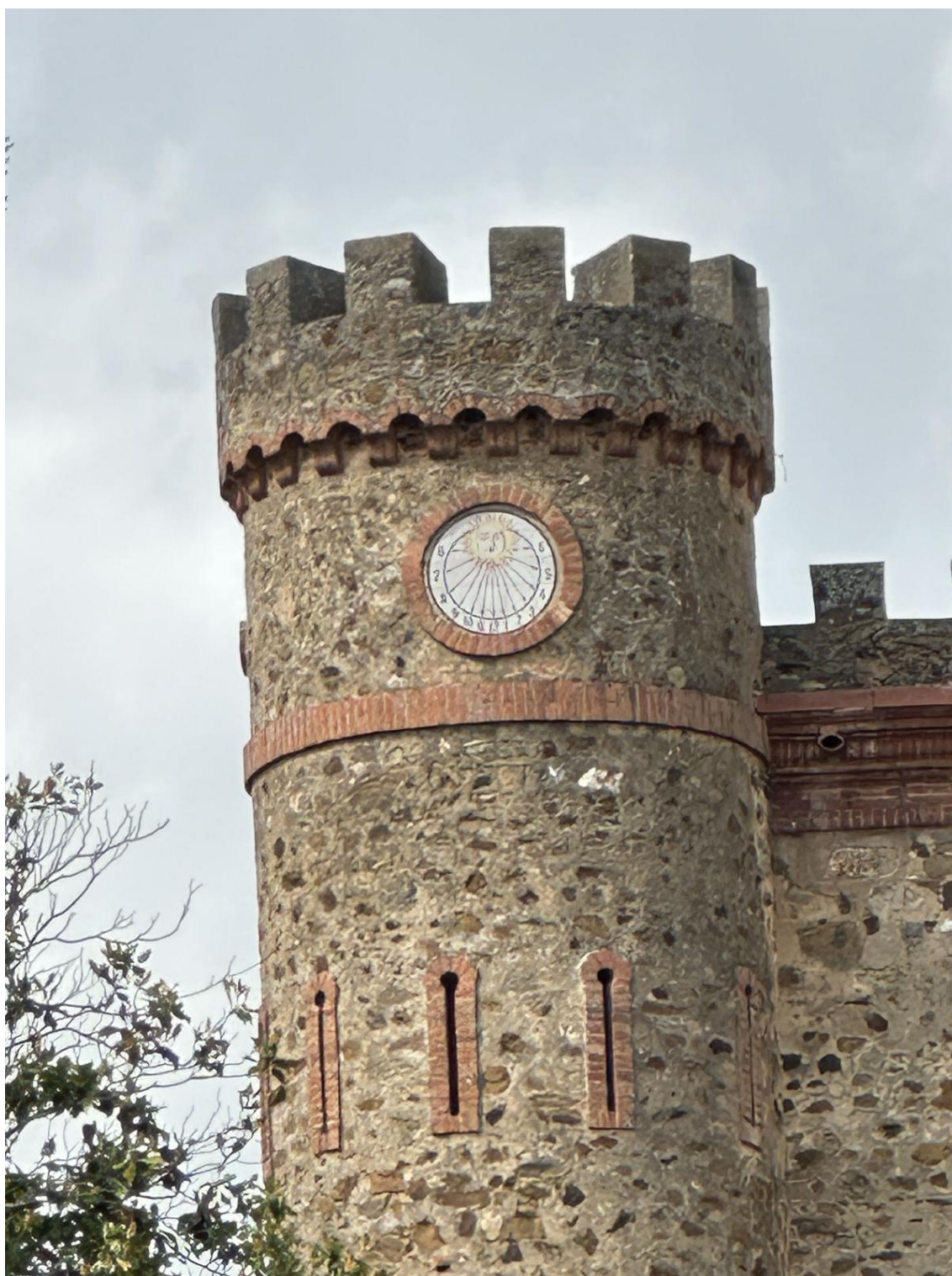
El conjunto presenta una potente estructura rectangular reforzada por elevadas torres circulares en las esquinas