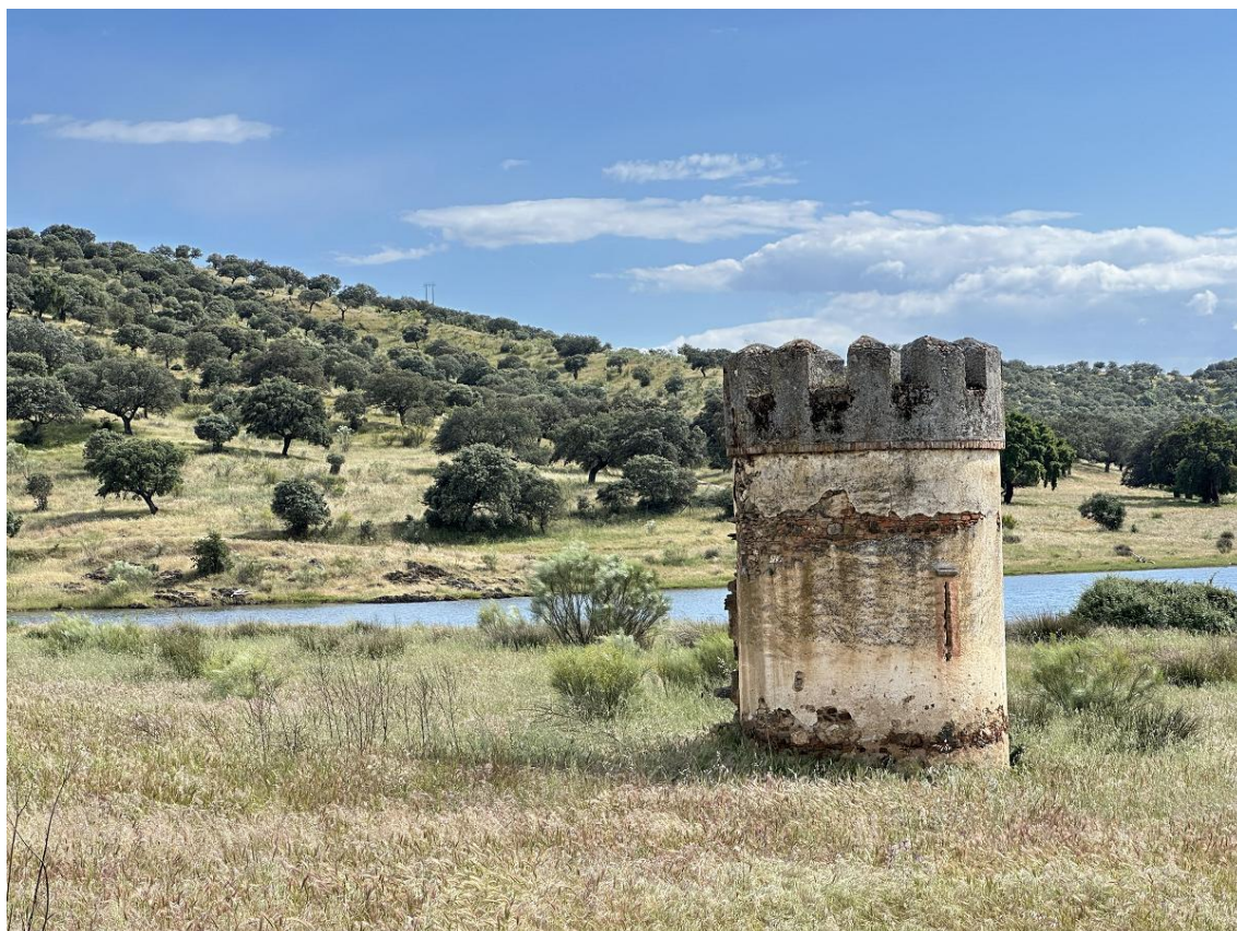
El palacio también fue campo de concentración.