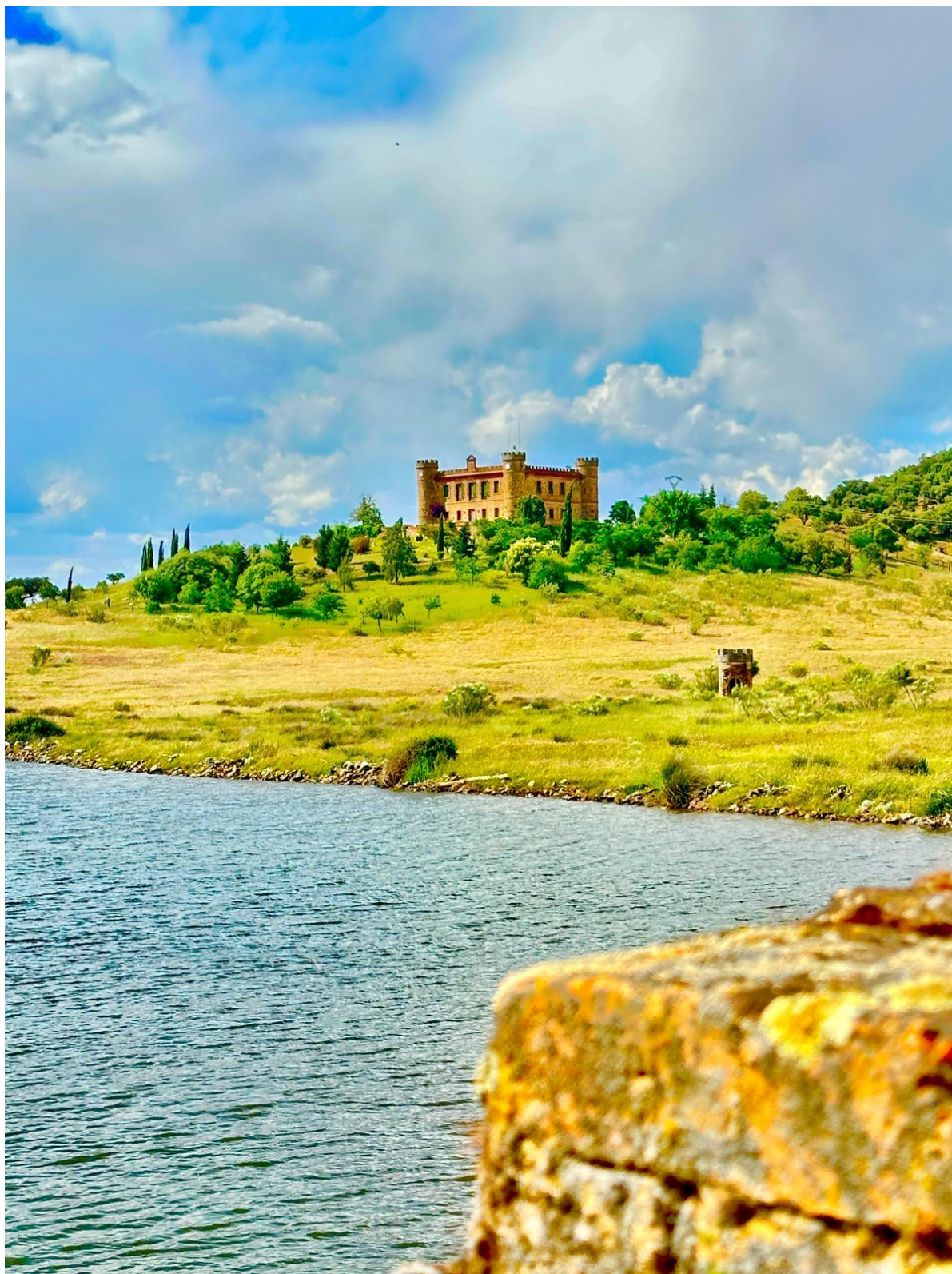
Vista del Palacio de Cijara desde el puente próximo que sirve de acceso.