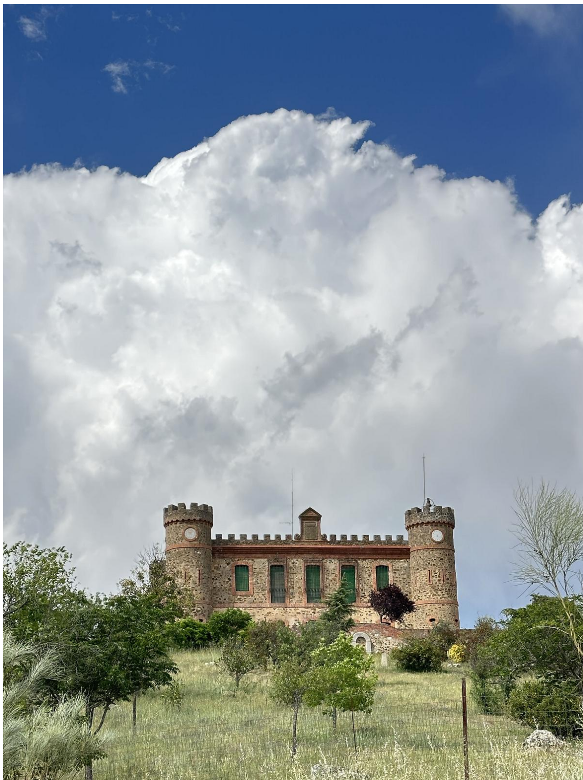
Conjunto de nubes sobre el Palacio de Cijara.