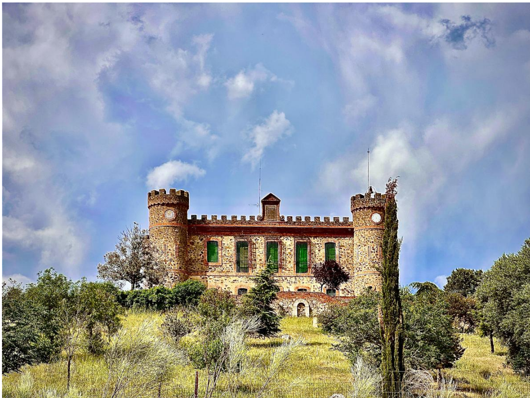
El Palacio de Cijara ha experimentado diversas transformaciones a lo largo del tiempo.