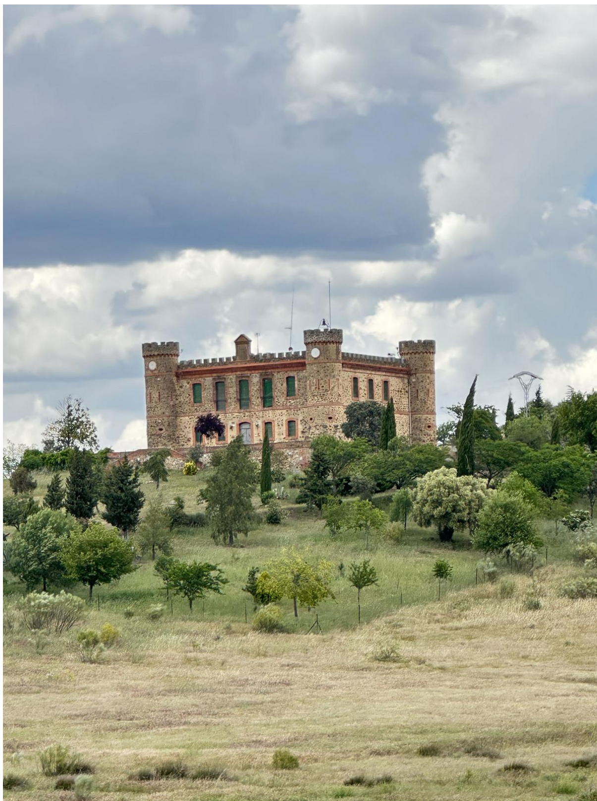
El palacio quiso recuperar simbólicamente la memoria de la casa señorial de La Golosilla, según algunos estudiosos.