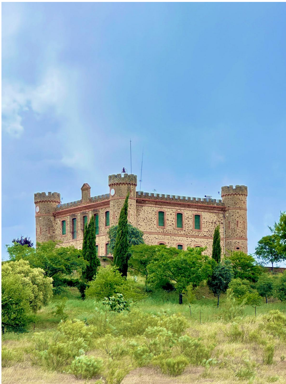
Varios elementos del recinto original han desaparecido o han sufrido modificaciones, pero el edificio continúa conservando gran parte de su valor paisajístico, arquitectónico e histórico.