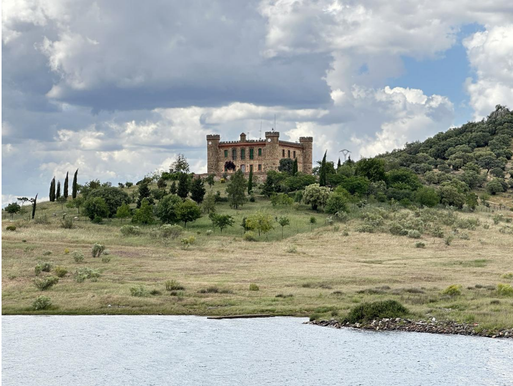
El palacio se integra en un paisaje de extraordinario valor ambiental.