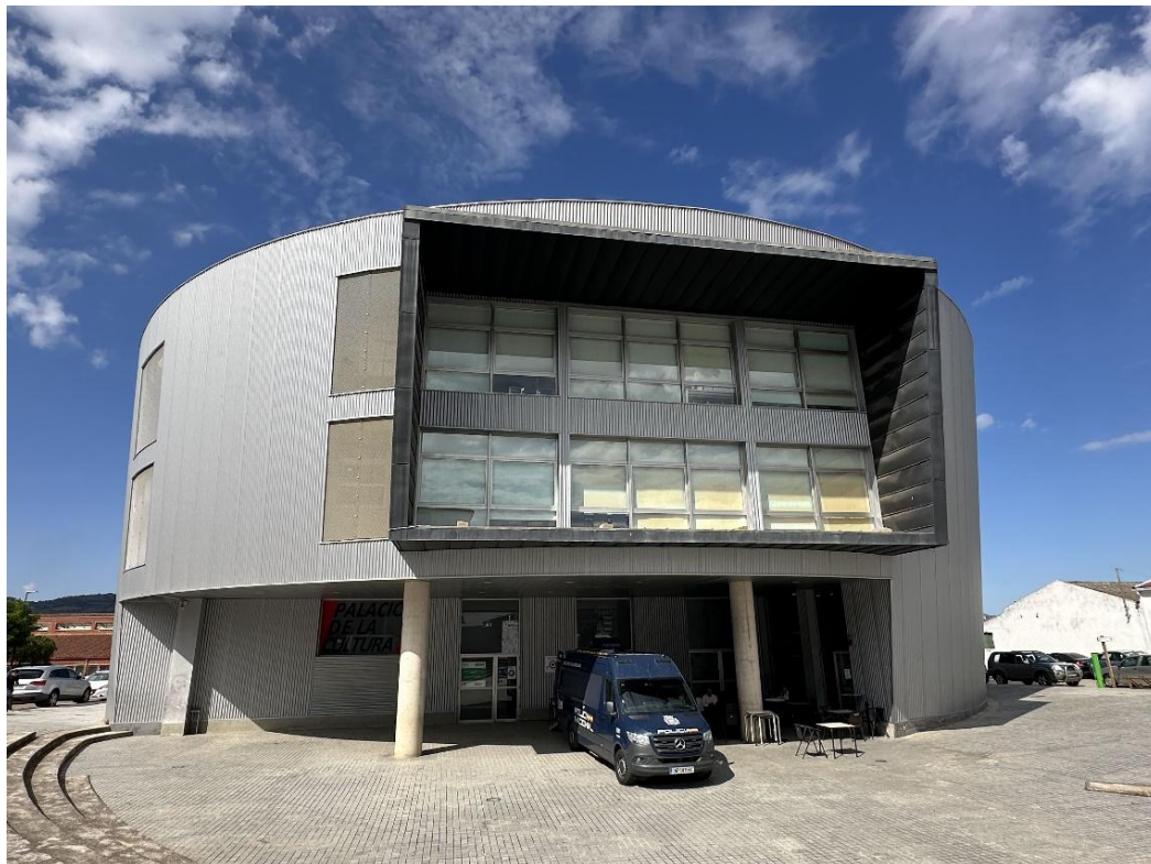
Vista frontal del Palacio de Cultura.