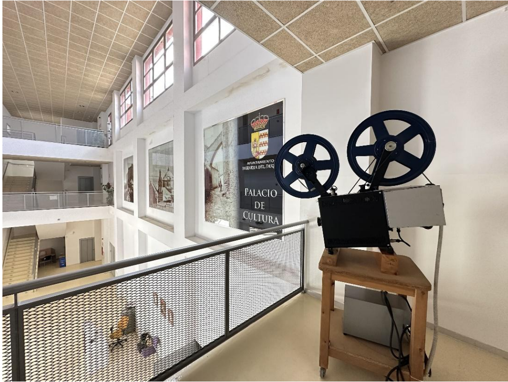
Segunda planta del Palacio de la Cultura de Herrera del Duque.