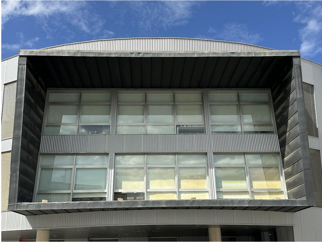
Detalle de la parte superior del edificio. Abajo, auditorio.