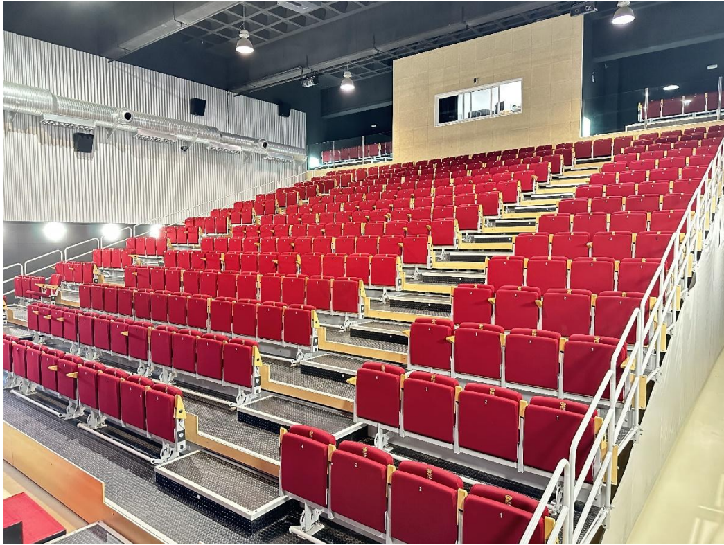
Vista del auditorio desde otra perspectiva y pasillo interior de las instalaciones.