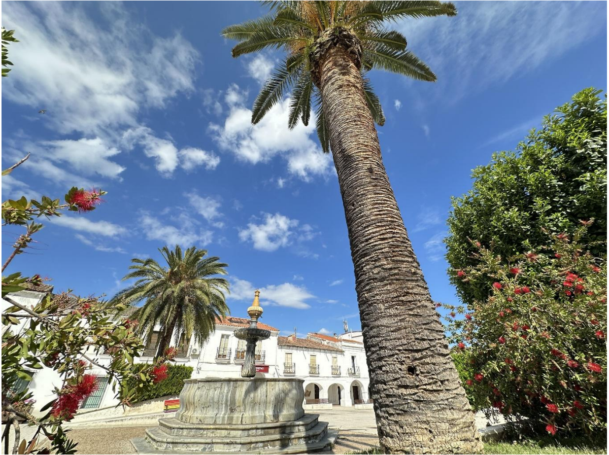
Imagen de la fuente y la plaza.