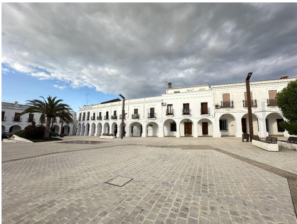
Arriba, imagen de la Plaza de España. Abajo, la fuente ochavada.