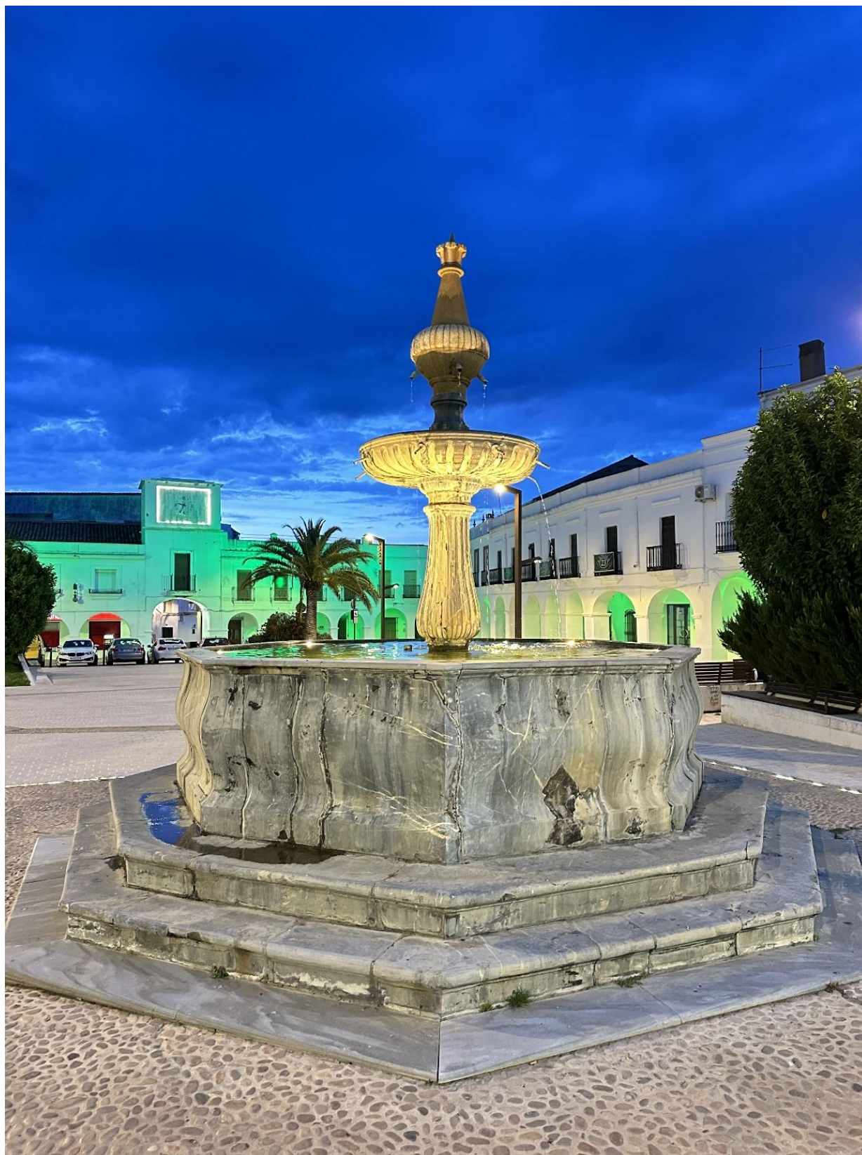
Imagen nocturna de la fuente ochavada con la plaza iluminada.