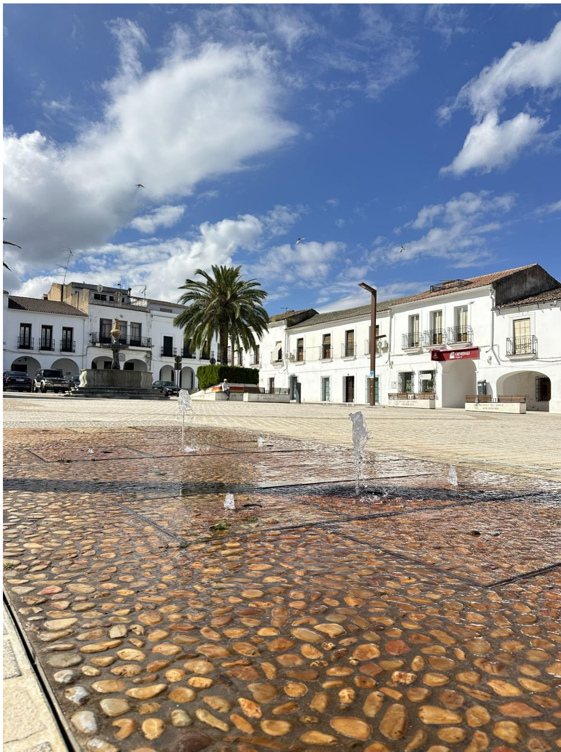
Chorros de agua en la parte inferior de la plaza.