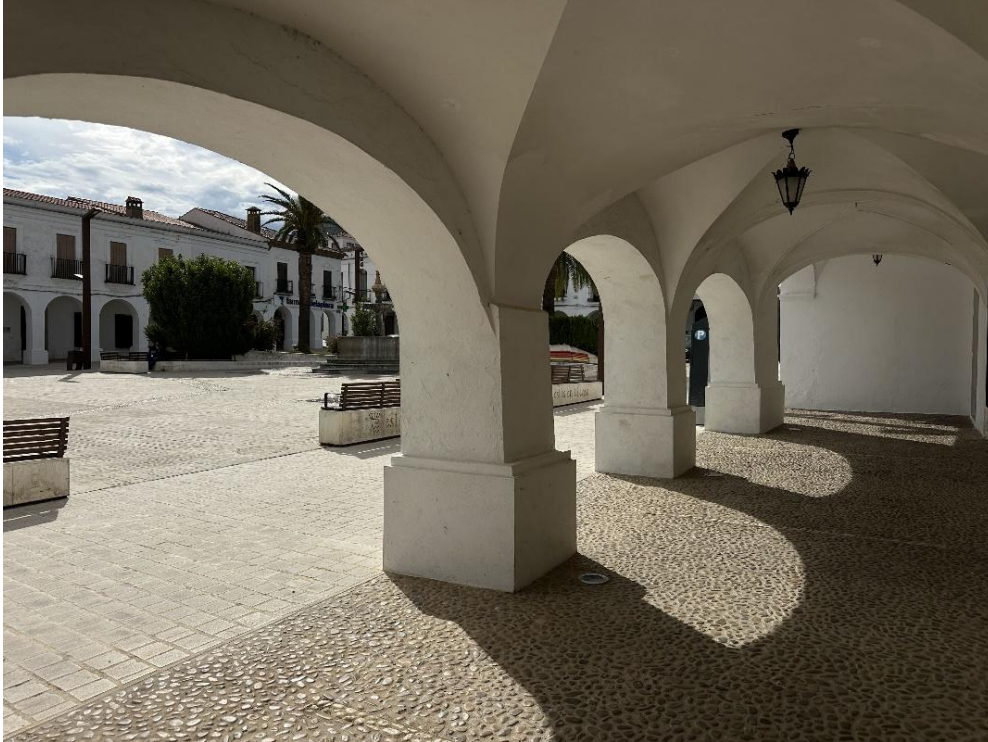
Arcos en la plaza porticada de Herrera del Duque.