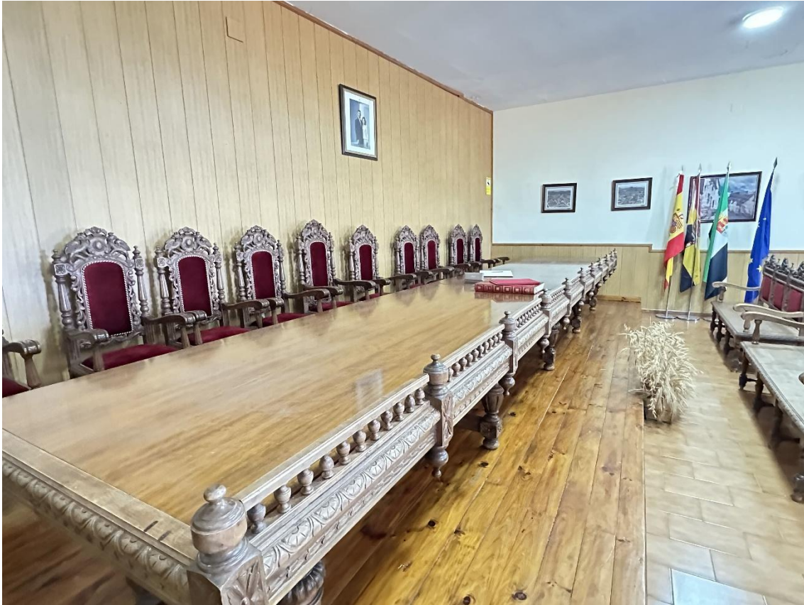
Arriba, mesa y butacas del salón de plenos. Abajo, escudos heráldicos de Zúñiga y Sotomayor en la fachada.