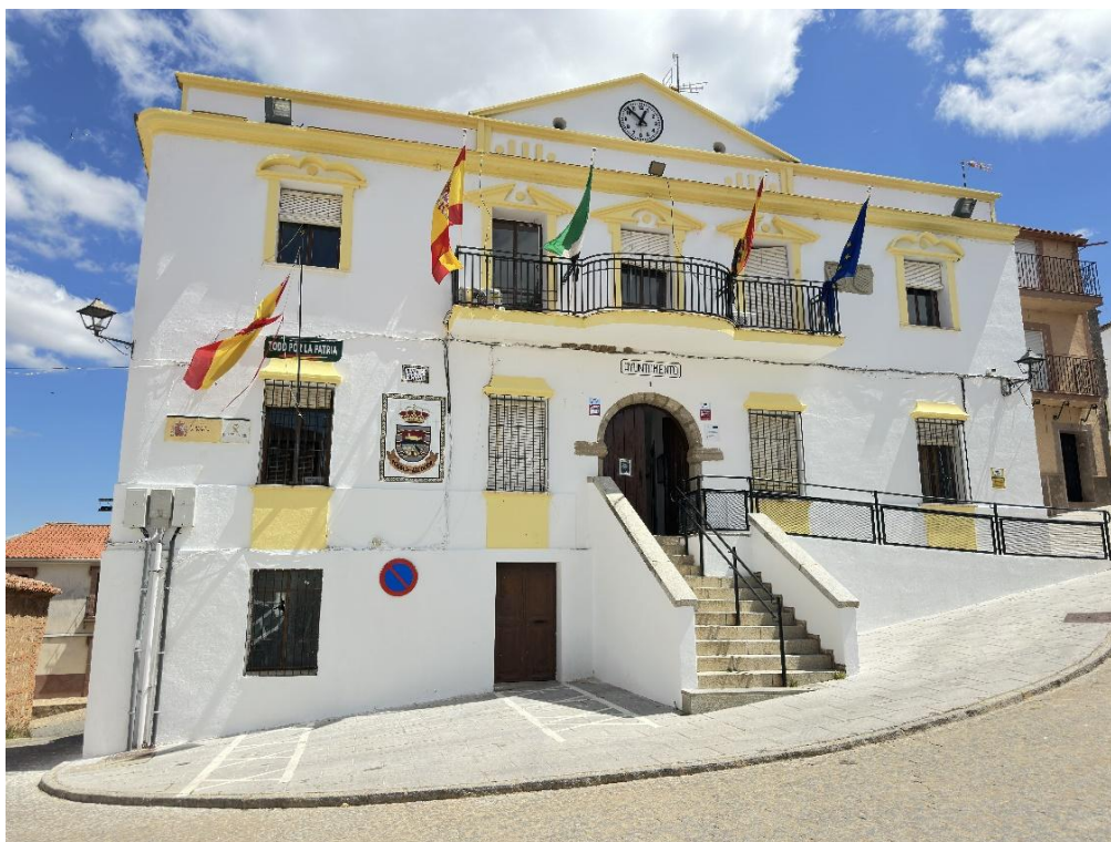
Edificio del ayuntamiento desde distintas perspectivas.