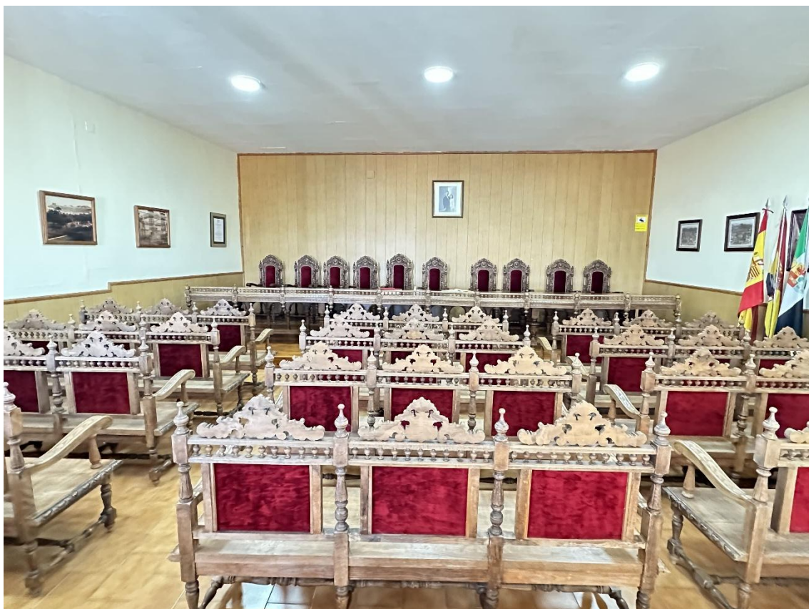
Imagen de las butacas de madera que aún se conservan en el salón de plenos del ayuntamiento.