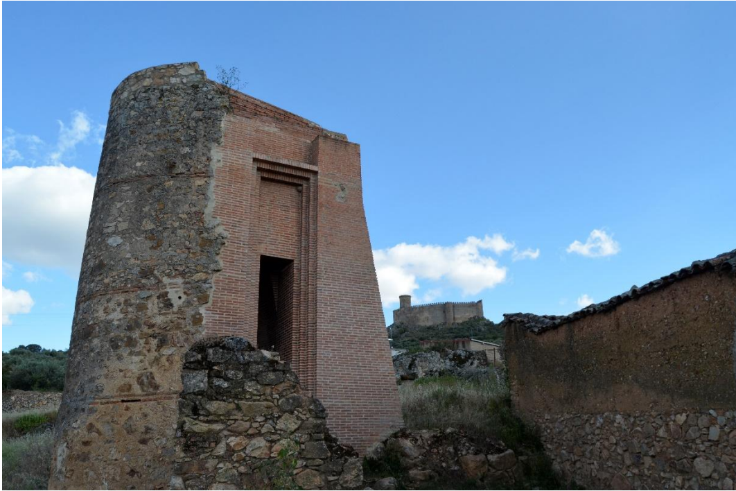
Estructura defensiva del castillo viejo. Al fondo, el Castillo de los Sotomayor.