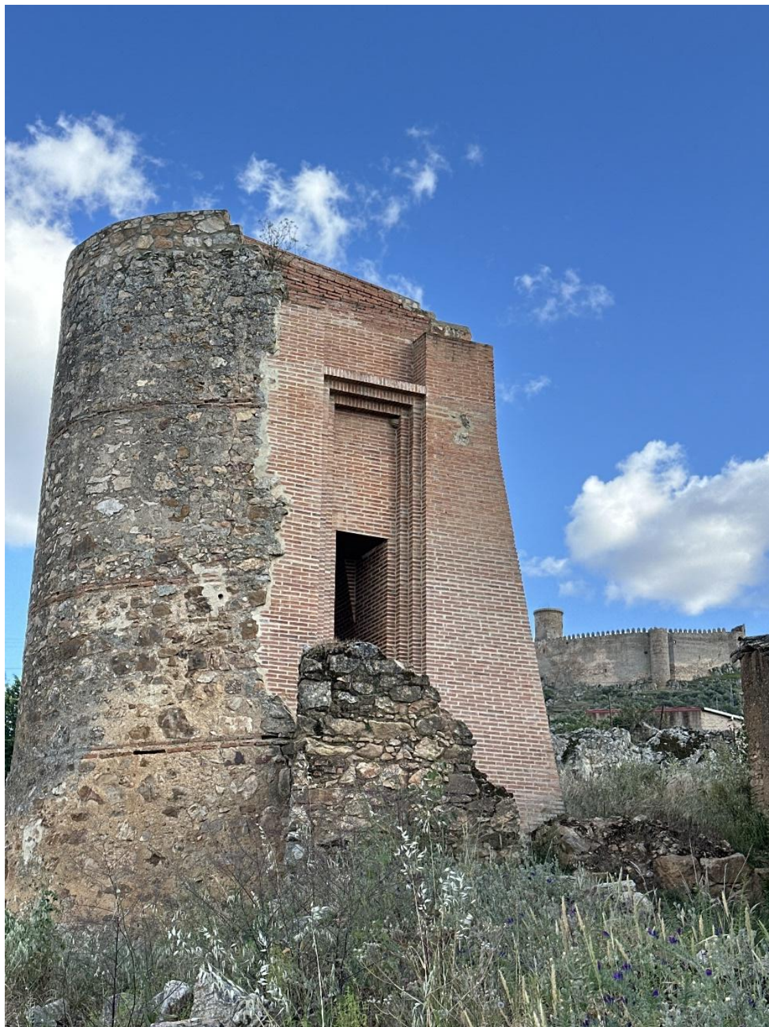
Imagen en la que se aprecia la restauración realizada por Santiago Esteban Hernán Martín.