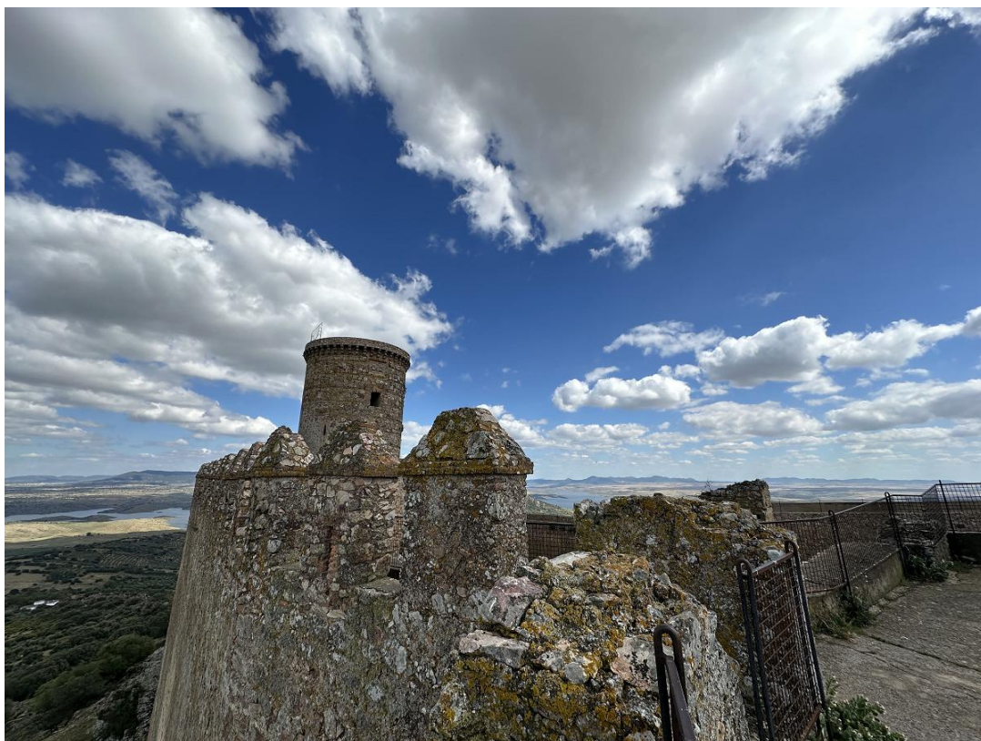
El castillo presenta una planta irregular, claramente adaptada a la topografía del terreno.