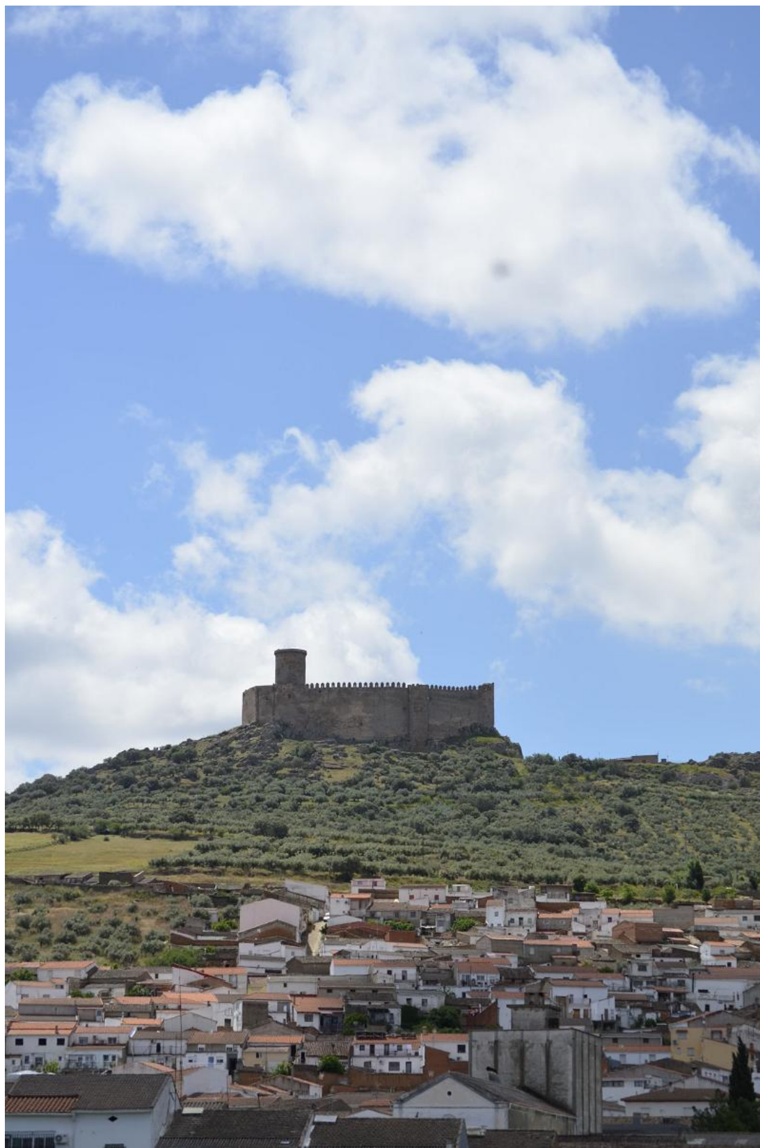
Imagen del castillo visto desde Puebla de Alcocer.