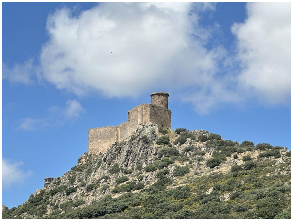
Imagen del castillo desde abajo (foto superior) y desde dentro (foto inferior).