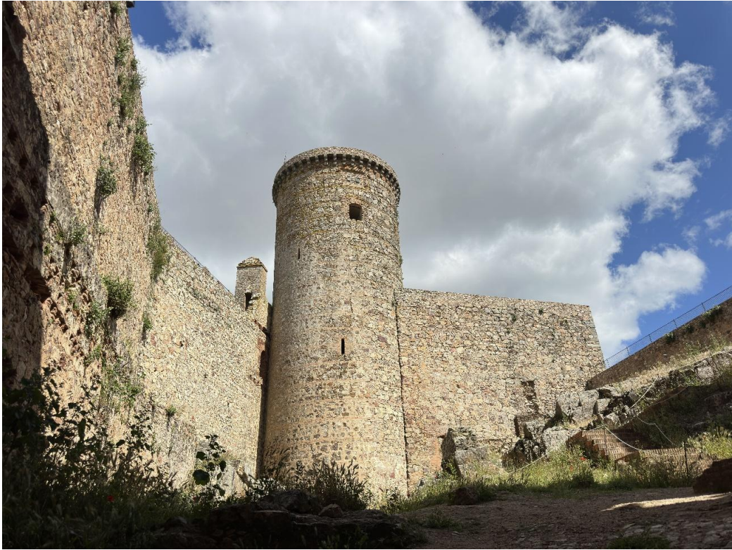
Acceso principal protegido por lienzos de muralla más elevados y por una torre cilíndrica adosada.