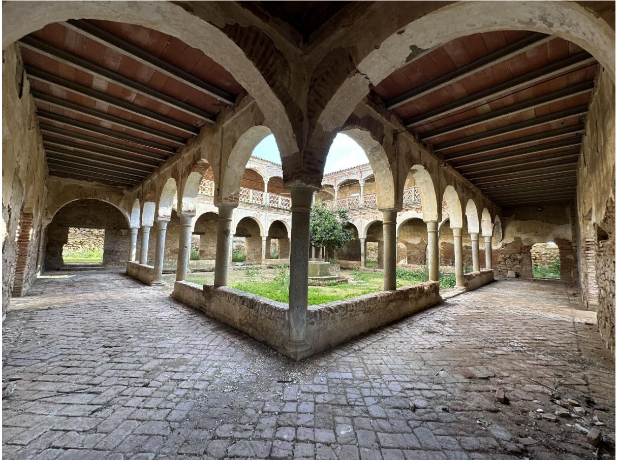
Claustro del Convento de La Visitación.