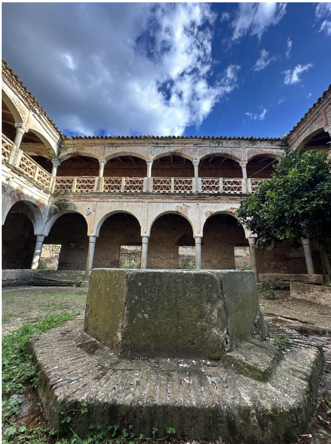
Pozo que se encuentra en el patio del claustro.