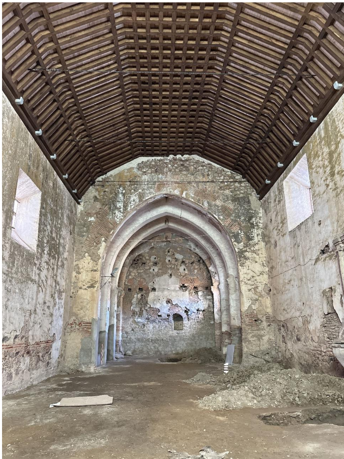
Iglesia conventual, en la que se aprecia el techo de madera.