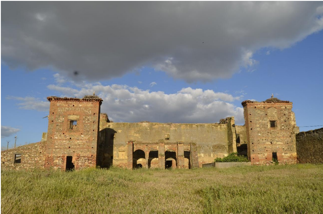
Vista exterior del convento desde uno de sus laterales.