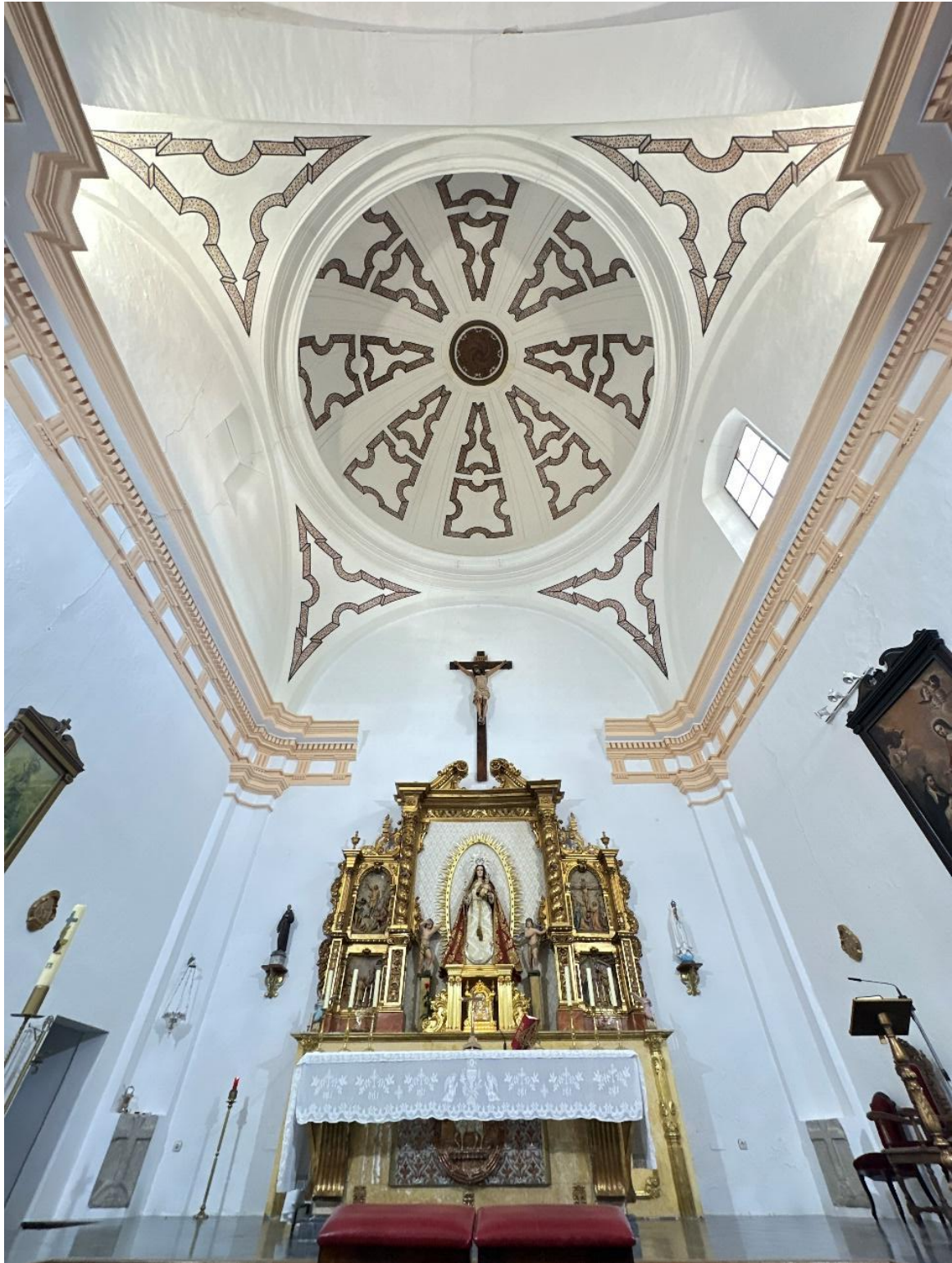
Presbiterio y cúpula del convento.