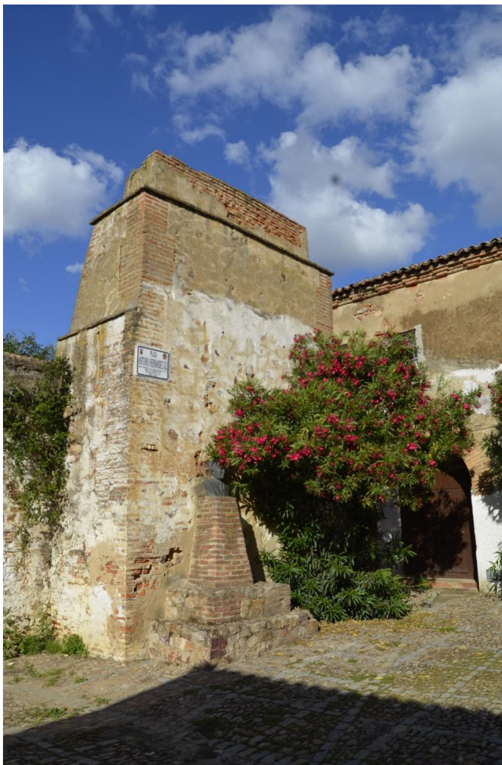
Zona exterior de lo que hoy es el albergue juvenil.