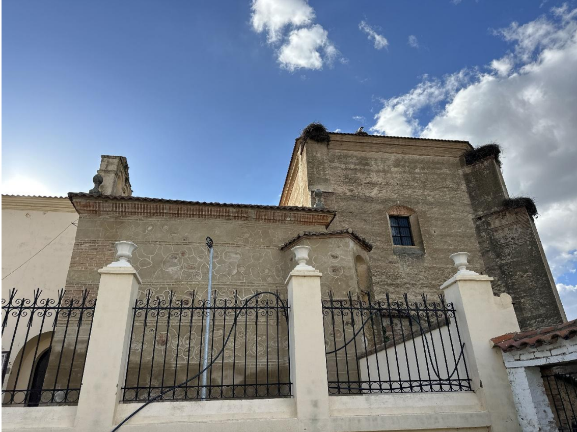
Vista exterior del convento.