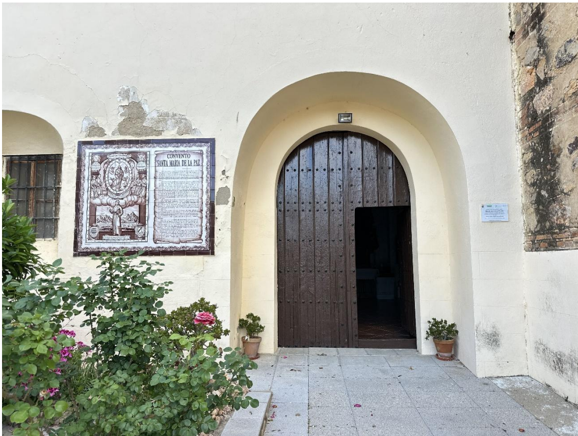
Zona de acceso al convento.