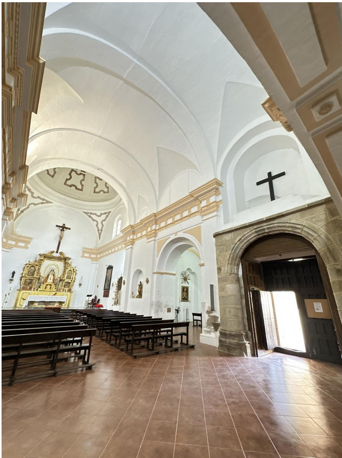
Interior del convento de San Francisco.