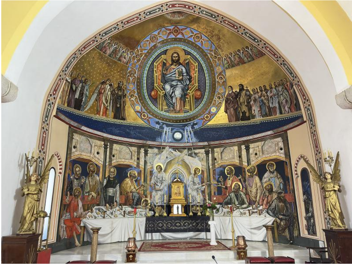
Frescos neorrománicos del pintor ruso, afincado en España, Boris Lugovsky.