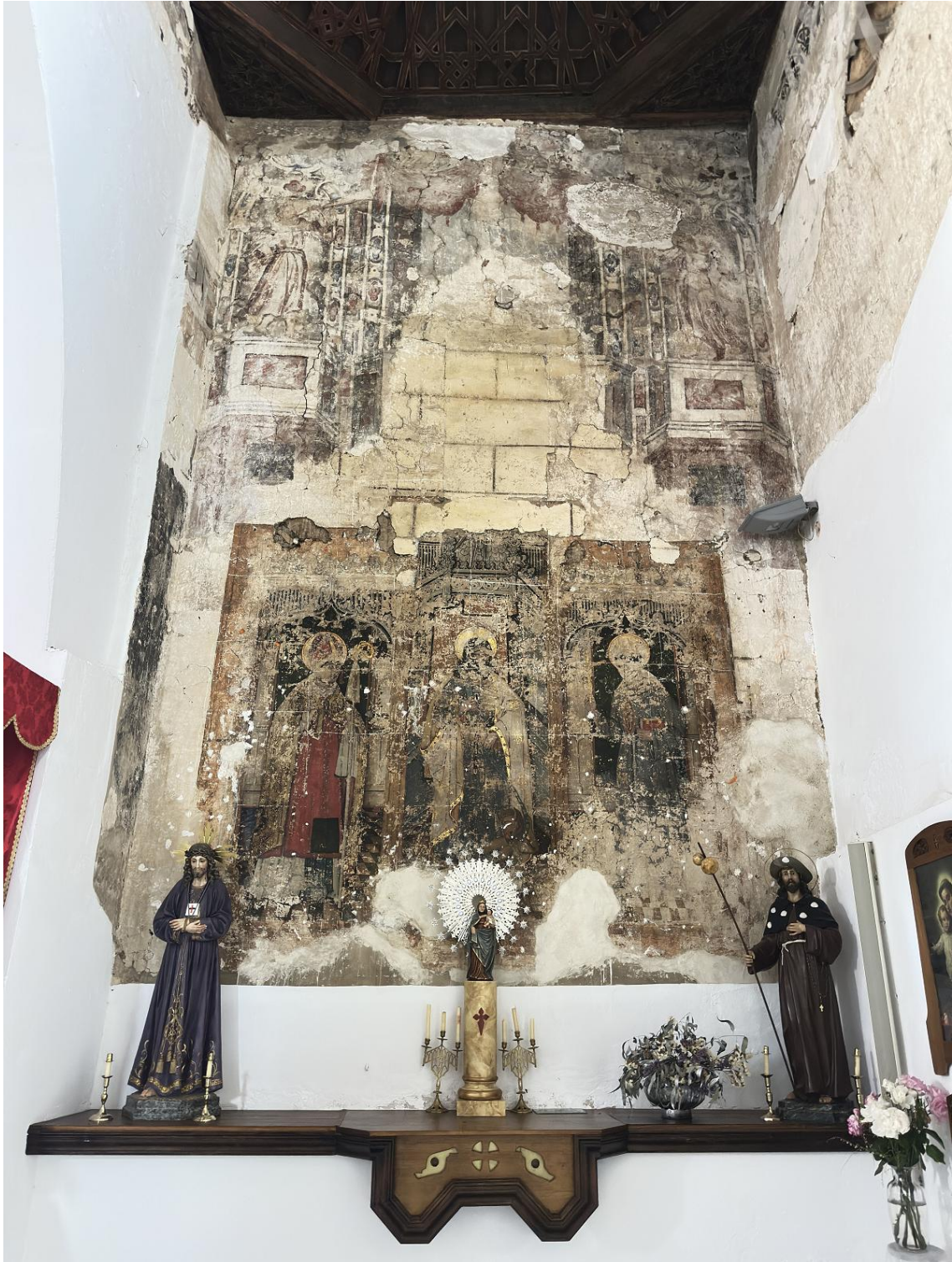
Detalle de pinturas en una de las zonas de la iglesia.