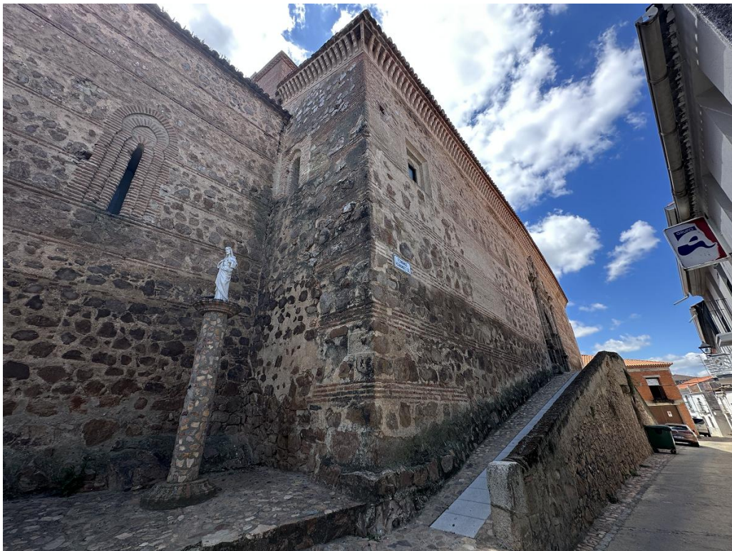
Fachada principal de la iglesia, a la que se accede a través de una rampa.