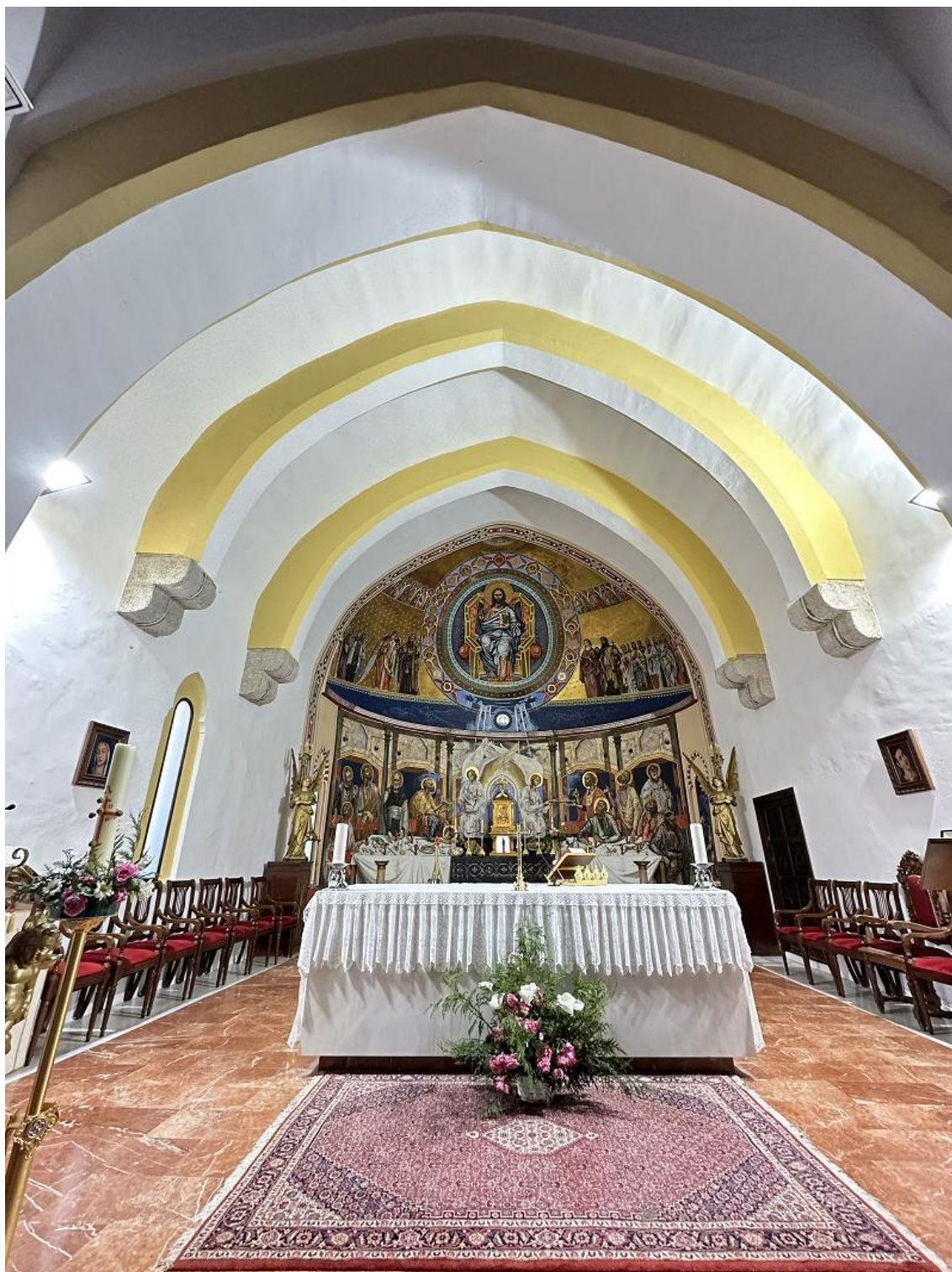
Las armaduras de madera que cubren las naves son espléndidos ejemplares de la carpintería mudéjar.