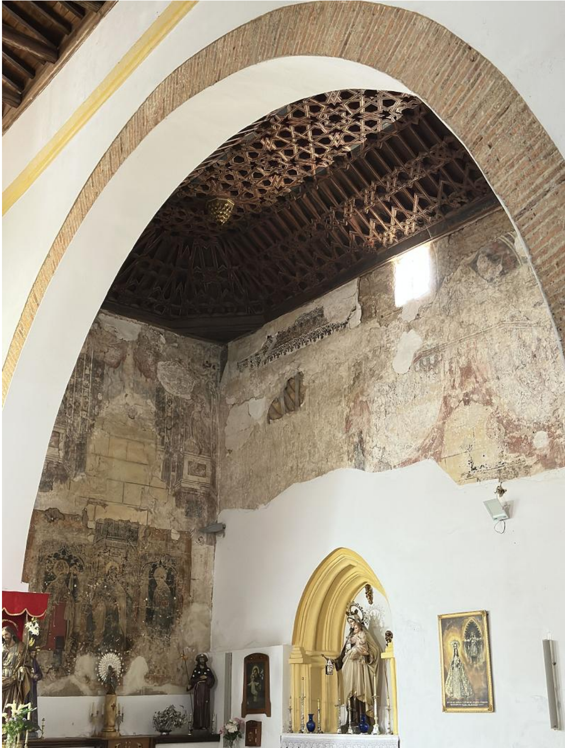
En esta Iglesia estuvo enterrado Pedro I de Castilla, el Cruel, muerto en 1369 en los Campos de Montiel.