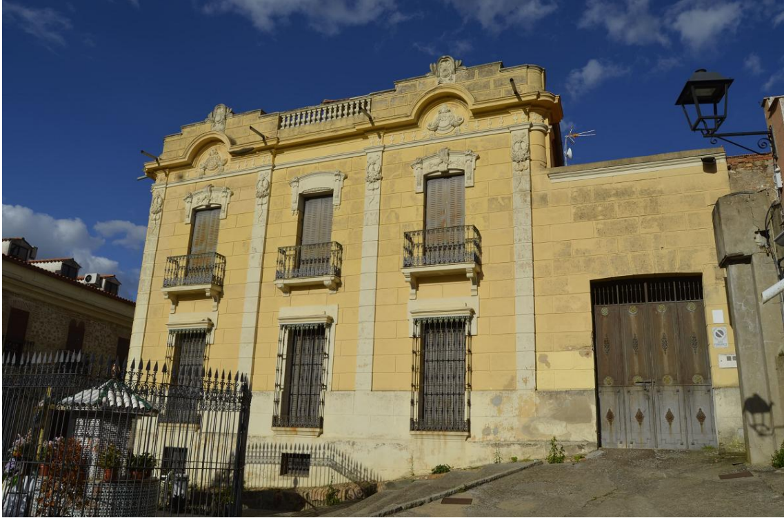
Imagen de un lateral del inmueble y del balcón de la fachada principal.