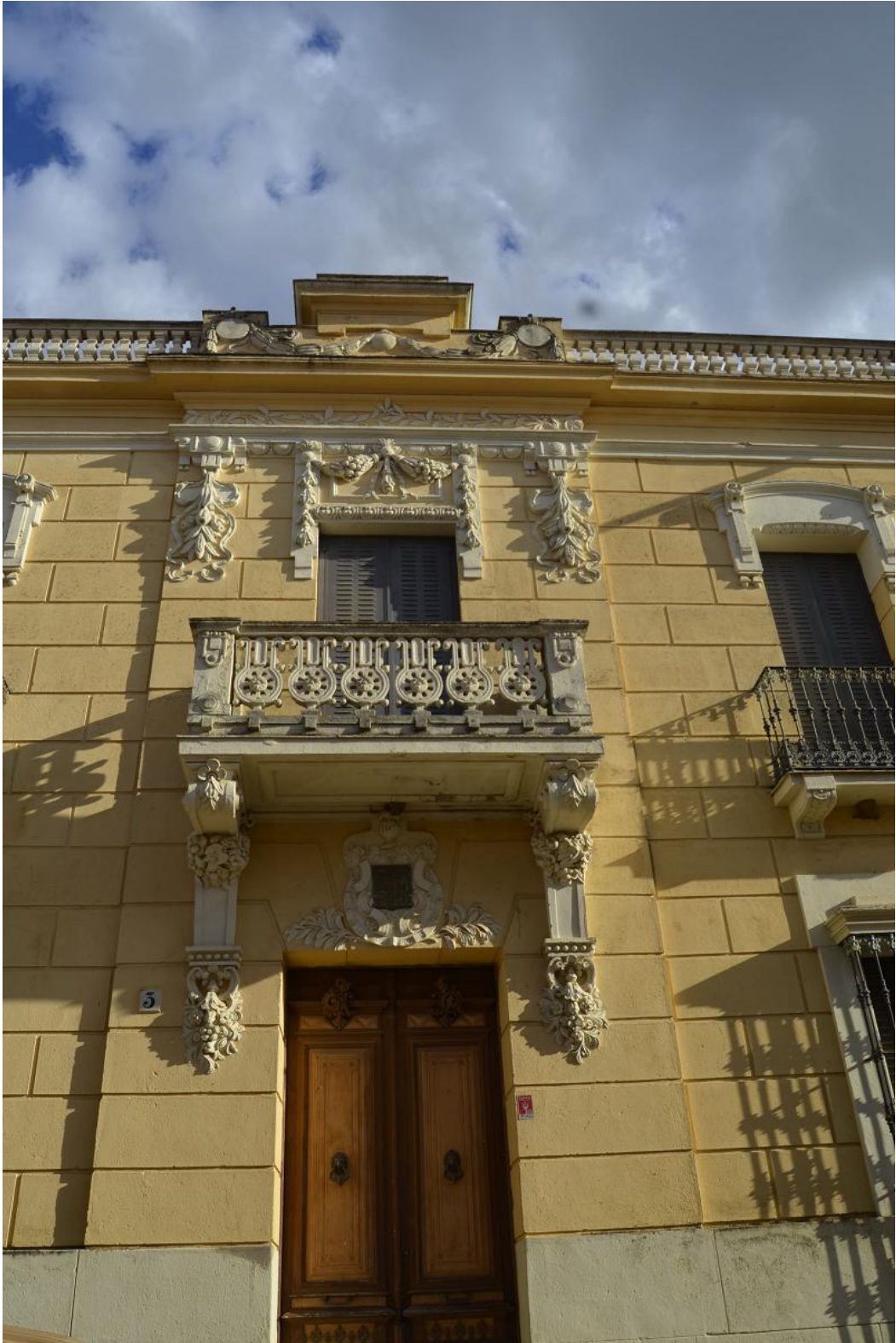
Imagen de la fachada con relieves y otros elementos decorativos.