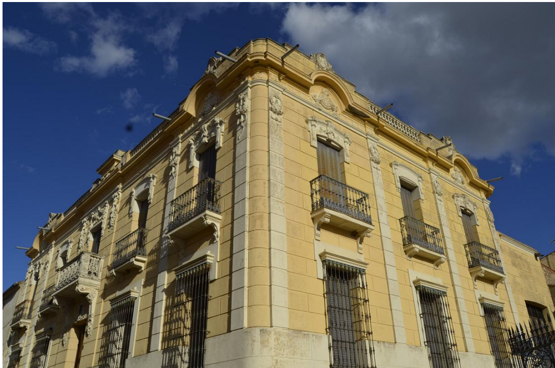
Casa de los Arévalo vista desde la calle San Francisco.