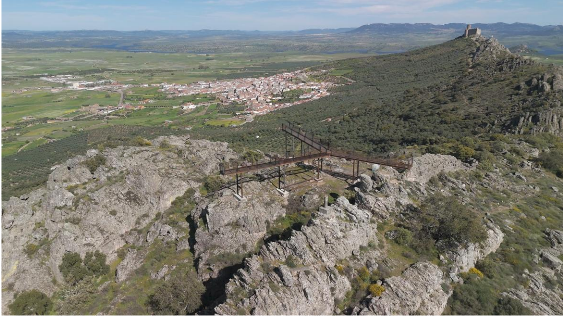
Arriba, el mirador y el castillo de Puebla de Alcocer a la derecha. Abajo, detalle de la estructura.