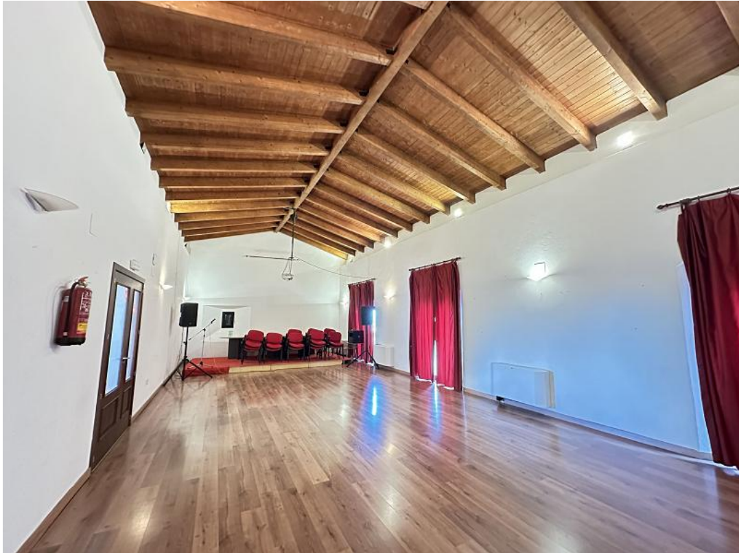
Dependencias rehabilitadas del palacio.