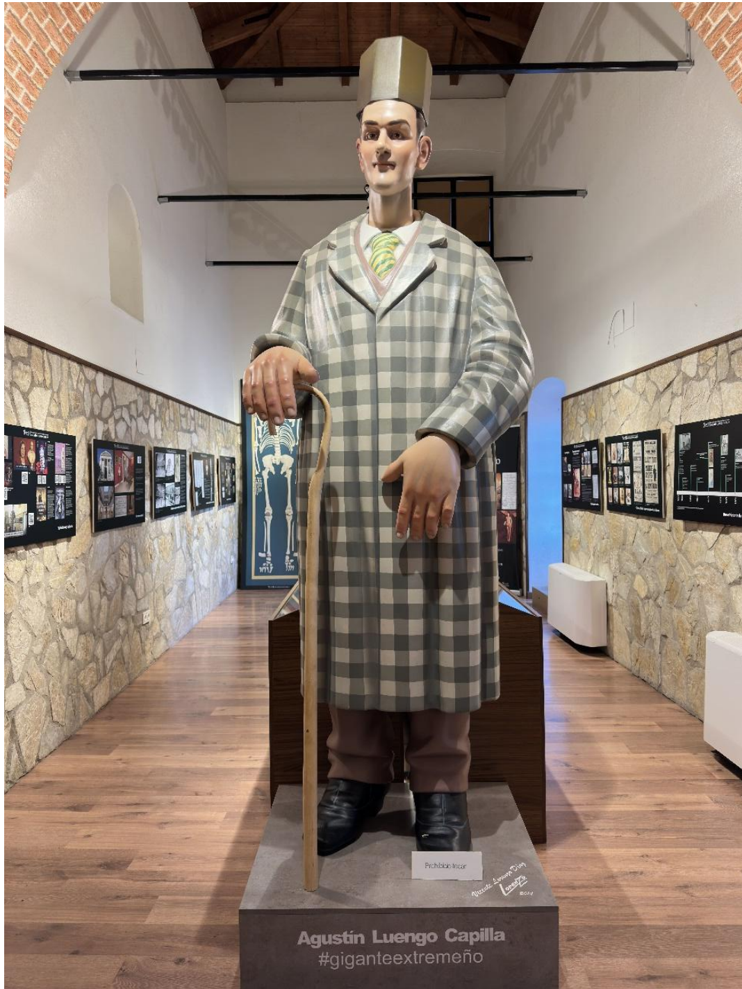
Reproducción a escala de la figura de Agustín Luengo Capilla.