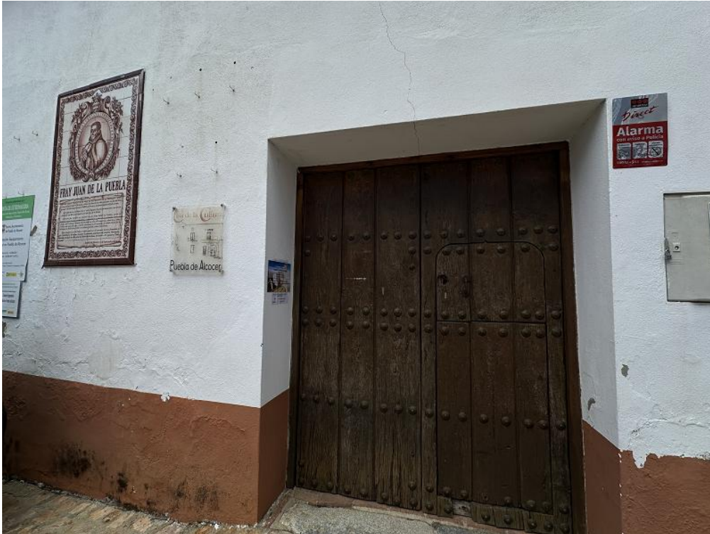
Acceso al Palacio del Vizcondado (arriba) y patio de la residencia (abajo).