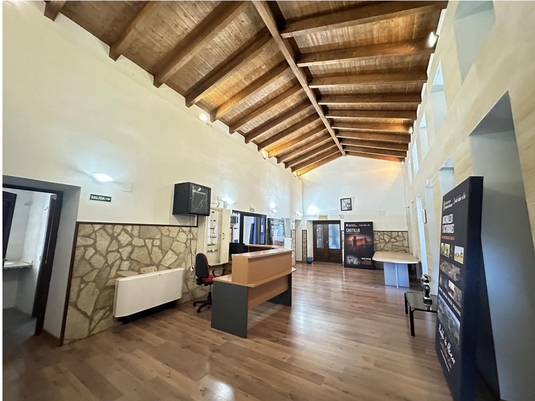
El palacio alberga diversos espacios de uso público (arriba). Sala del Museo del Gigante (abajo).