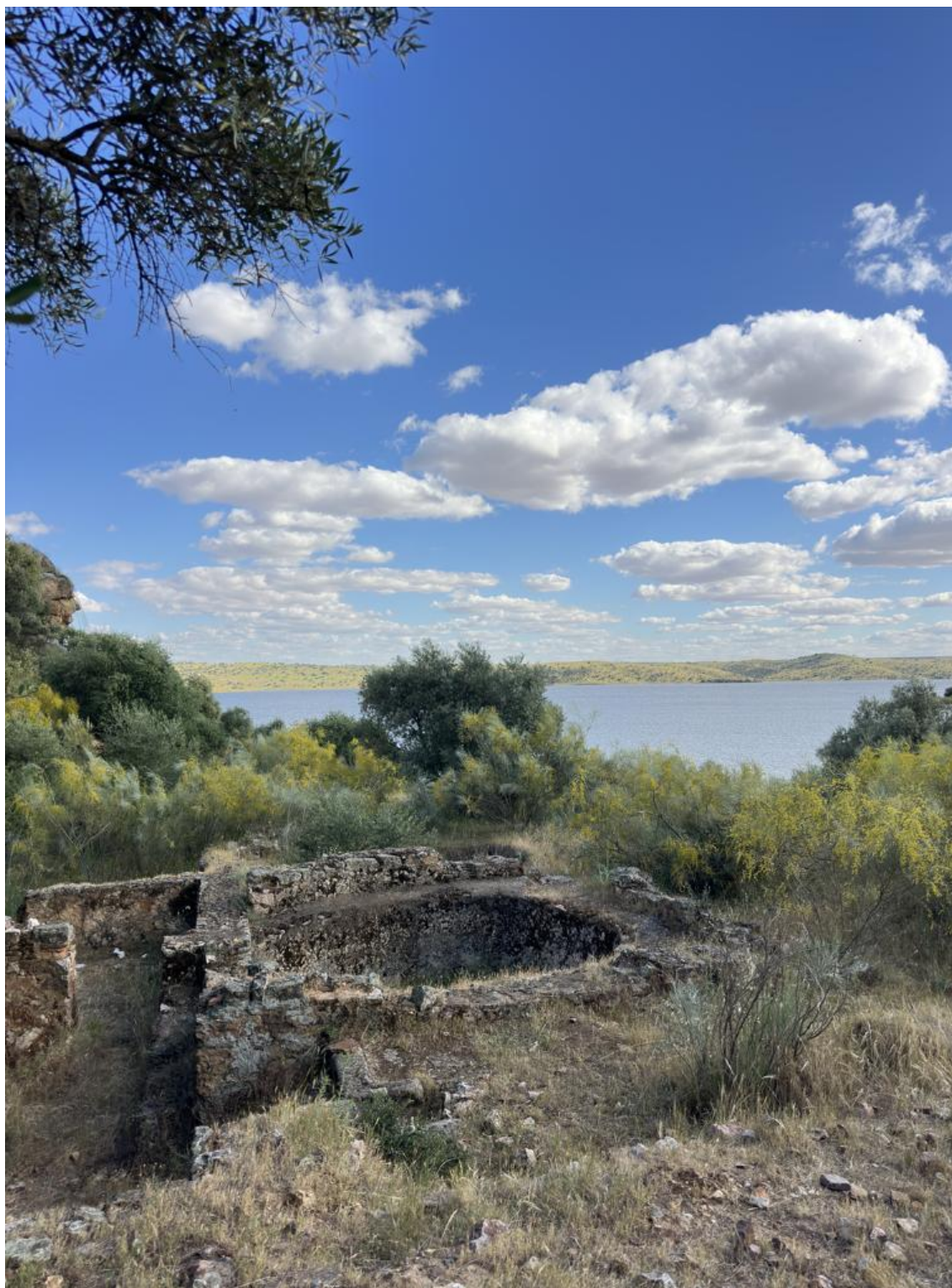
Enclave romano de Lacimurga, de los más relevantes de la comarca de La Siberia extremeña.