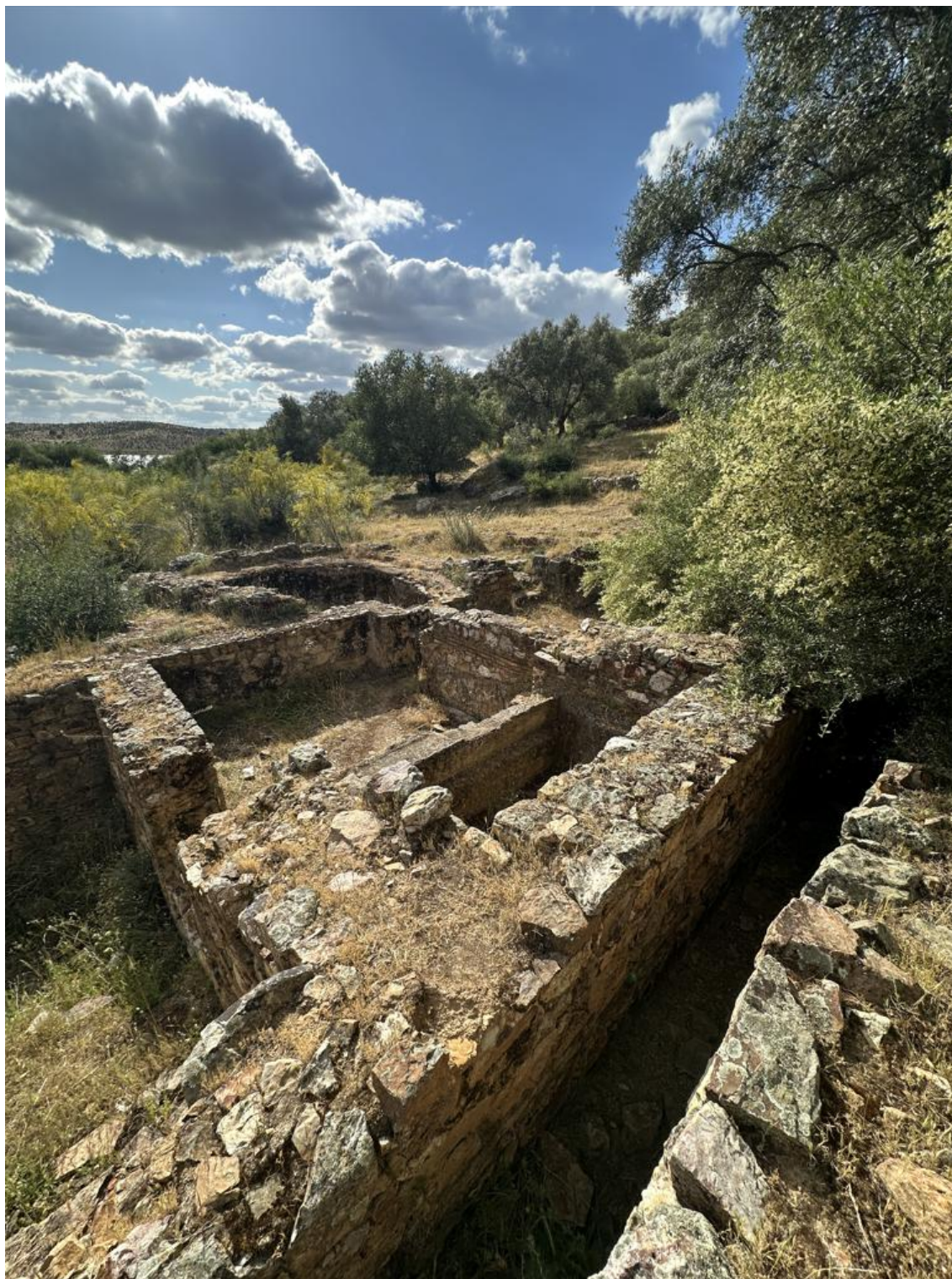
Restos de edificaciones hallados en Lacimurga.