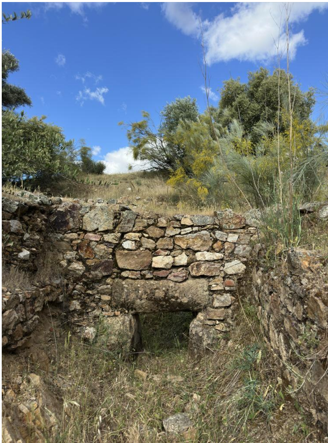
Parte de la edificación romana.