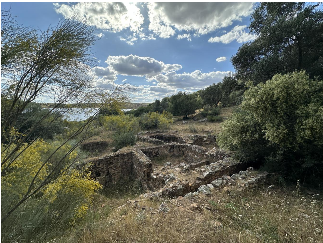
La posición dominante del cerro favoreció su utilización como fortificación defensiva.