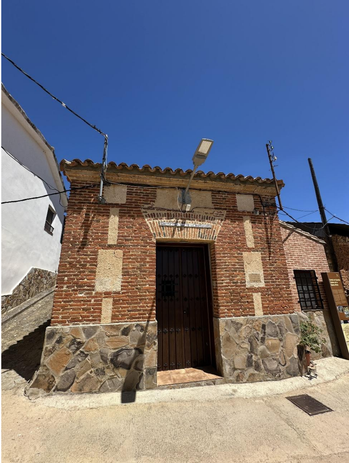
La ermita está estrechamente ligada a las celebraciones religiosas de Risco.