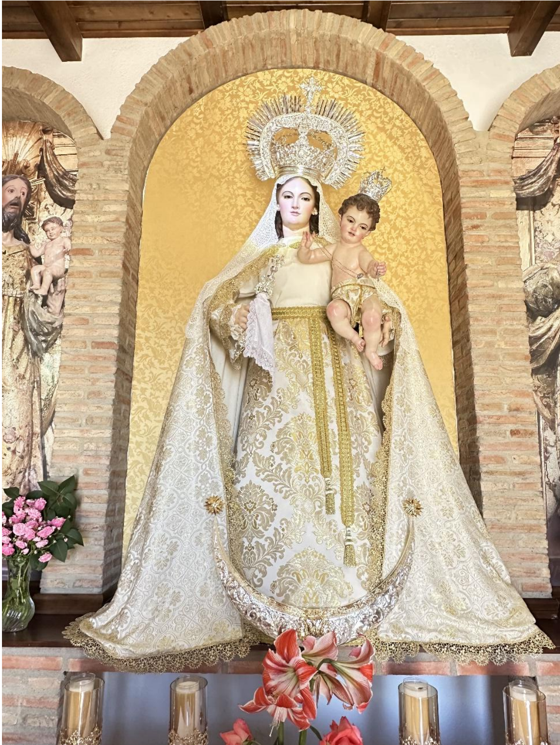
La ermita alberga la imagen de Nuestra Señora de la Buenadicha.