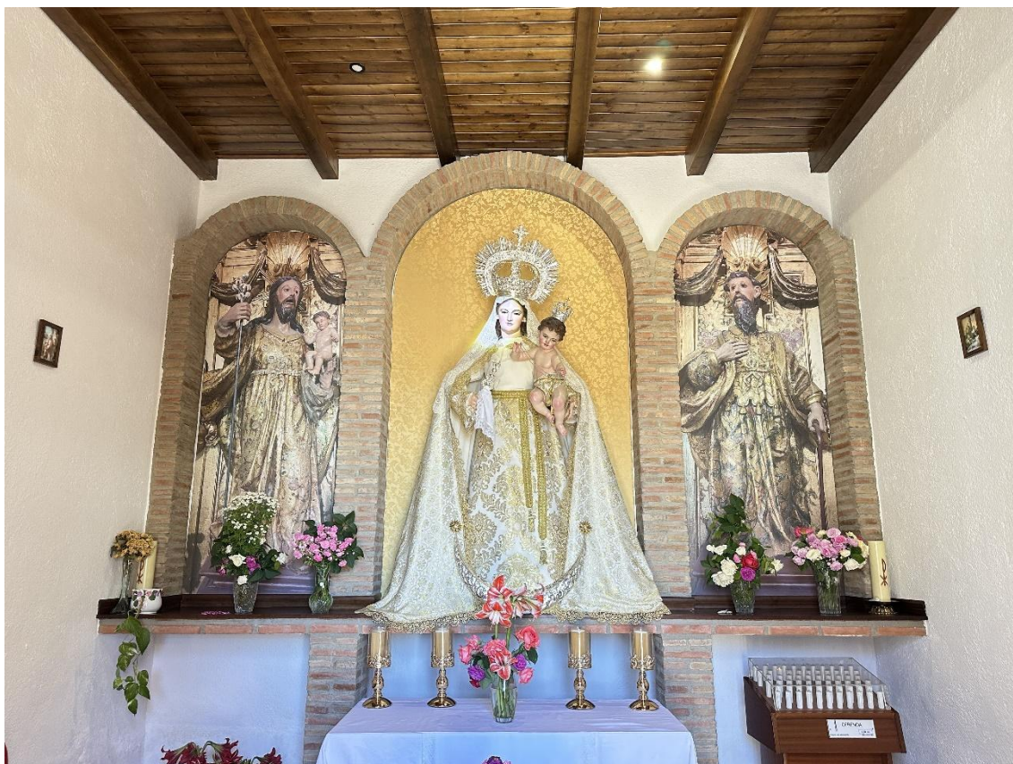
Interior de la ermita.