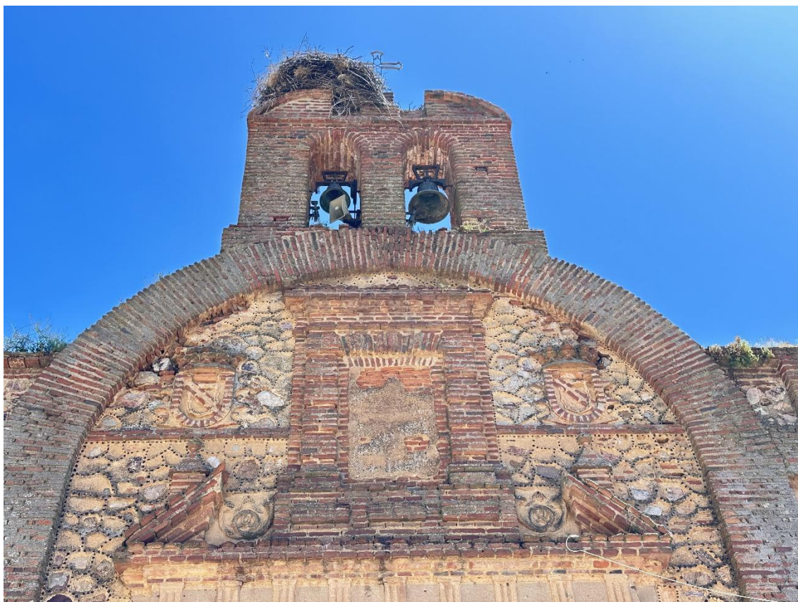
En la fachada destacan los escudos de los Zúñiga y los relieves de las serpientes enfrentadas.