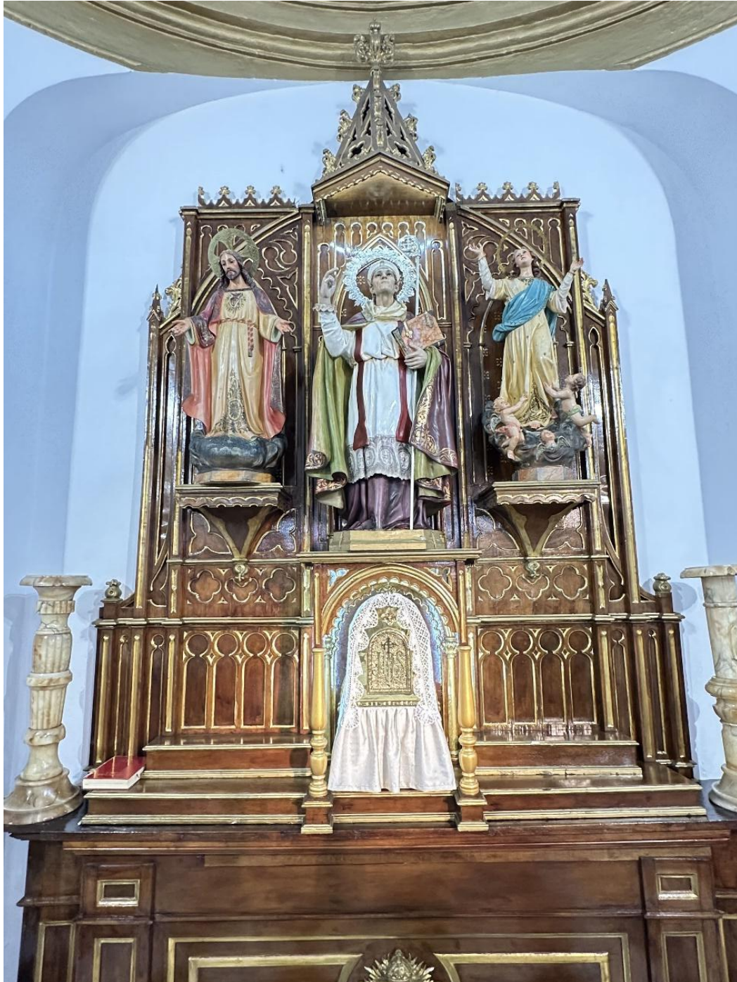
Retablo de la Iglesia con la imagen de San Blas.