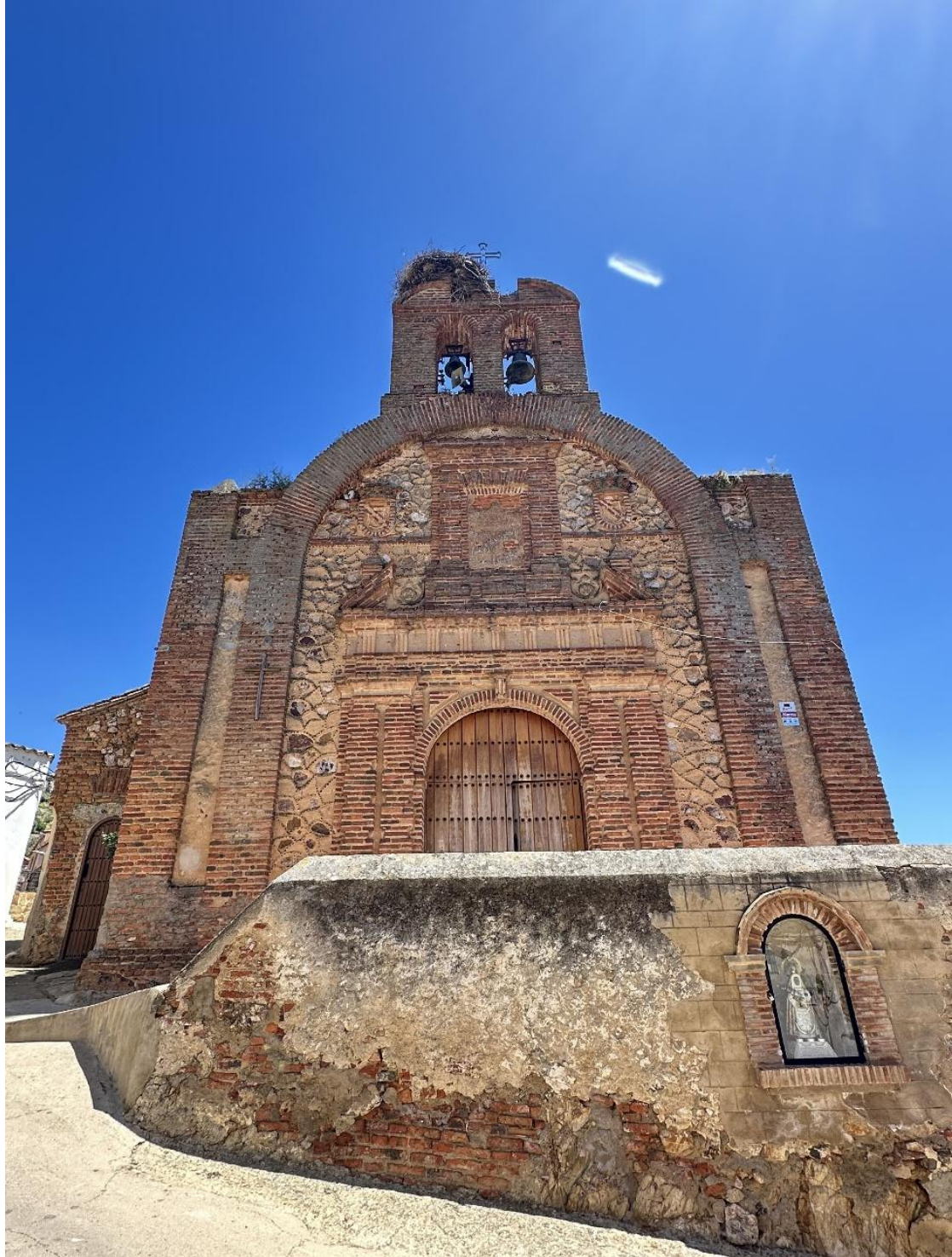
El templo está construido principalmente en ladrillo macizo y argamasa.