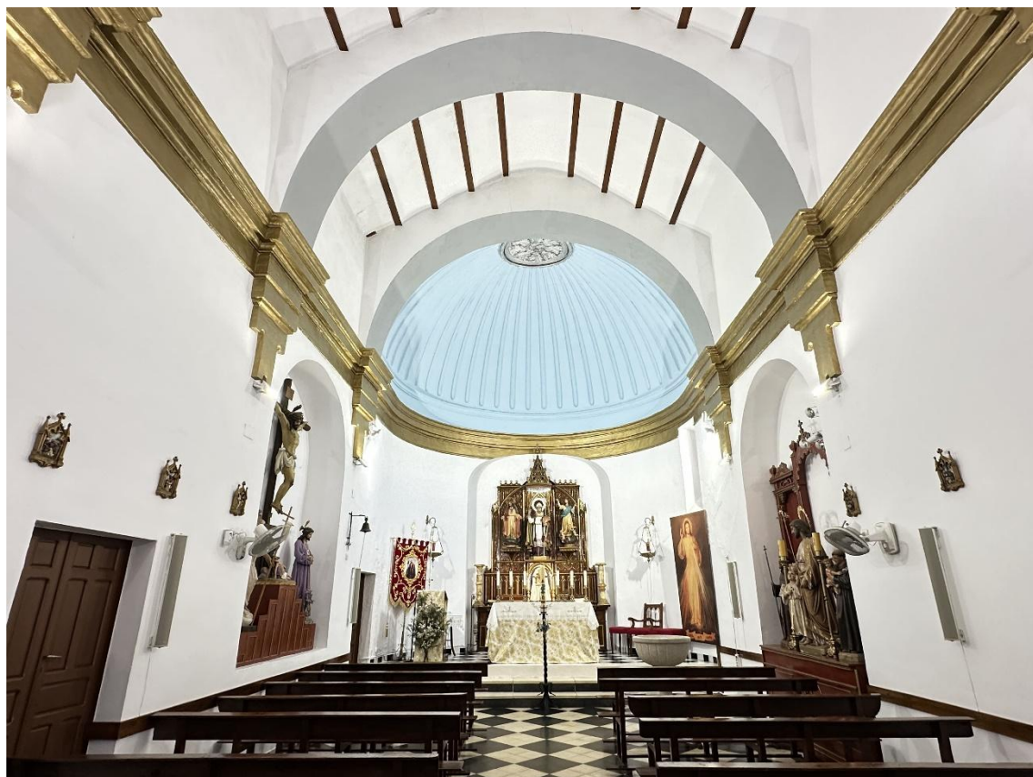
Interior de la Iglesia.