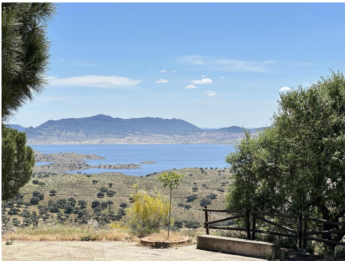
Paisaje que se divisa desde el mirador.