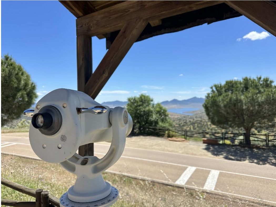
Imágenes del Mirador de las Eras.