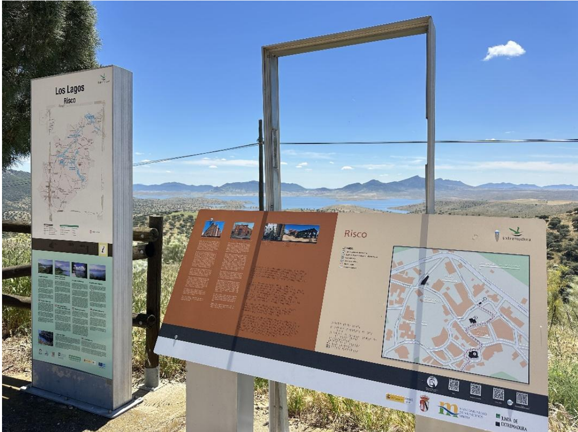
Paneles informativos en el Mirador de Las Eras de Risco.