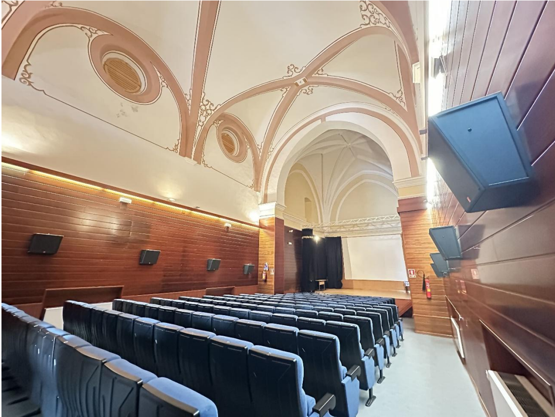
Imagen de la capilla una vez restaurada.