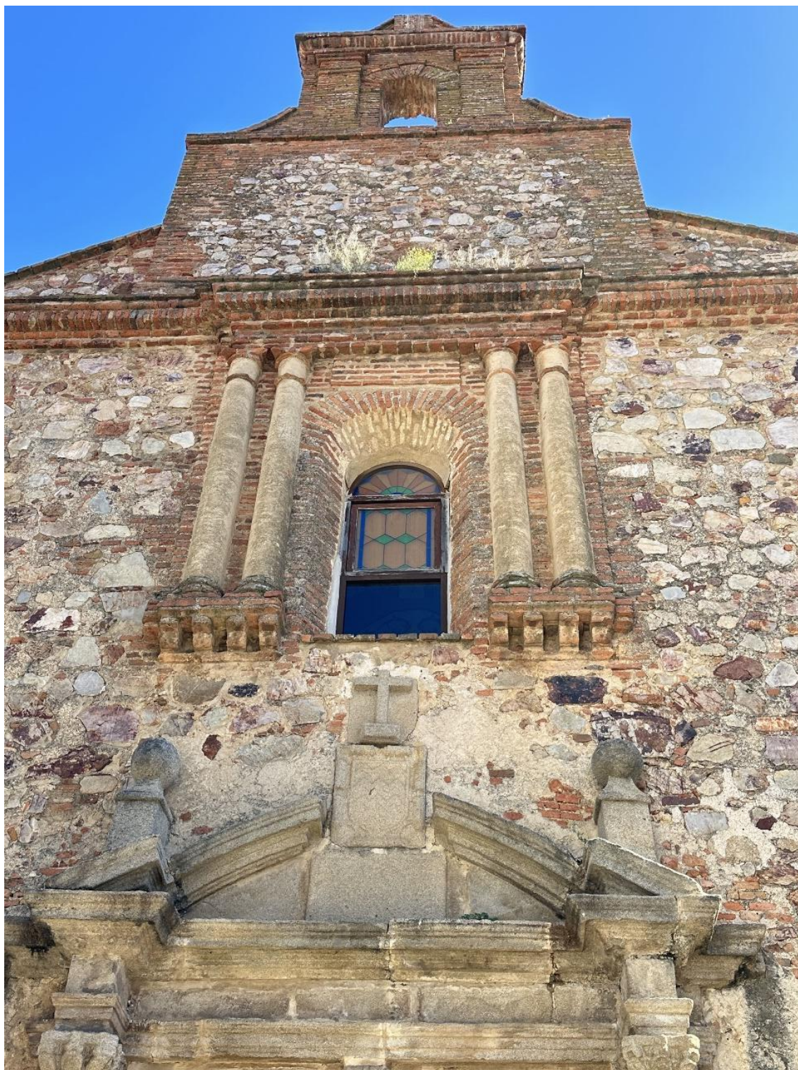
Portada de la antigua capilla con capillas en granito.