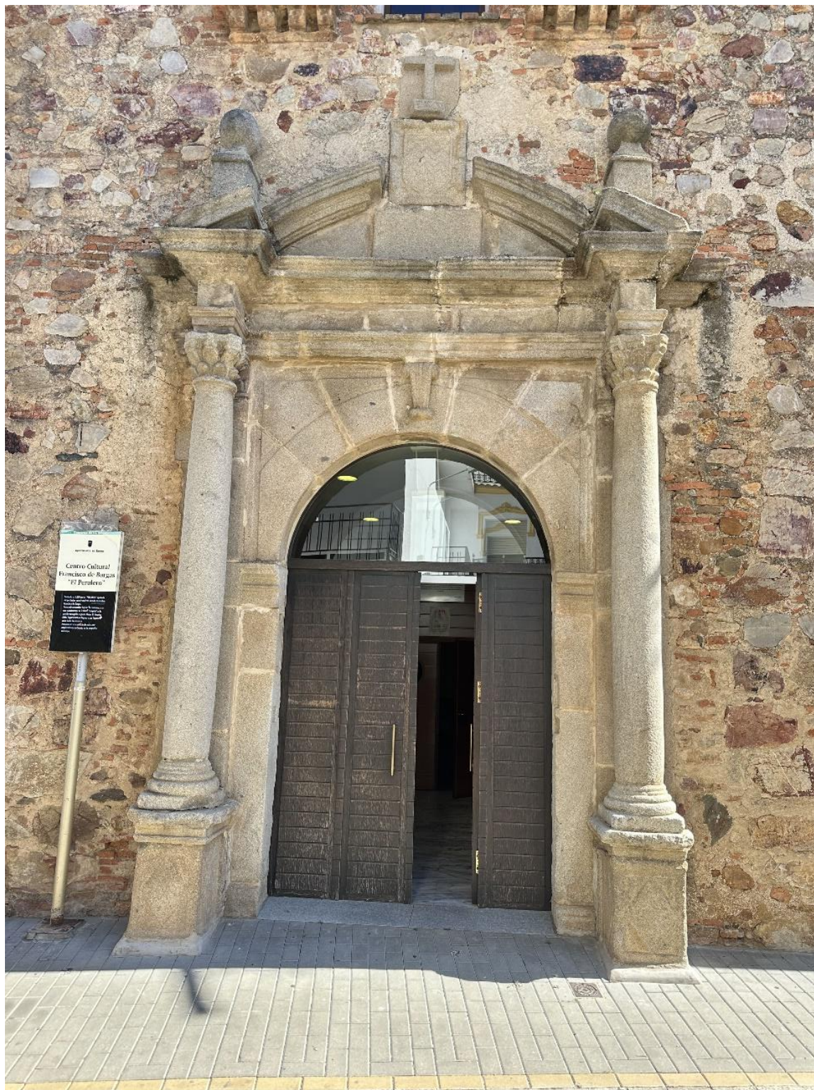
Puerta de acceso al edificio y escudo heráldico.