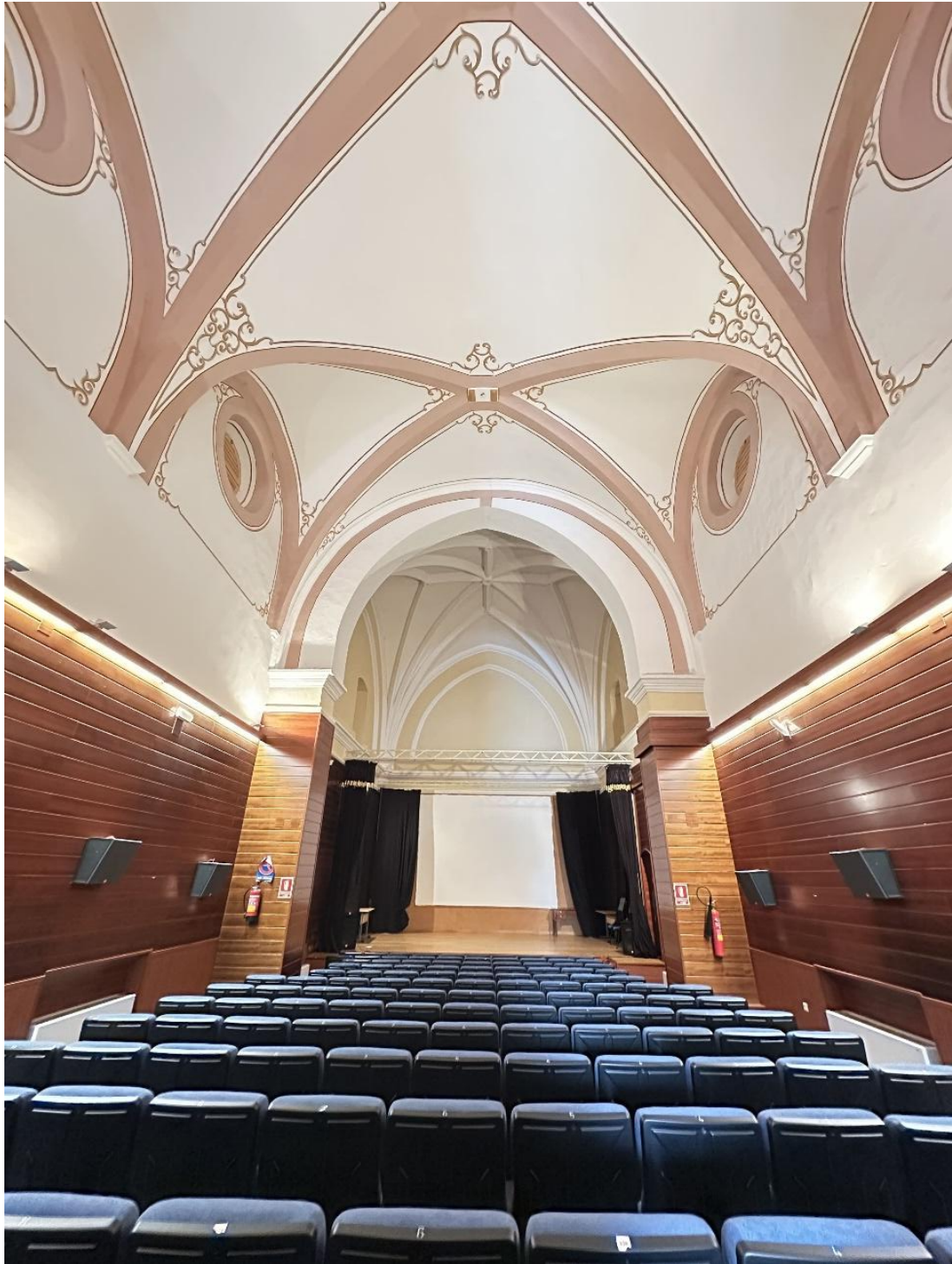
Detalle de la capilla, que constituía el núcleo religioso del conjunto asistencial.