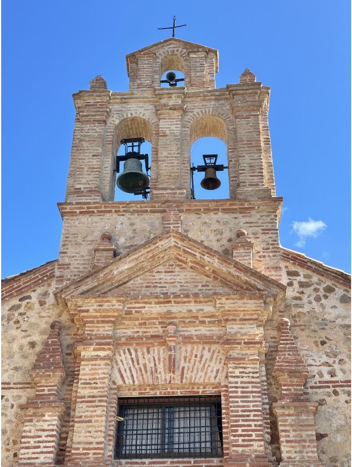
Espadaña del convento con apertura para dos campanas.