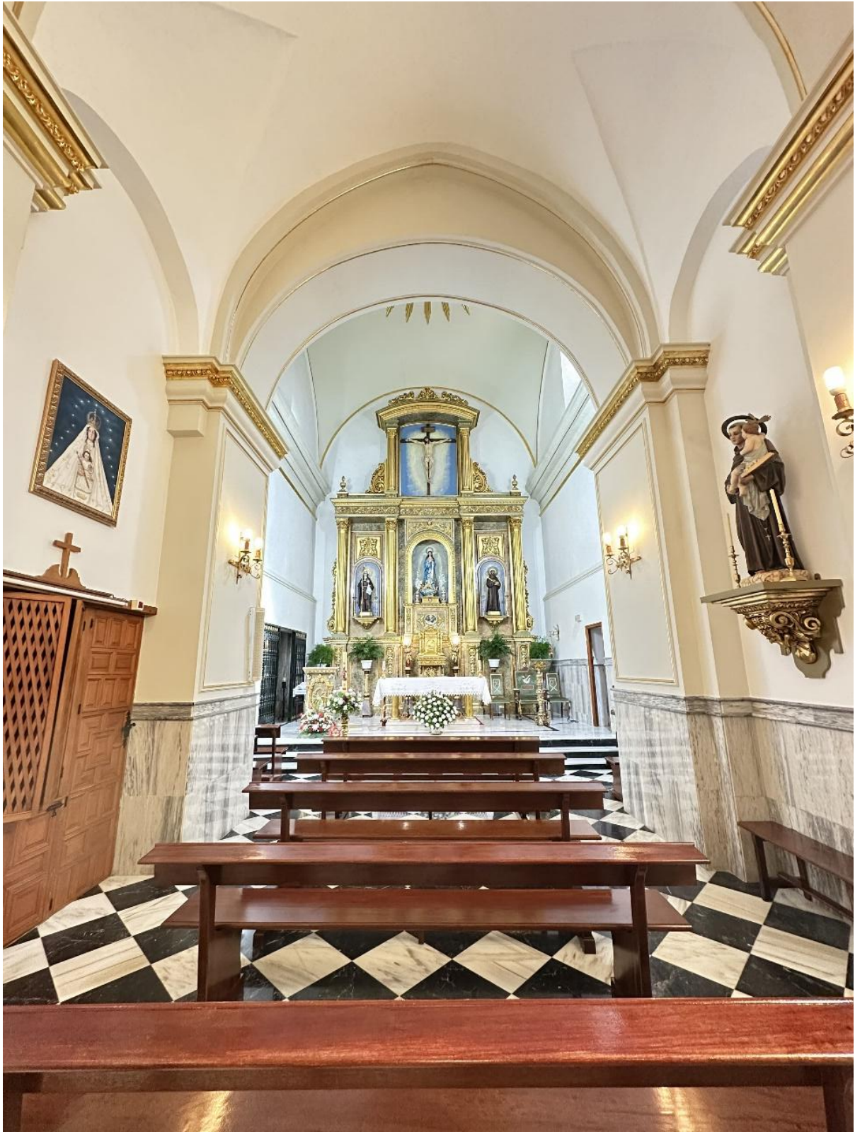
Imagen del interior del templo, con el retablo al fondo.