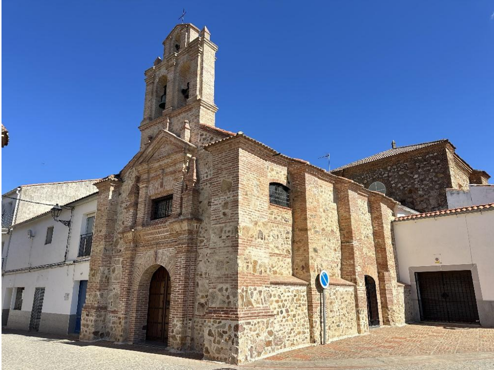
Imágenes del convento desde distintos ángulos.