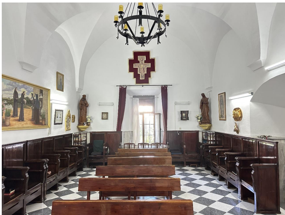
Zona de clausura del convento.