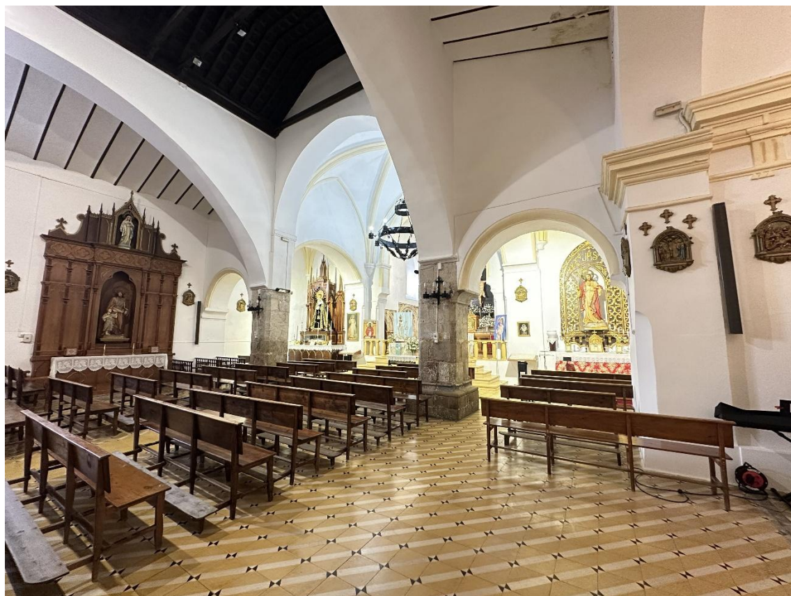
Planta rectangular y tres naves separadas por gruesas columnas y capillas laterales adosadas.