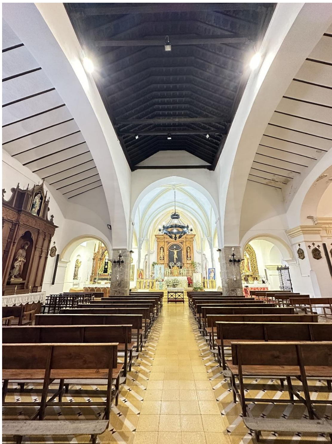
Interior de la iglesia donde sobresale el artesanado de madera de la nave central.