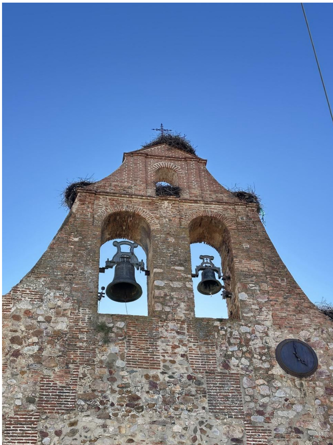
Espadaña con dos campanas de distinto tamaño.