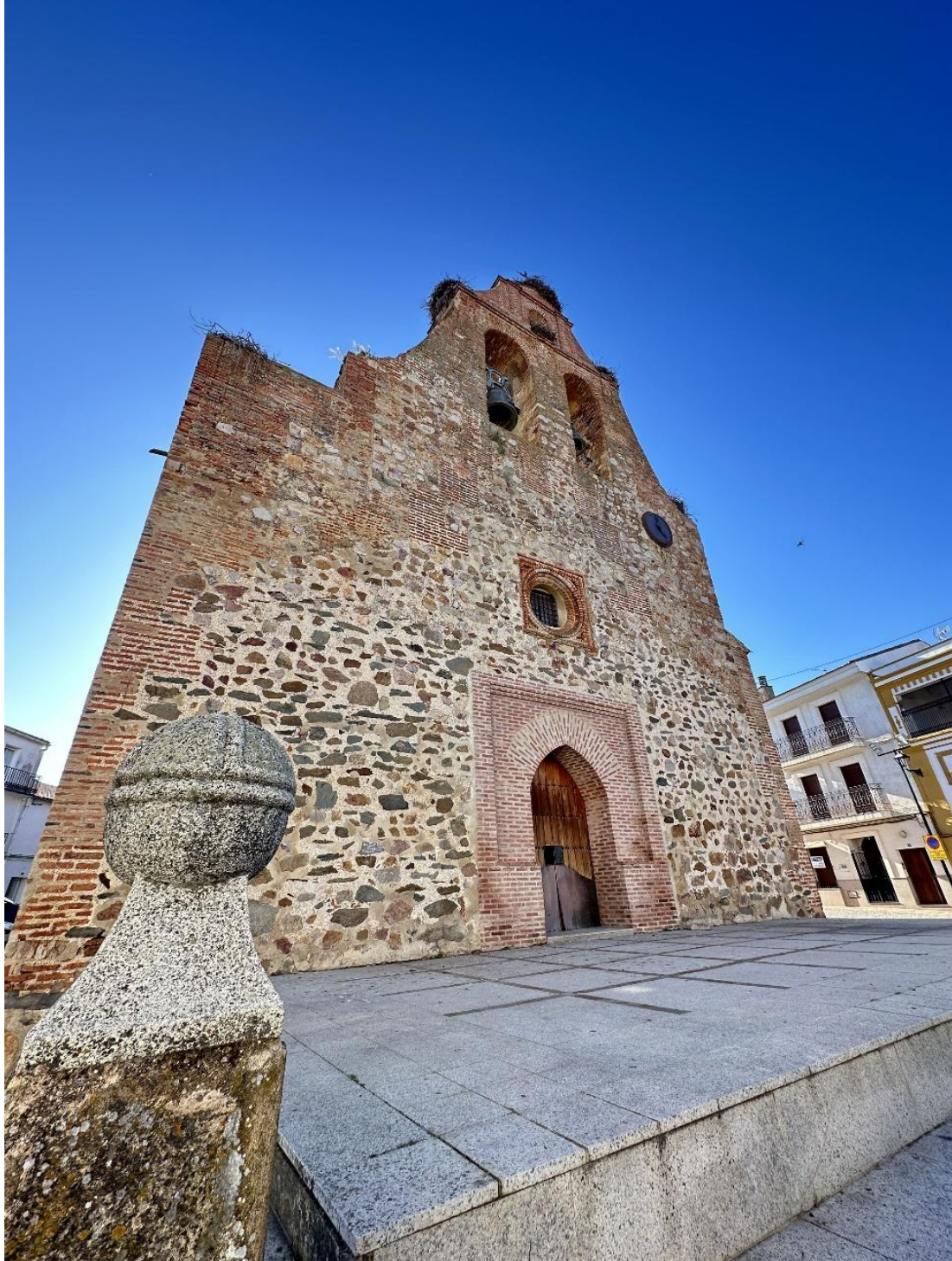
Fachada principal de la Iglesia de Nuestra Señora de la Antigua.