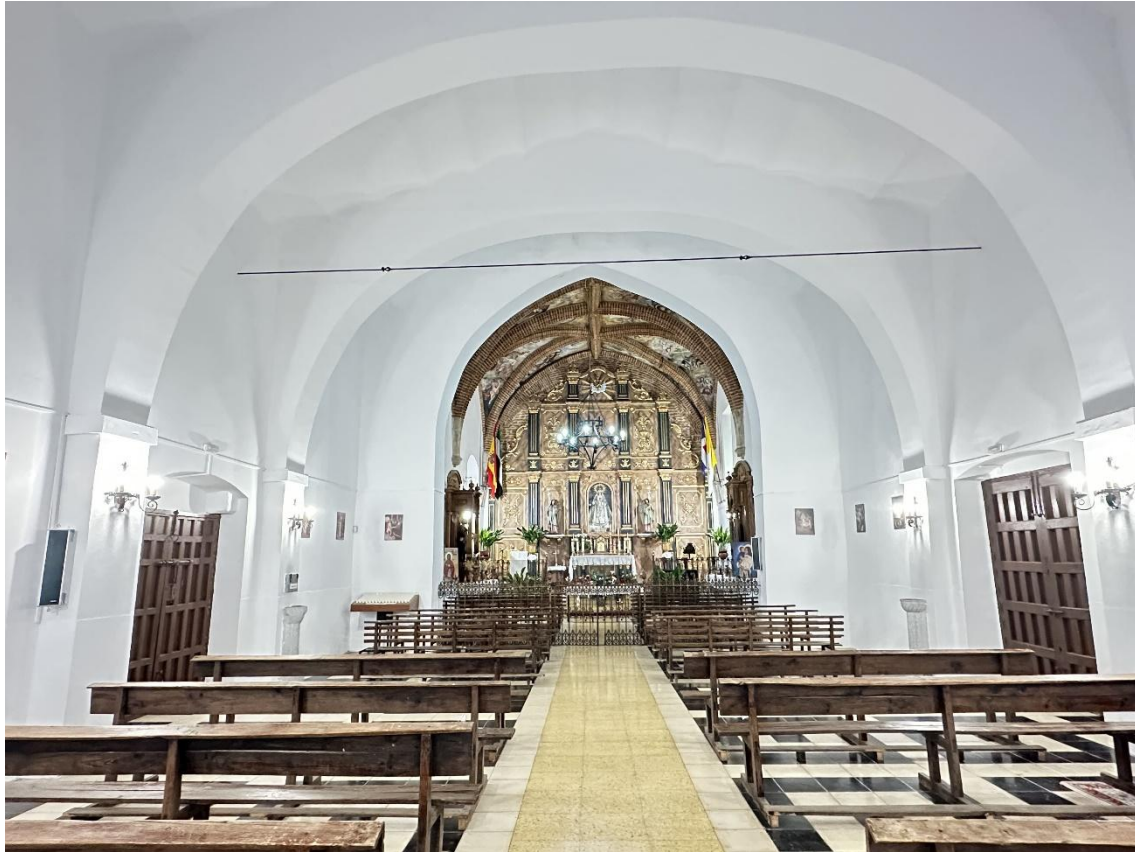
La Capilla Mayor data de comienzos del siglo XVI.