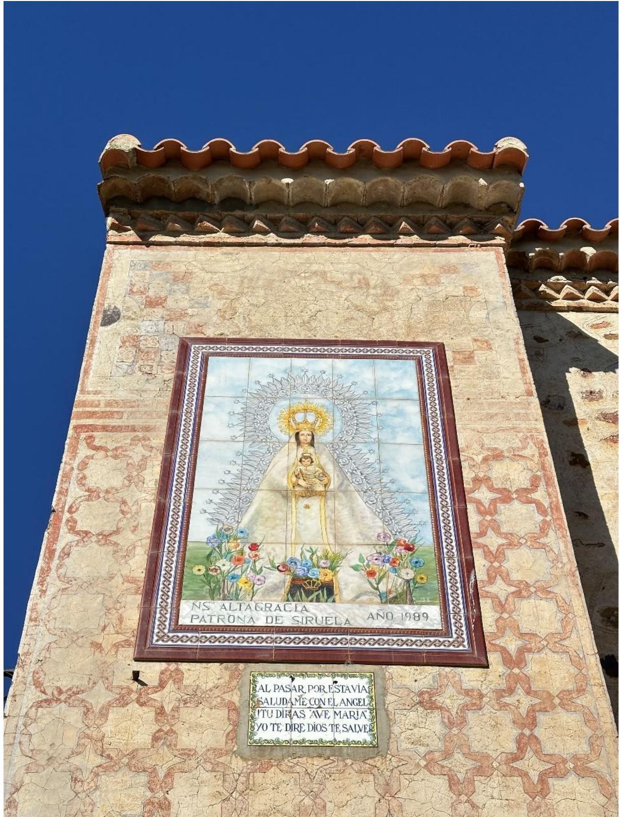
Detalle en azulejos en una de las paredes de la ermita con la imagen de Ntra. Sra. De Altagracia.