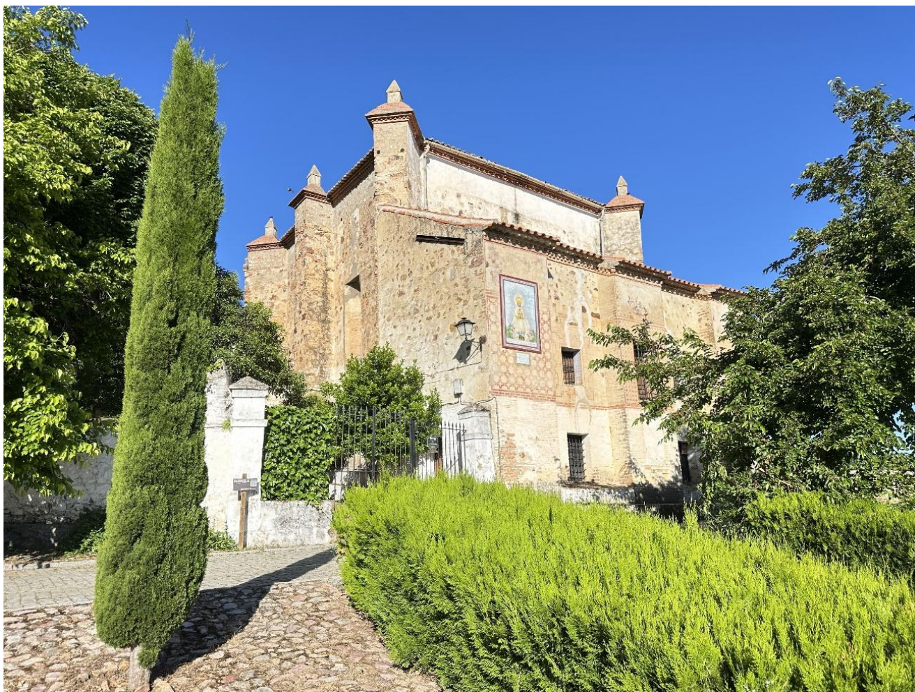
Exterior de la ermita, ubicada en una zona de gran belleza.