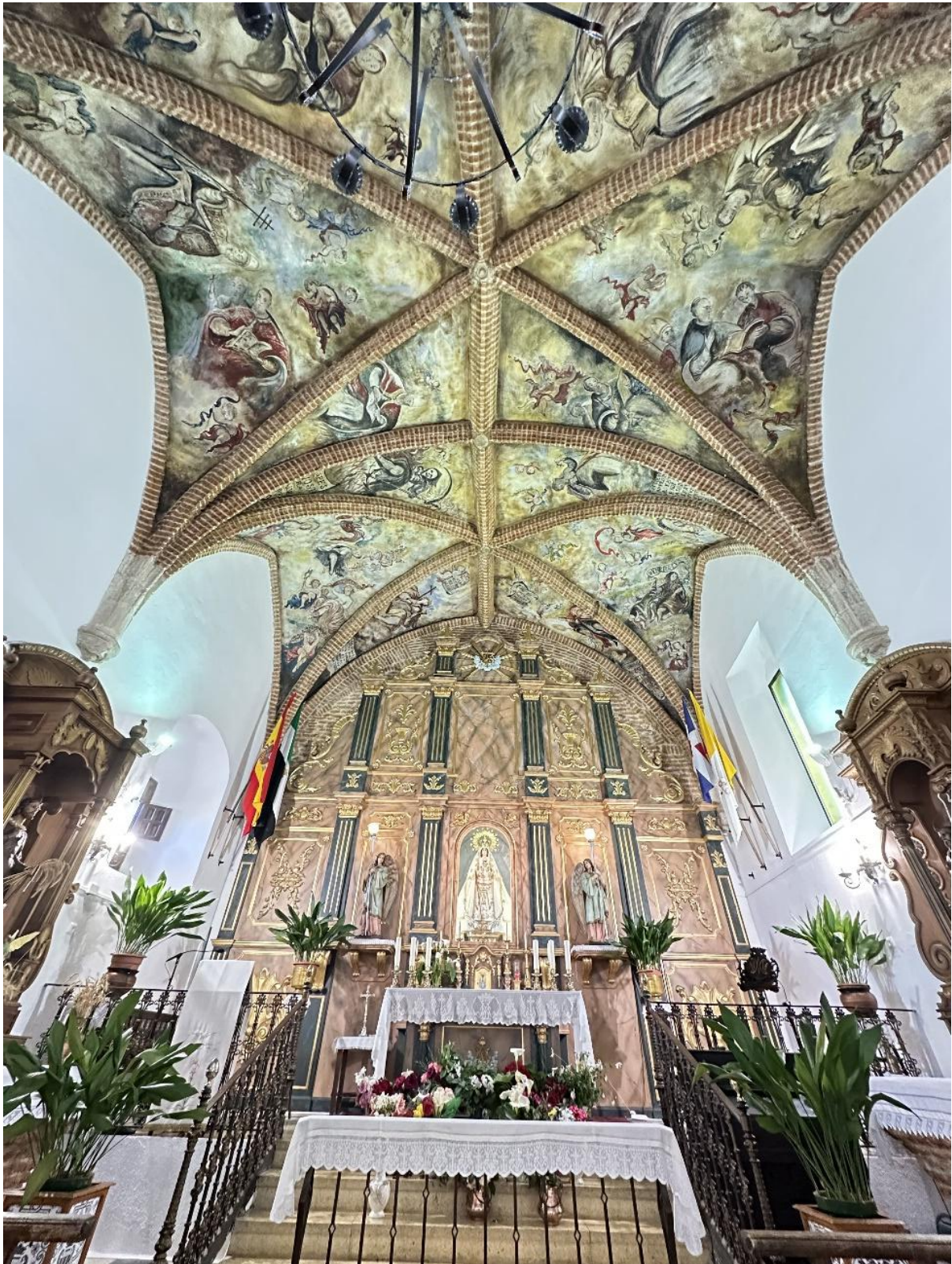
El edificio presenta una estructura heterogénea resultado de distintas fases constructivas.