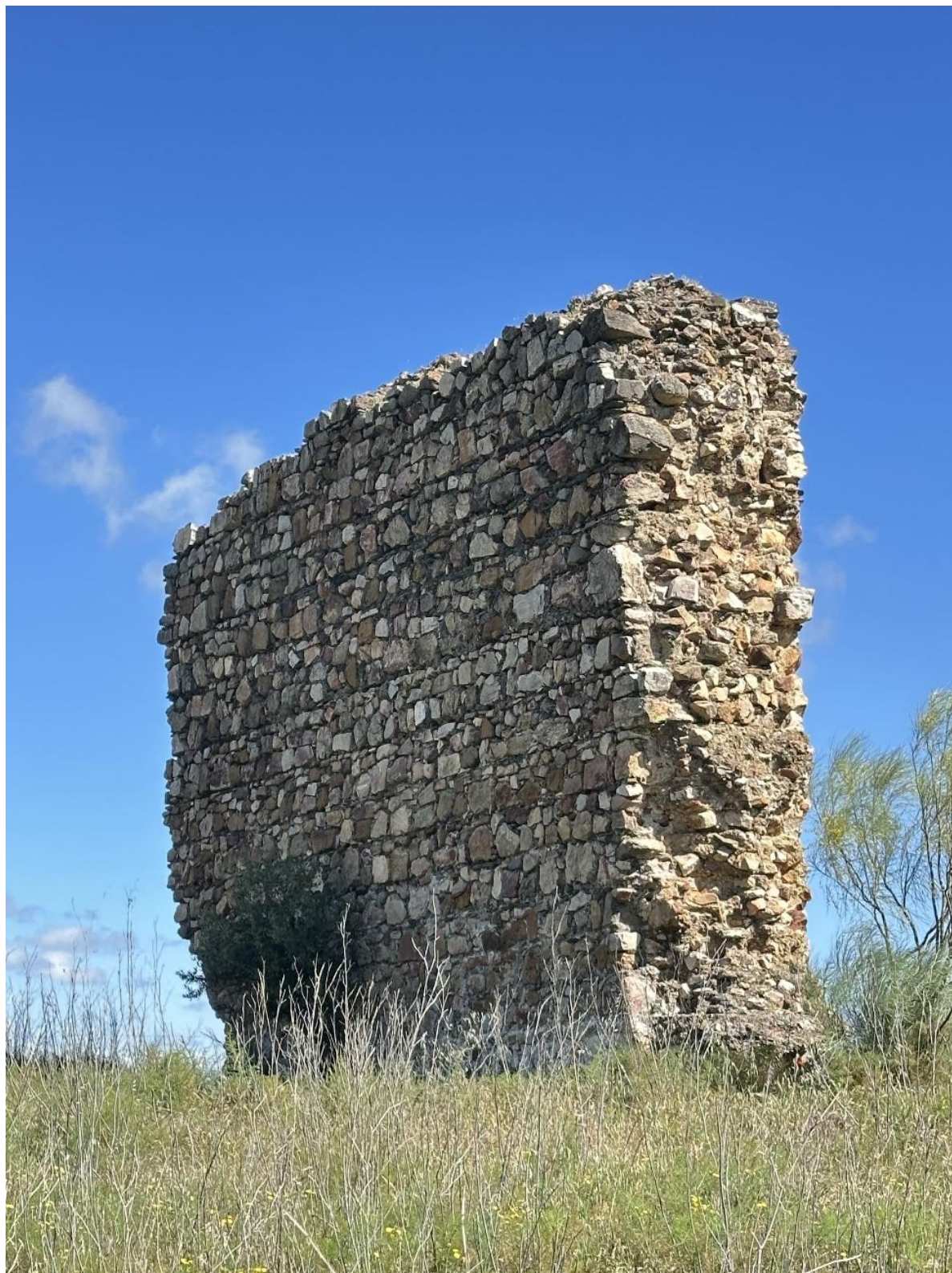
Uno de los paredones que aún se conserva.