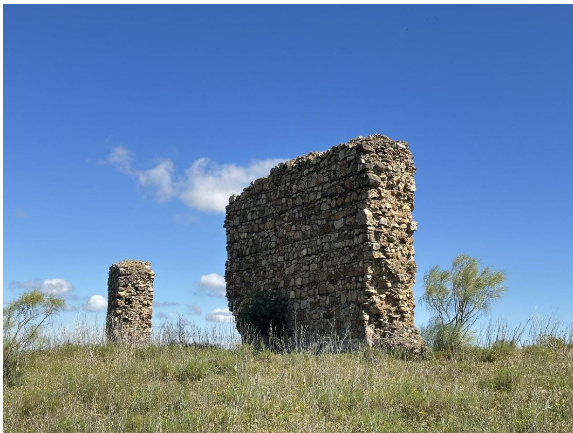
Restos de los Paredones de La Cava.