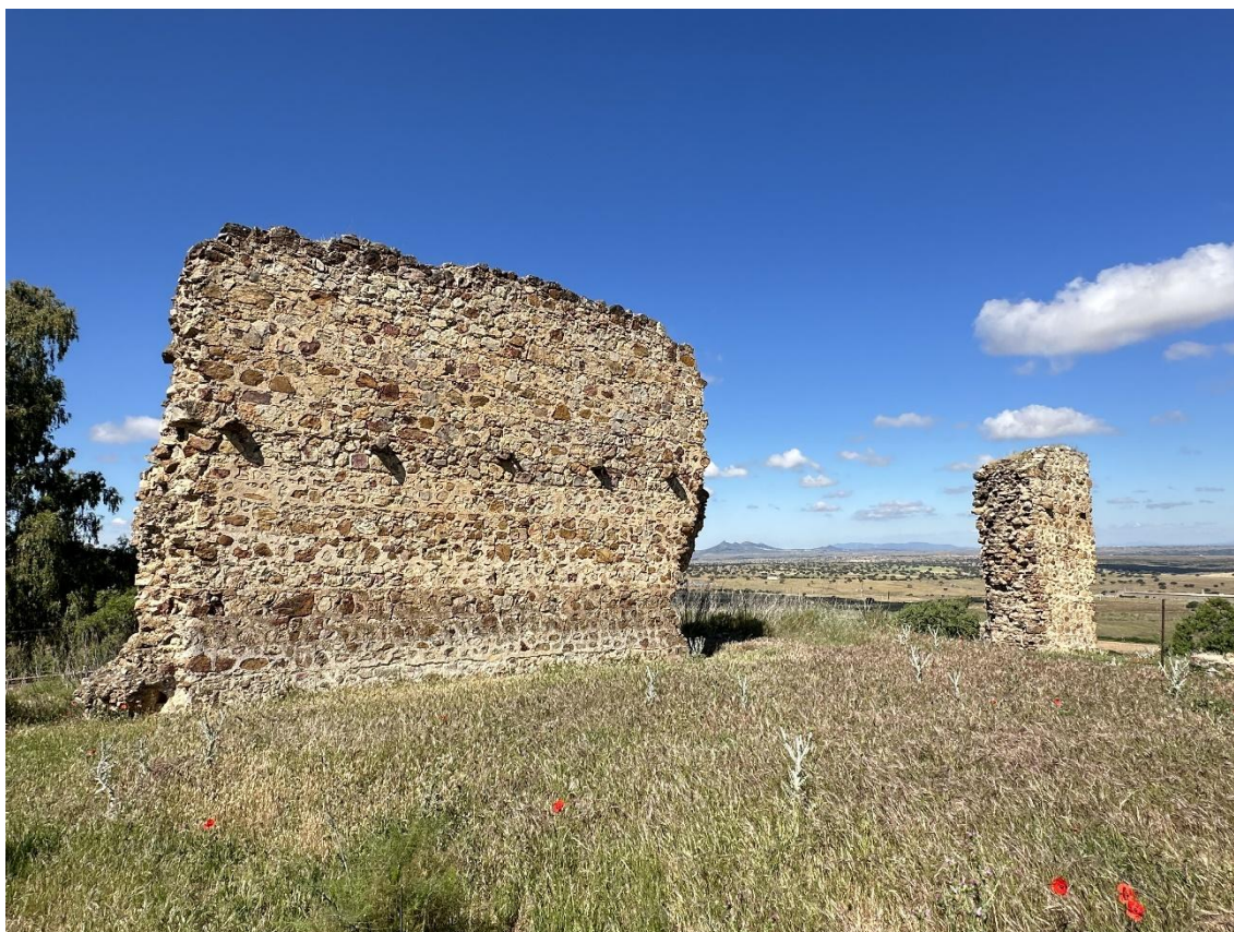
Desde la zona se pueden contemplar espectaculares vistas.