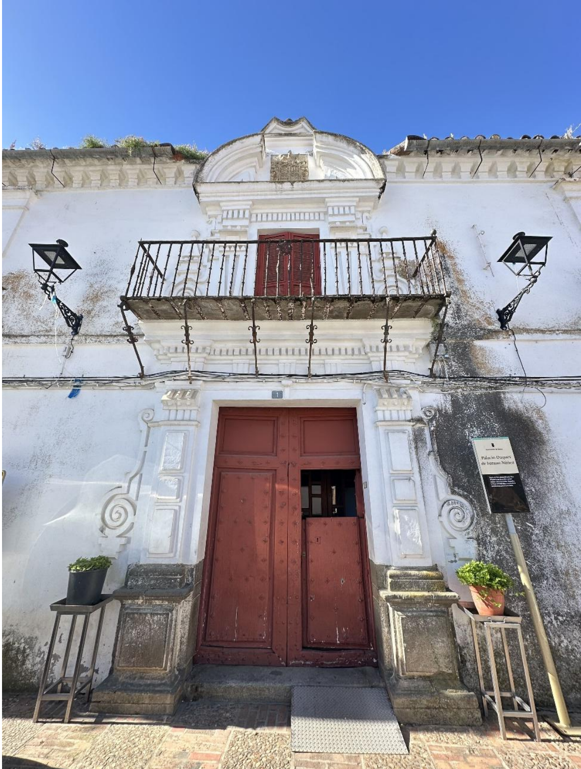
Fachada del palacio en la Plaza de España de Siruela.