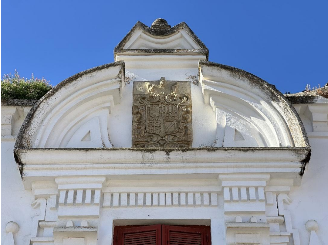
En las imágenes, cornisa de perfil semicircular, en cuyo centro se sitúa el escudo nobiliario.