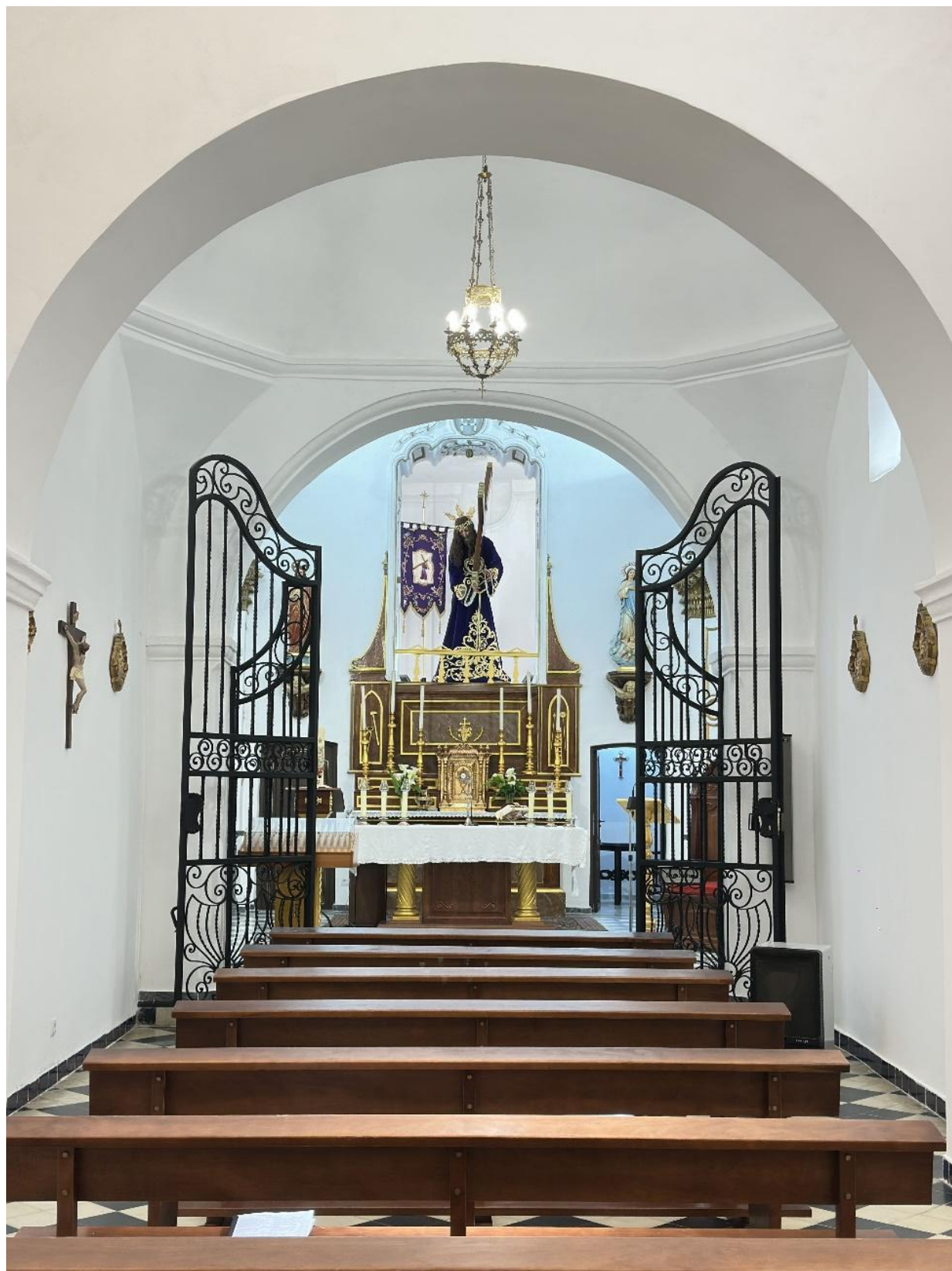
Imagen del interior del templo.