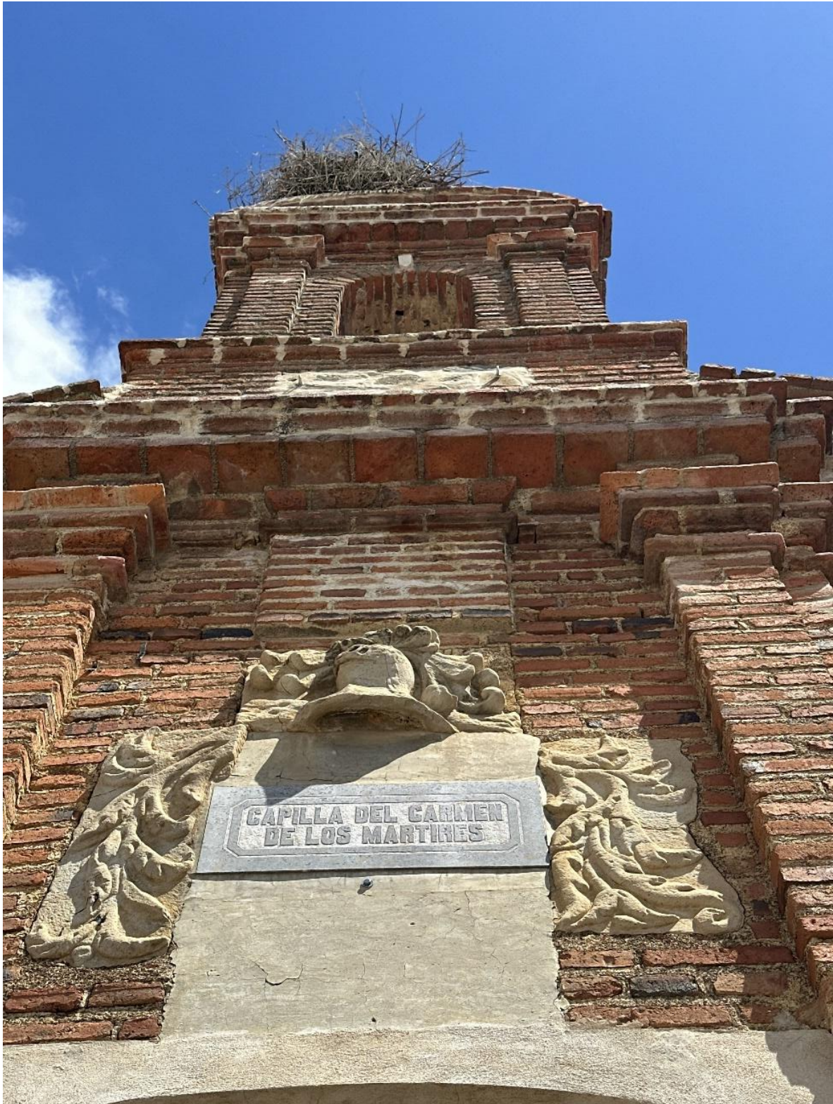
La capilla muestra una portada de ladrillo de líneas sobrias.