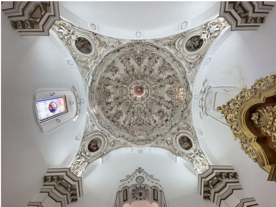
Cúpula decorada con yeserías.