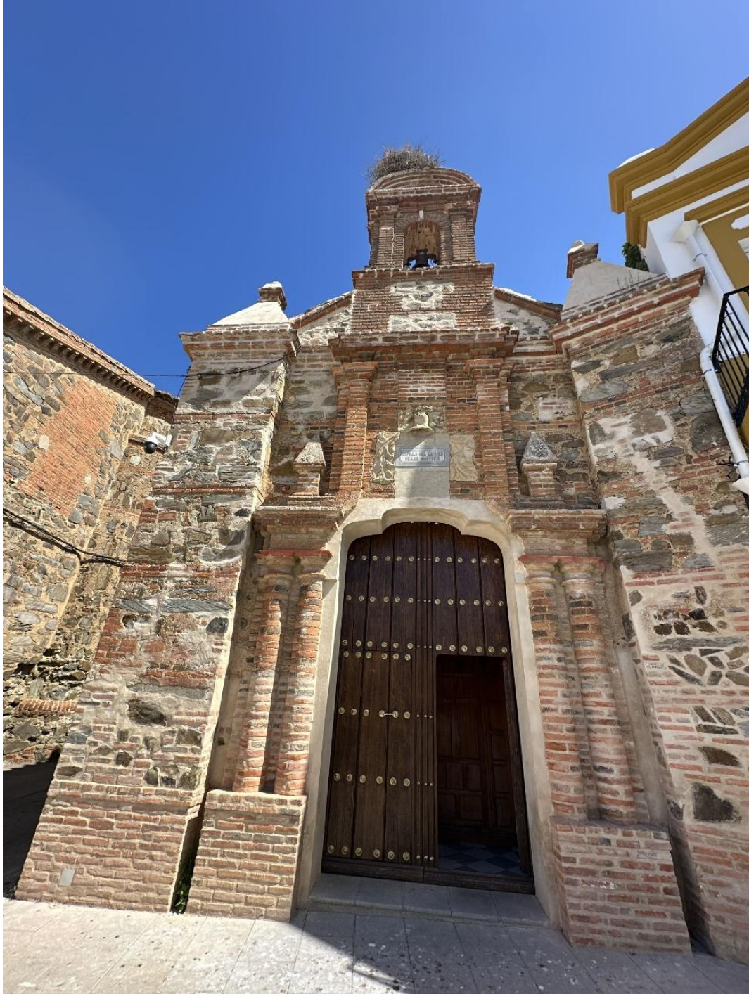
El edificio presenta una tipología que le sitúa entre el barroco y el rococó.