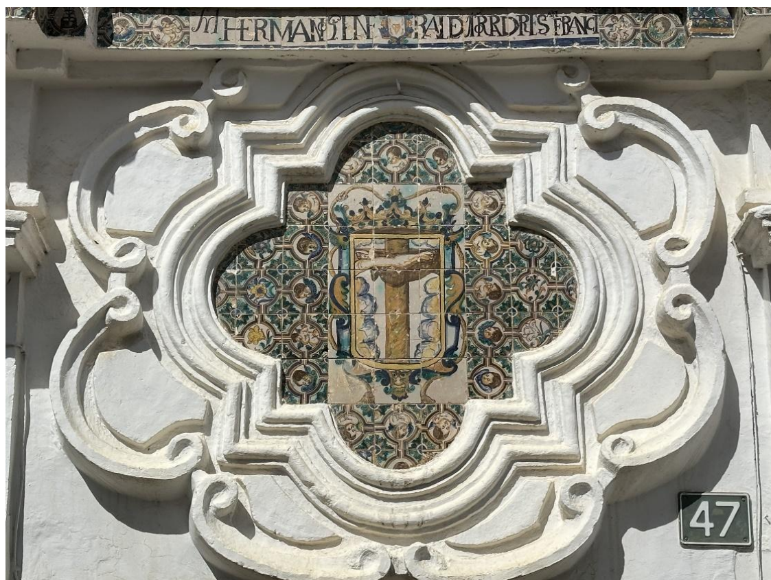
Legenda de la Hermandad de Padres Franciscanos.