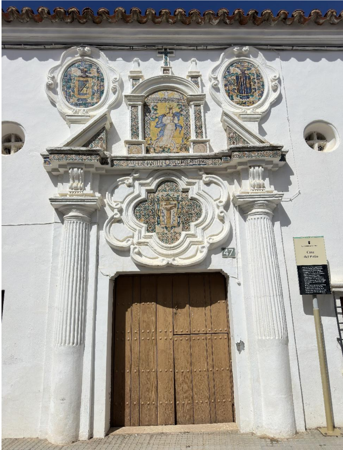
Azulejos con composiciones geométricas y motivos figurativos en la fachada de la vivienda.