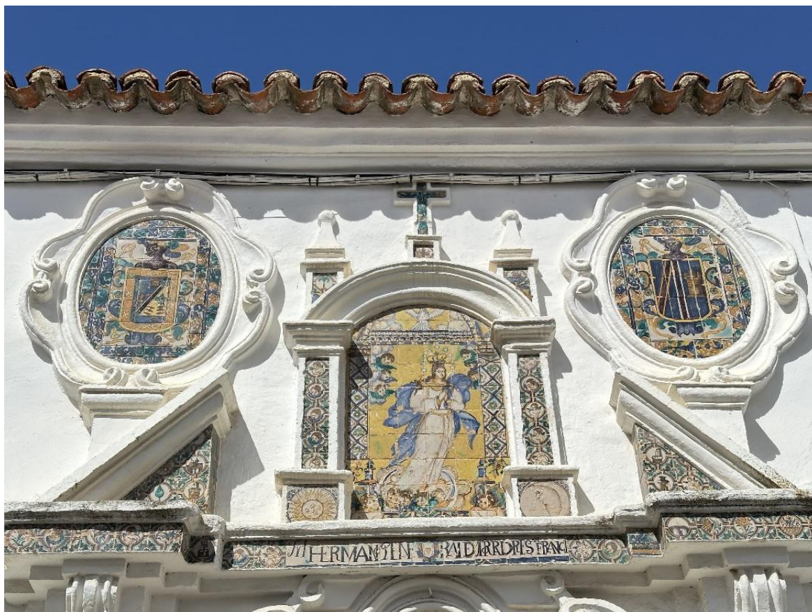
Detalle de los azulejos que se encuentran en la parte superior de la casa.