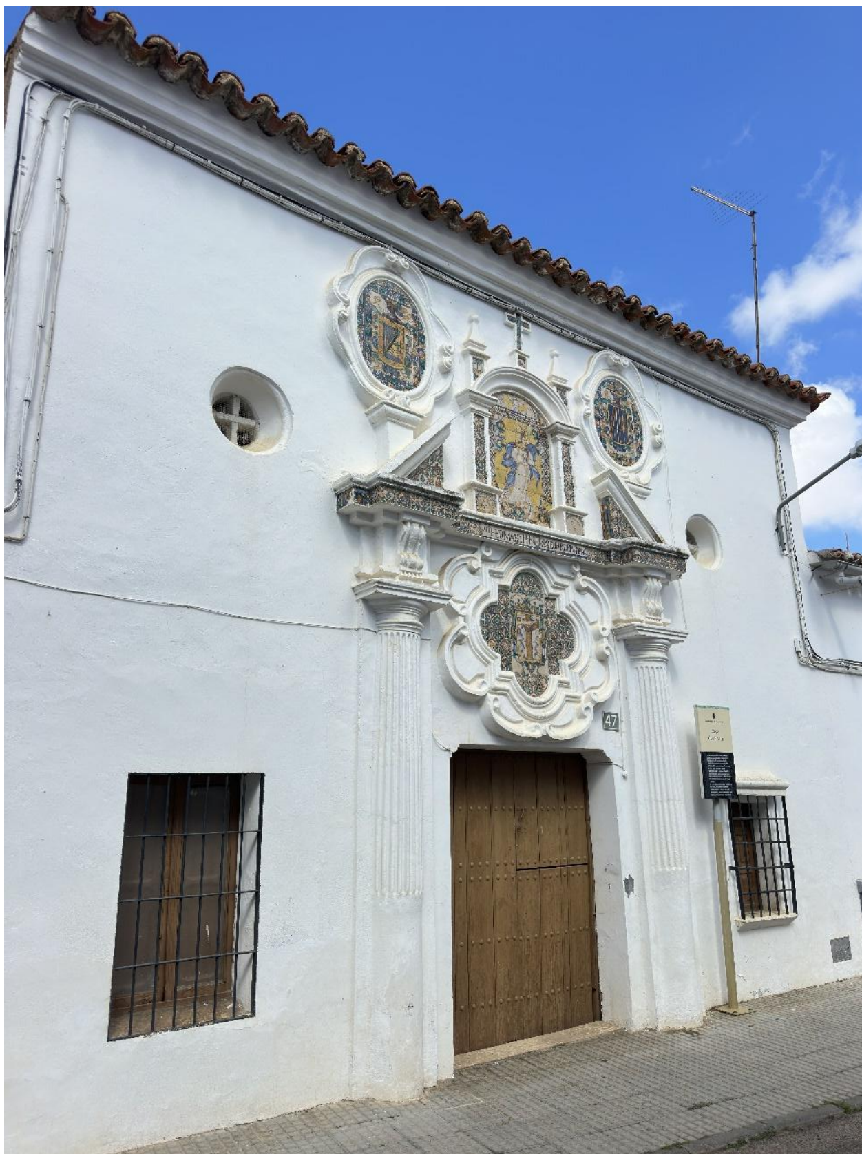
La vivienda fue objeto de reformas ornamentales.