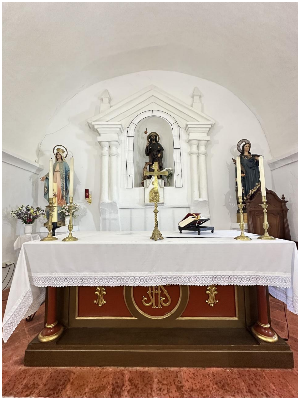
Interior del templo con la imagen de San Roque al fondo.