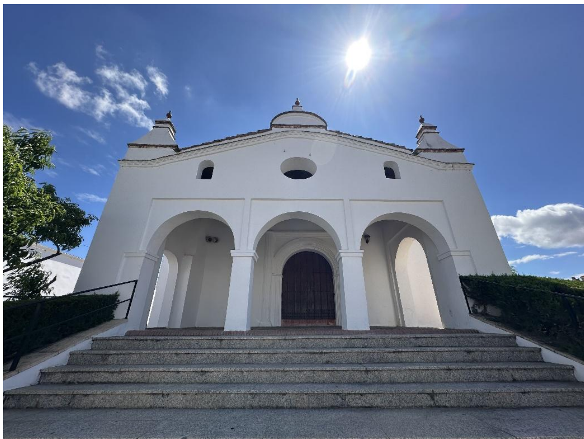
Vista frontal de la ermita.