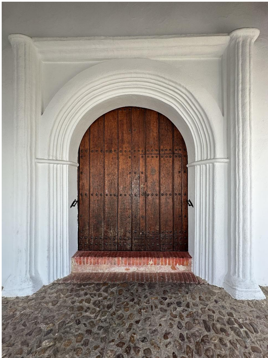
Puerta de acceso.