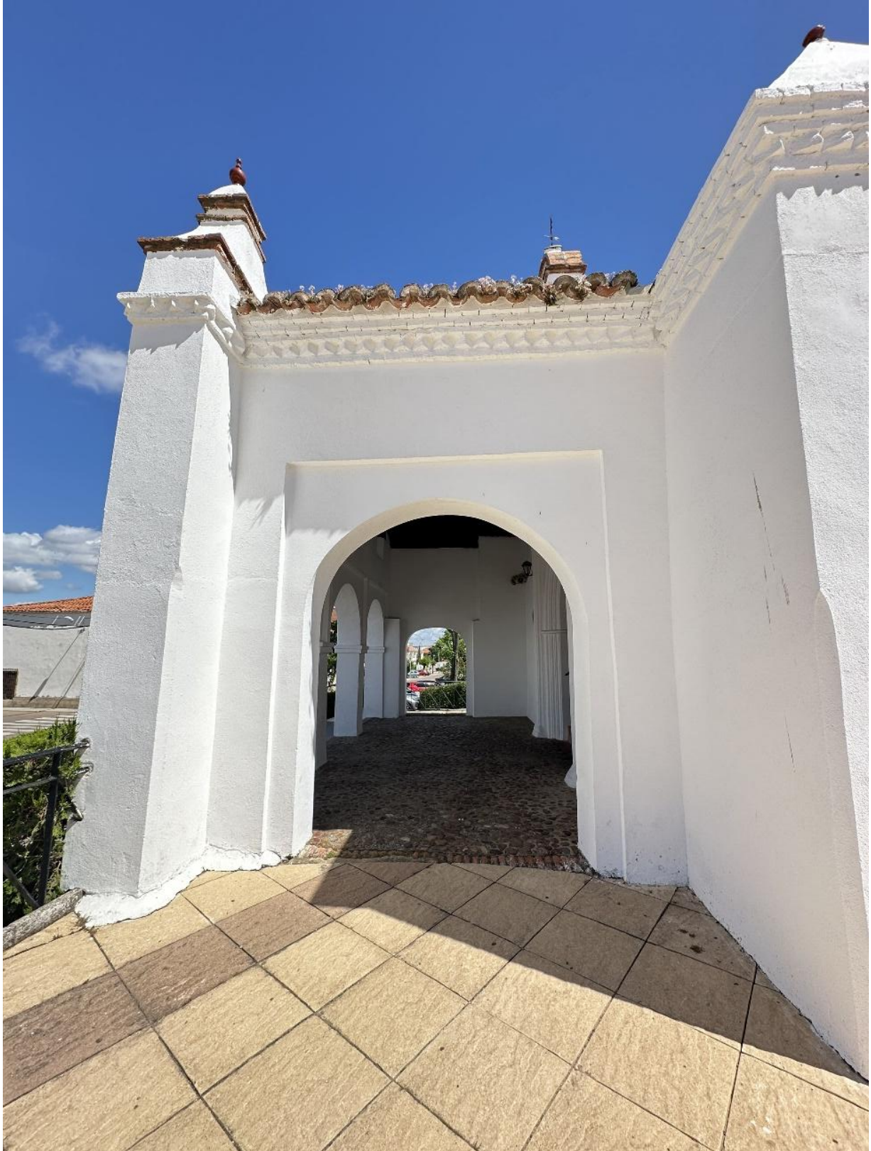
Zona porticada de acceso a la ermita.