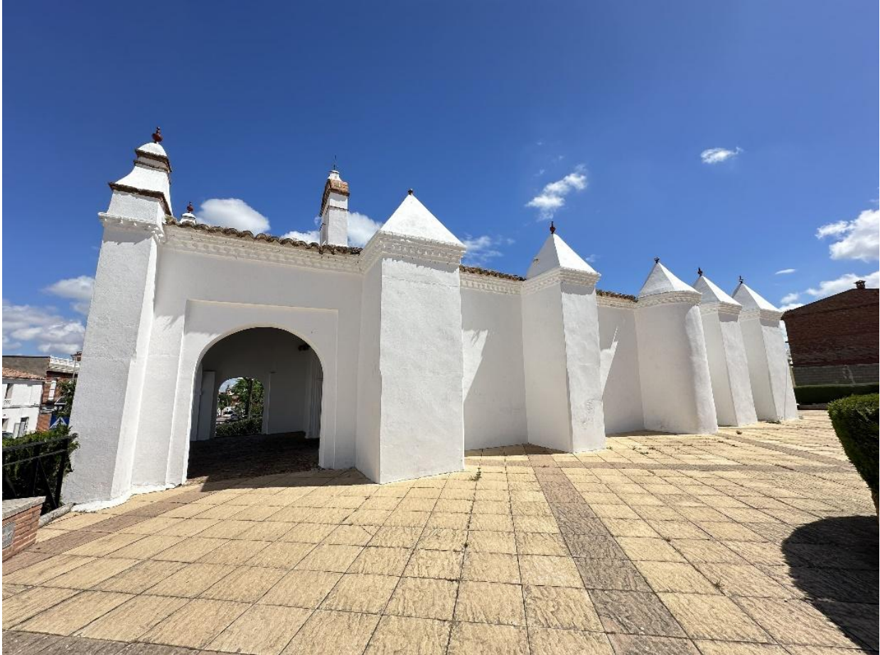
Detalle de la arquitectura sobria de la Ermita de San Roque.