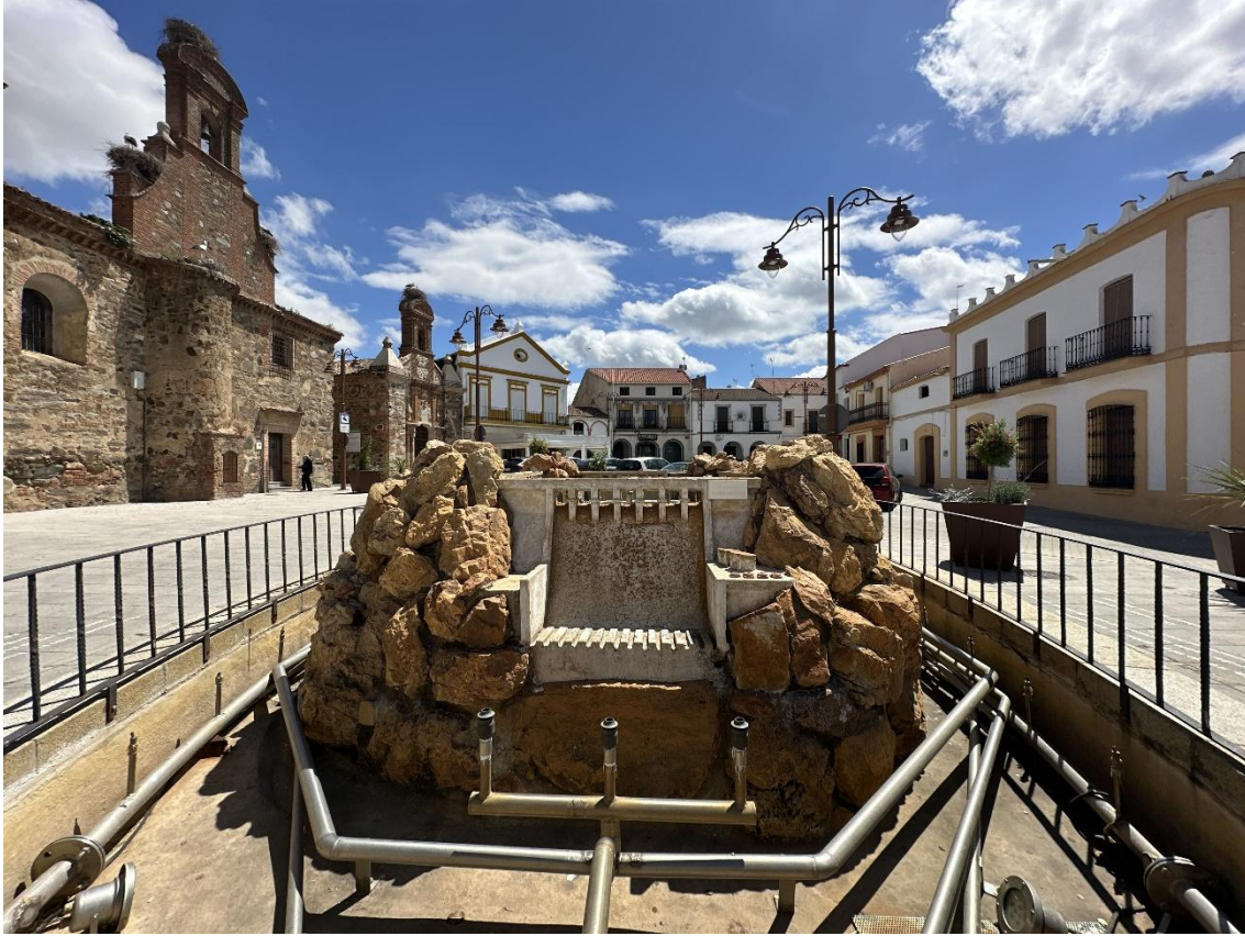
La imagen de la fuente desde otra perspectiva.