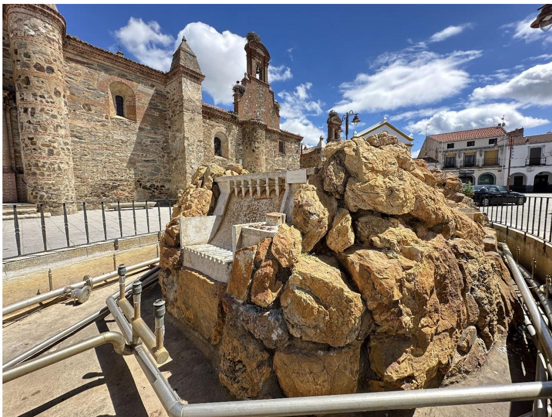
La fuente representa los embalses de Zújar, Orellana, Cijara y García de Sola.