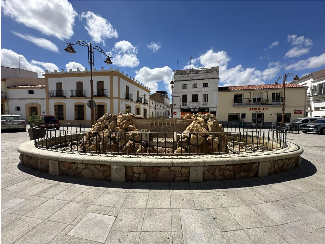
La fuente se encuentra en el centro de la Plaza de España de Talarrubias.