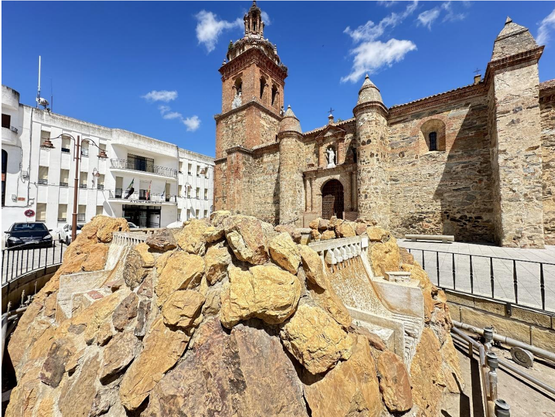
Fuente de los Cuatro Pantanos con la Iglesia de Santa Catalina de Alejandría al fondo.