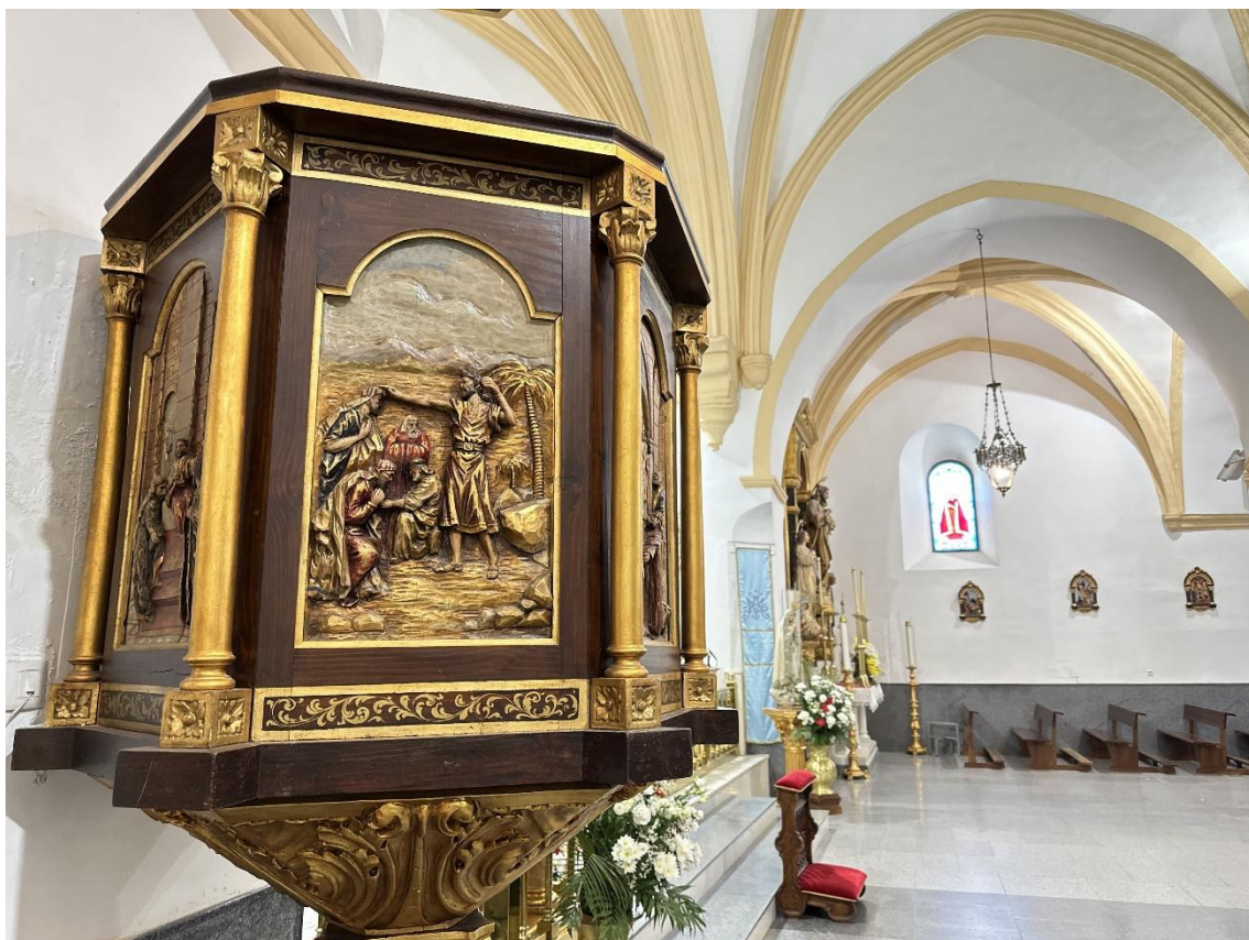
Detalle del púlpito antiguo en el interior de la iglesia.