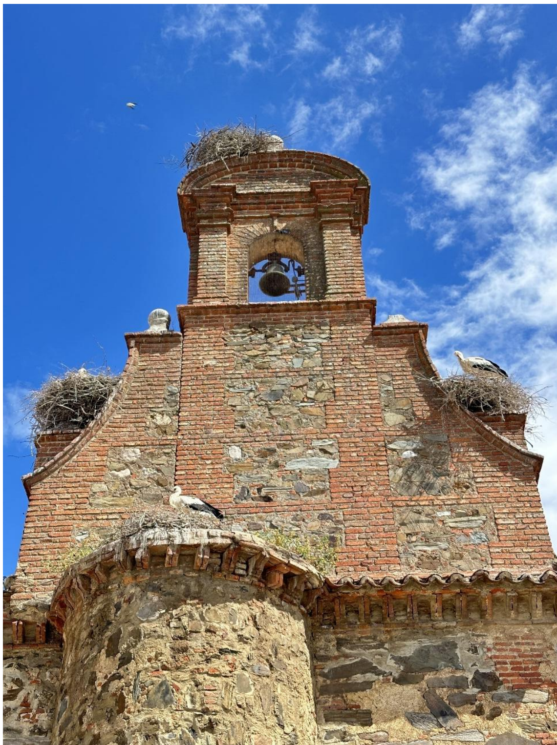
Detalle de la espadaña que corona la parroquia con una sola campana.