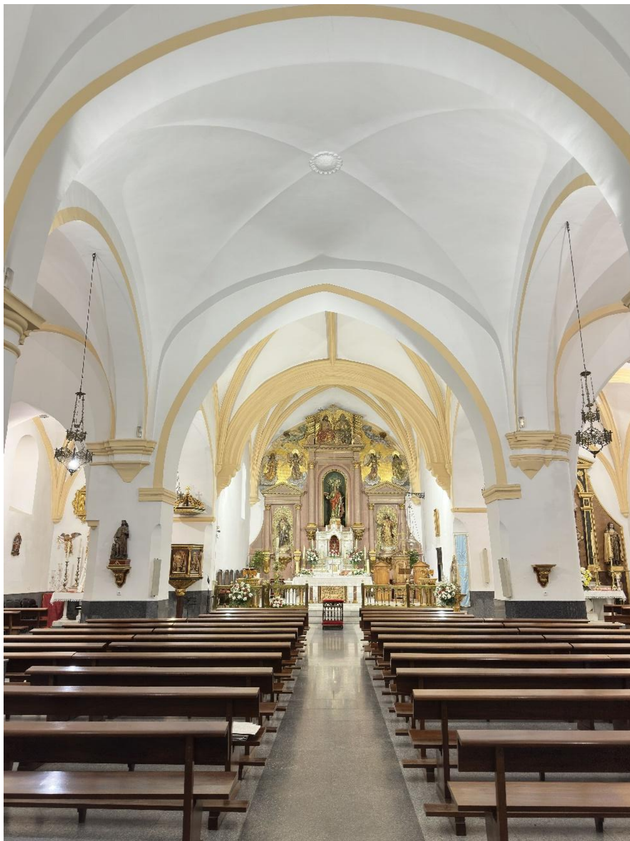
El templo tiene una longitud de 45 metros.