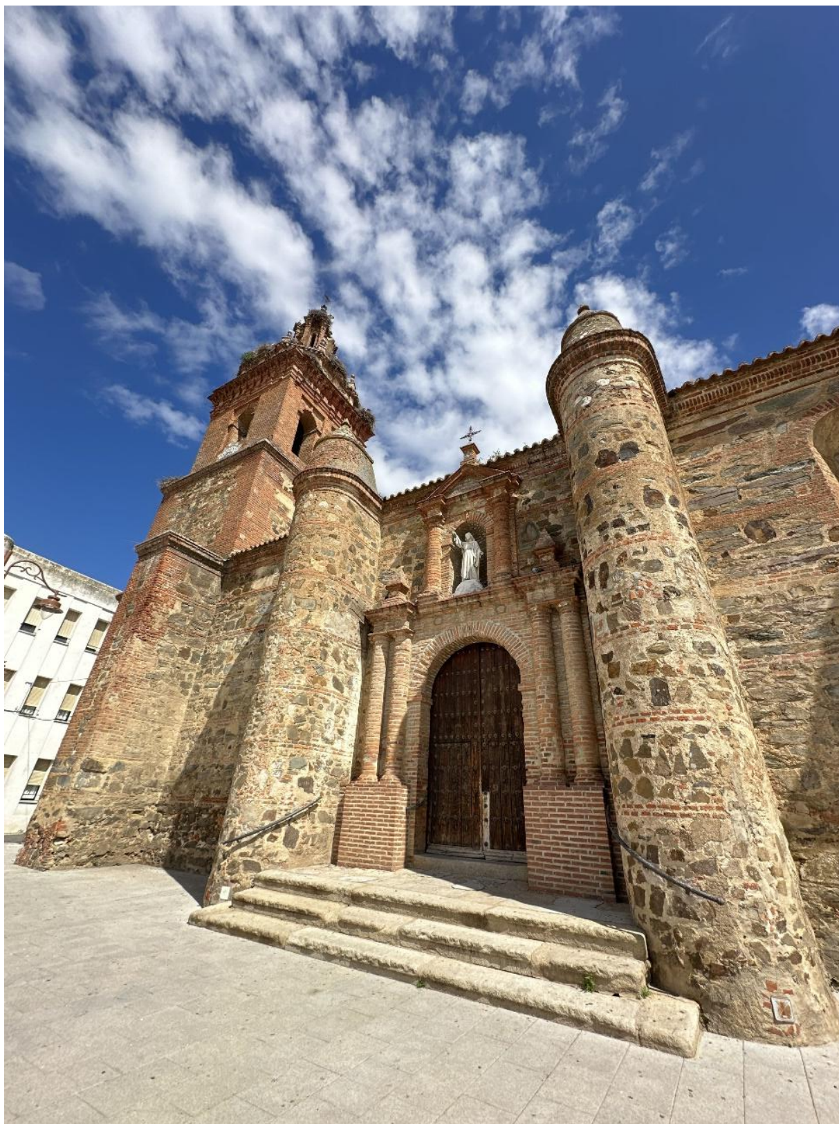
La torre tiene una altura de 31 metros hasta el arranque de la veleta y la cruz.