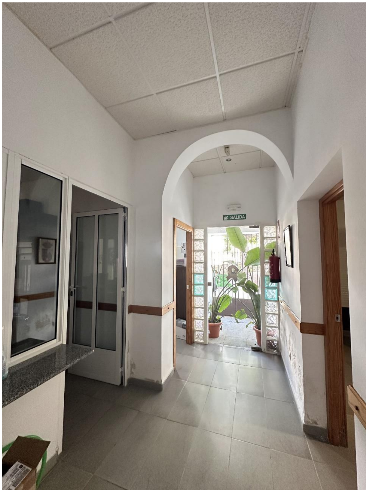
Entrada y recepción.