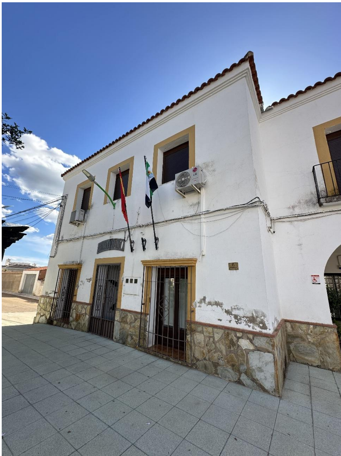
Fachada principal del ayuntamiento.