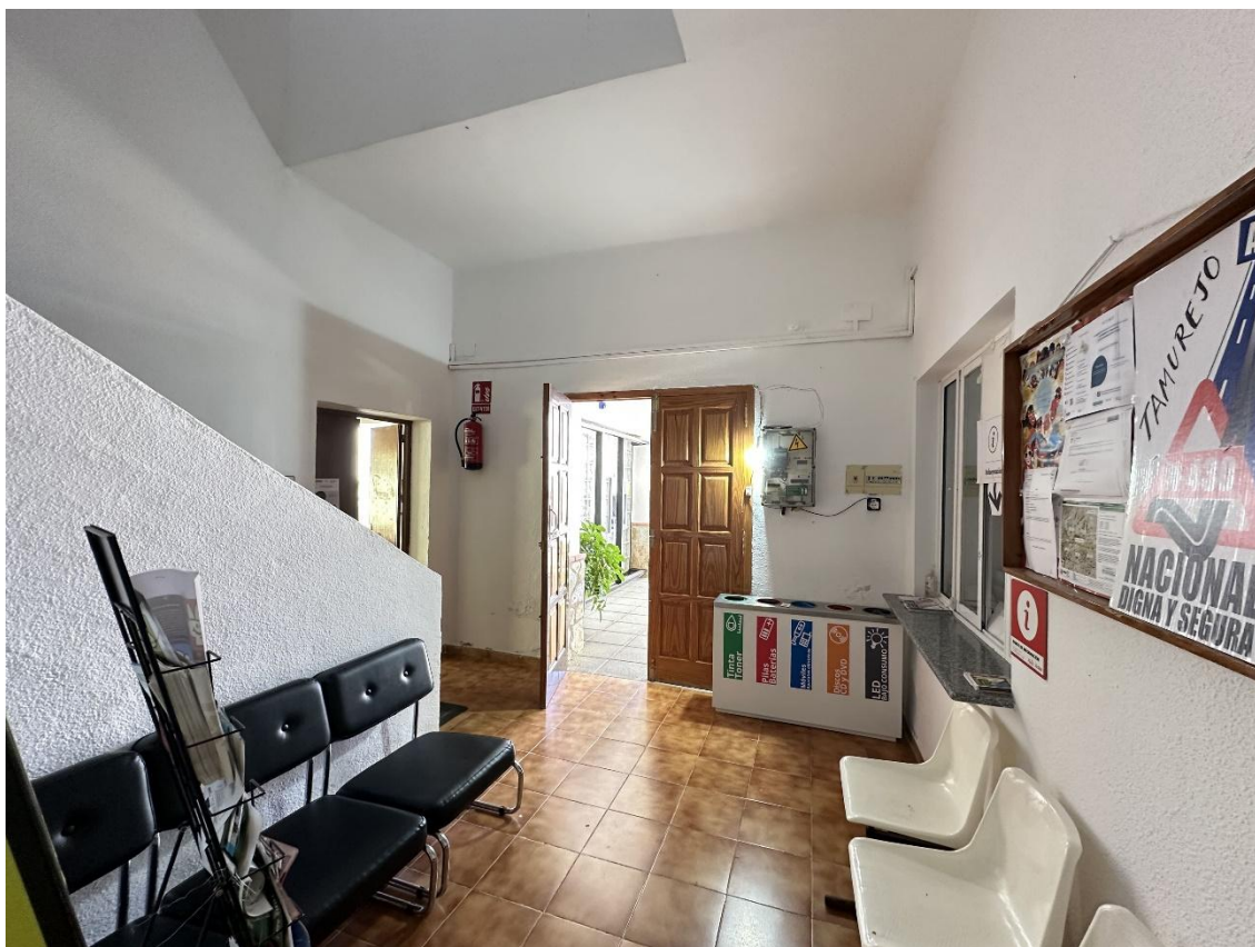
Acceso a las instalaciones vista desde dentro.