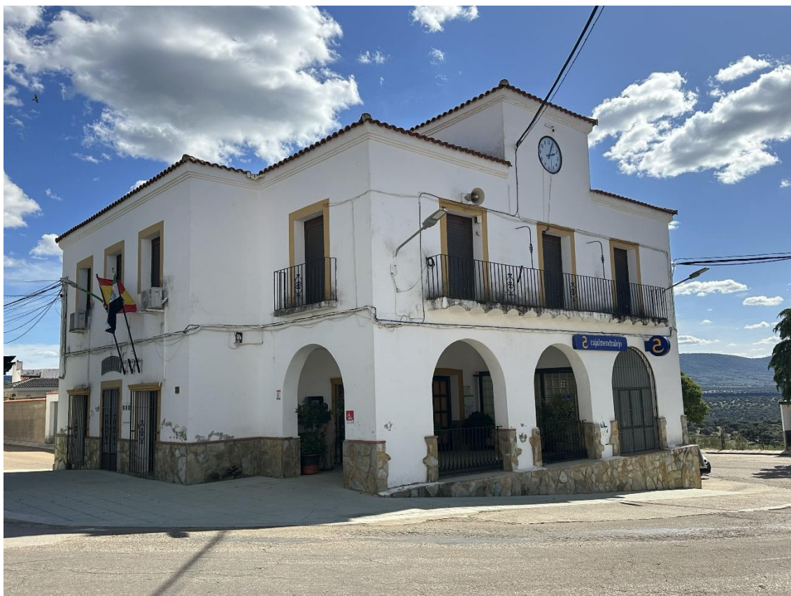
Vista general del Ayuntamiento de Tamurejo.