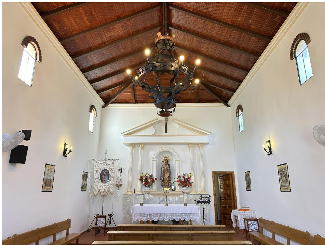
Interior de la ermita.