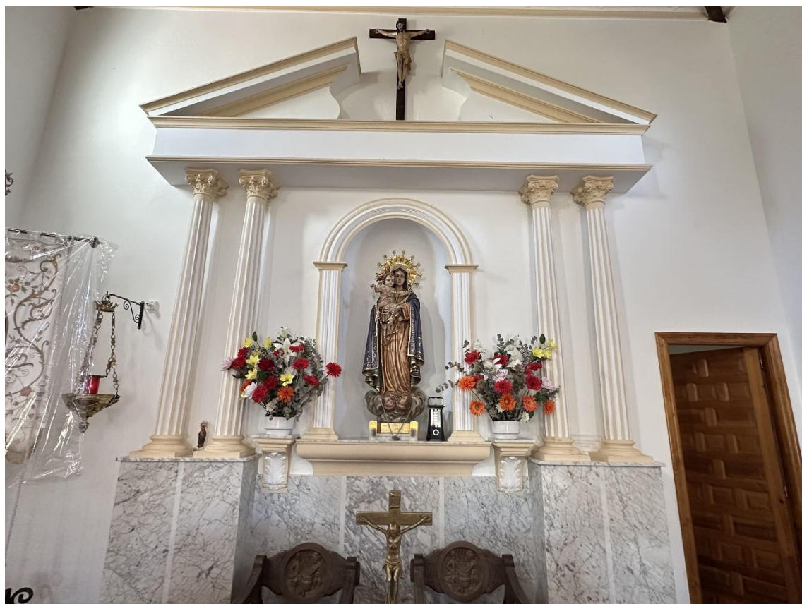
Imagen del altar y puerta de acceso a la sacristía.