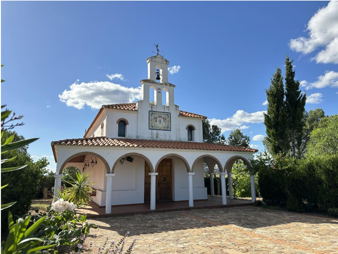
Imagen de la ermita, con una zona frontal porticada de cinco arcos.