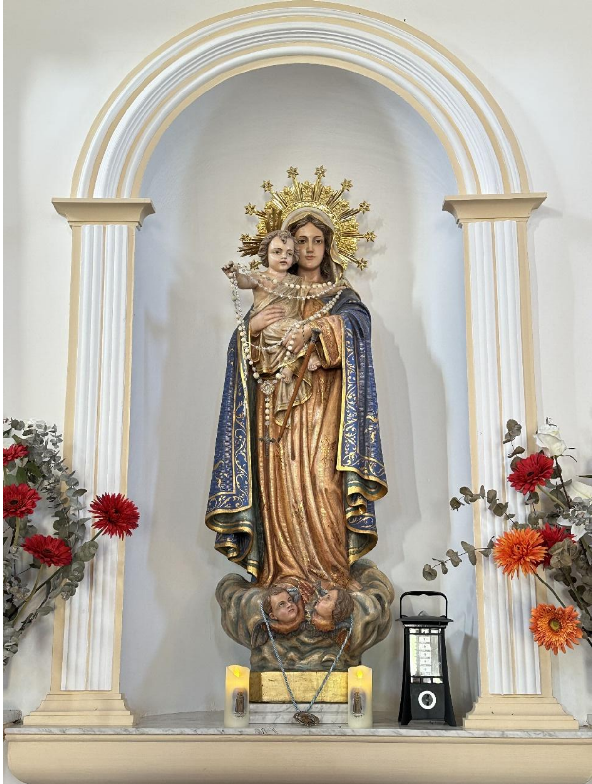
Imagen de Nuestra Señora del Rosario.