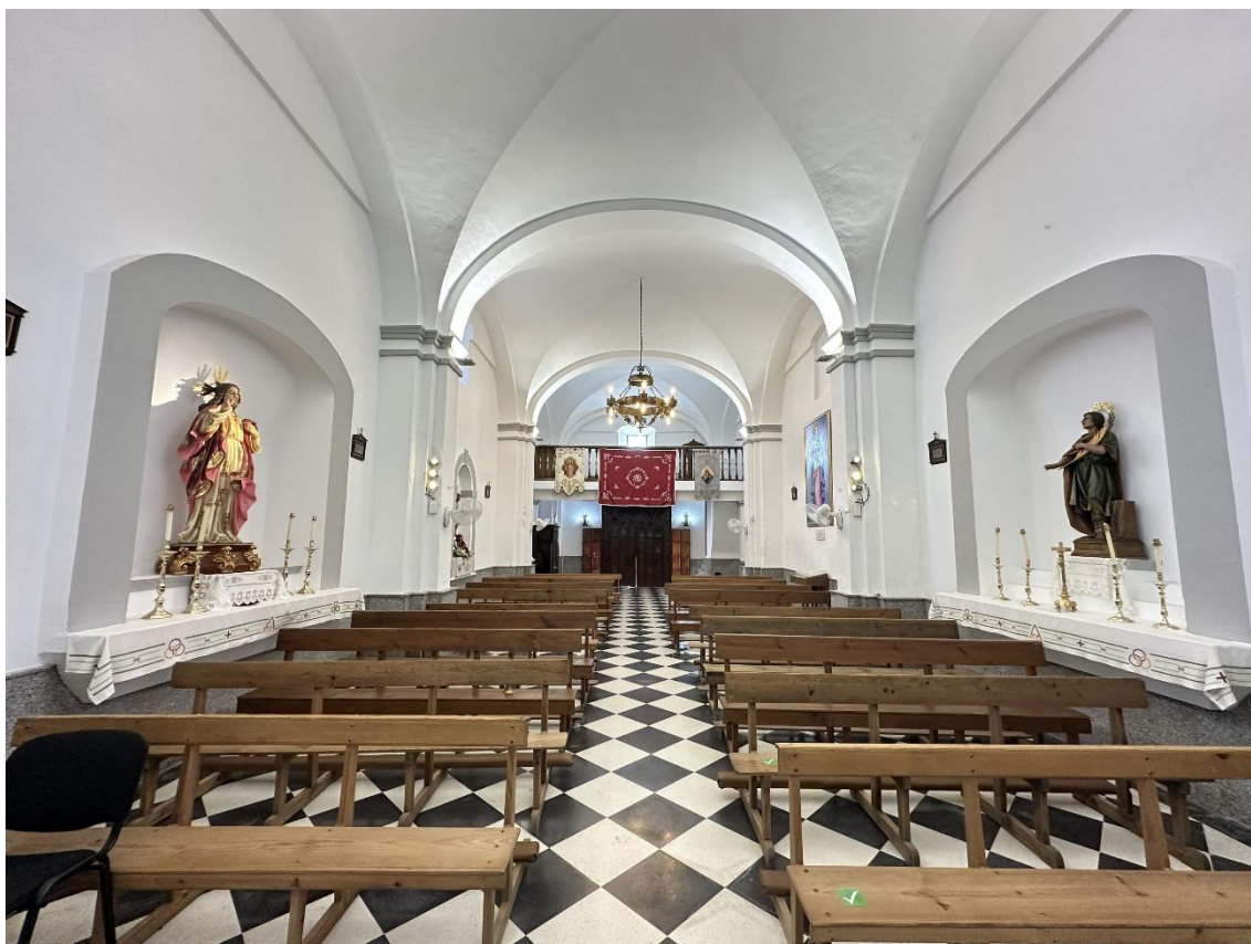
Imagen del templo tomada desde el altar.