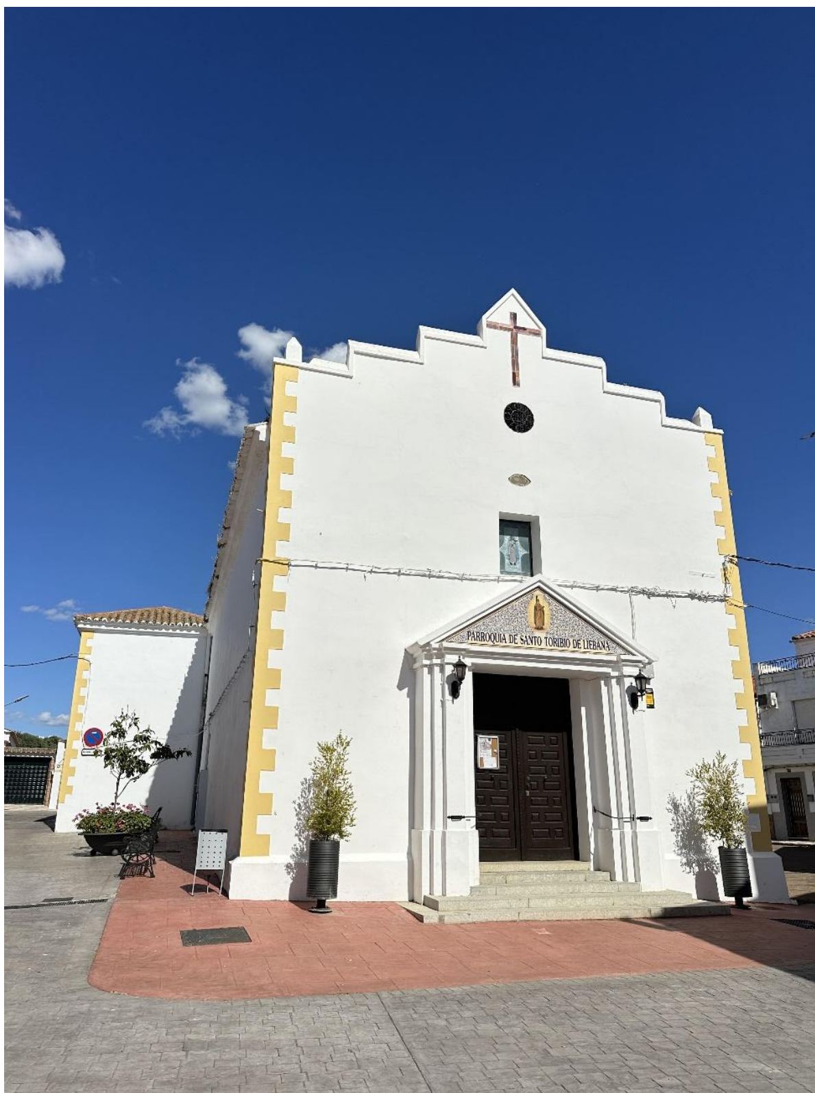
Vista general de la iglesia.