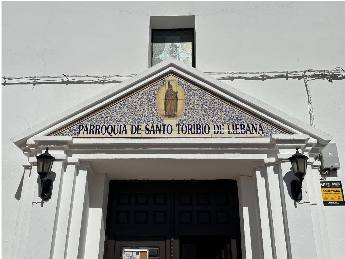
Imagen del acceso a la parroquia de Santo Toribio de Liébana.