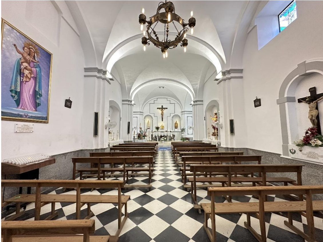
Dos imágenes del interior de la parroquia, de estilo sobrio.