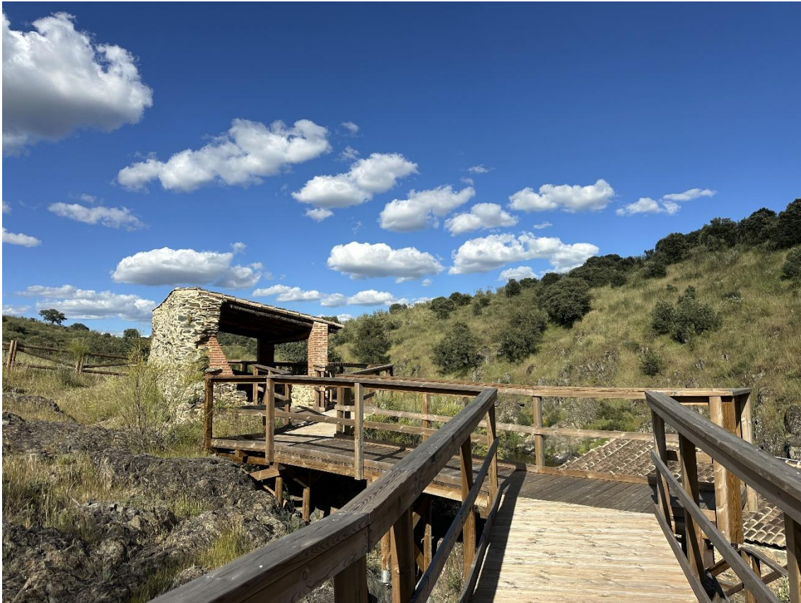
Pasarela de madera construida que une el molino con el puente sobre el río.