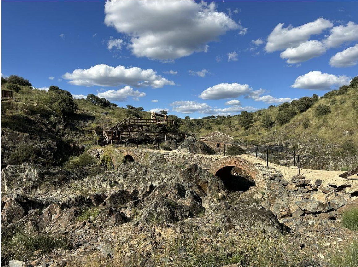
Arriba, el puente sobre el Río Agudo. Abajo, interior del molino, adaptado como centro de interpretación.