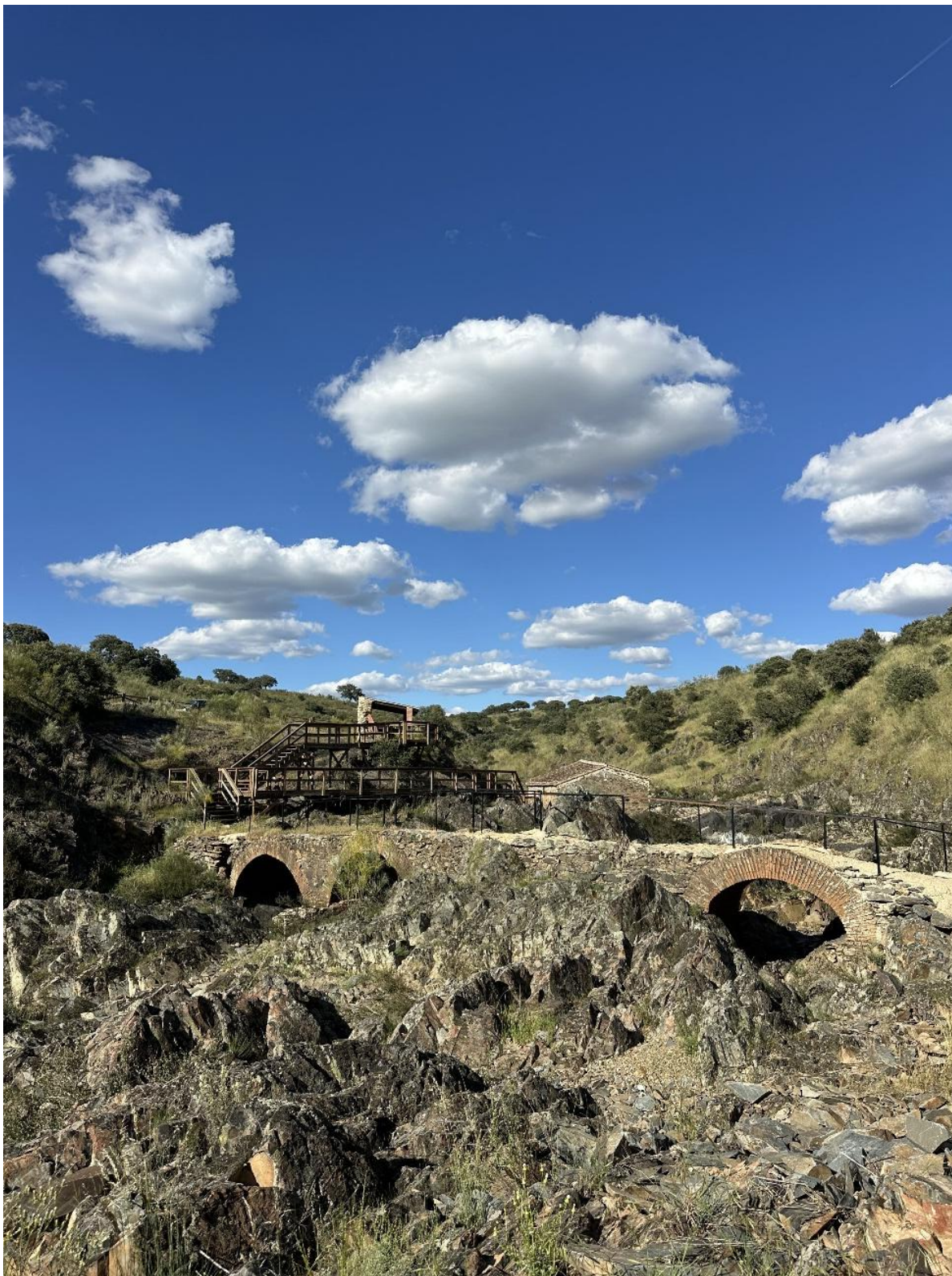
El puente tiene tres arcos de doble rosca de ladrillo que se encuentran distribuidos en dos tramos.